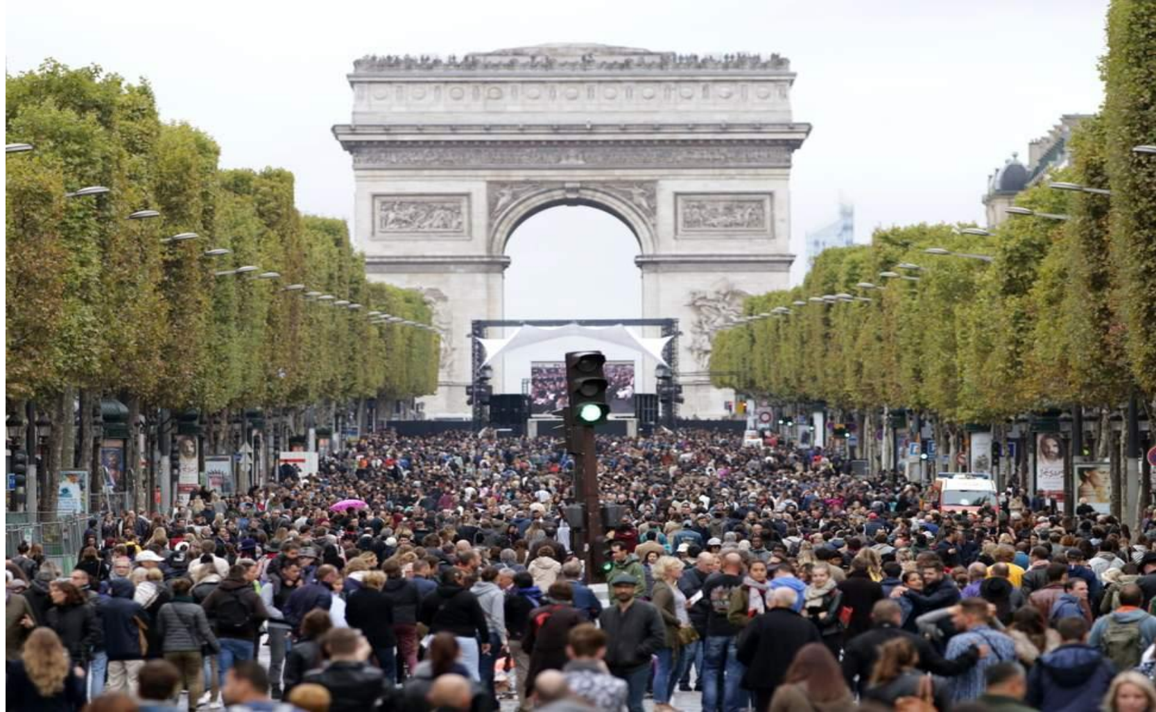
Pedestrians walking along the Champs Elysees during the car free day in Paris