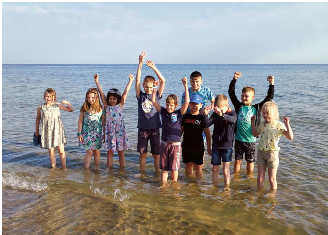
Fundacja wspiera nie tylko świetlice środowiskowe w ich codziennym funkcjonowaniu, organizuje też kolonie

Fundacja organizuje wyjazdy wakacyjne dla dzieci ze świetlic opiekuńczych w całej Polsce. W poprzednim roku zabrała na kolonie 284 podopiecznych. Na wakacjach dzieci poznają siebie i piękno świata, nawiązują nowe przyjaźnie, uczą się samodzielności i odpowiedzialności.