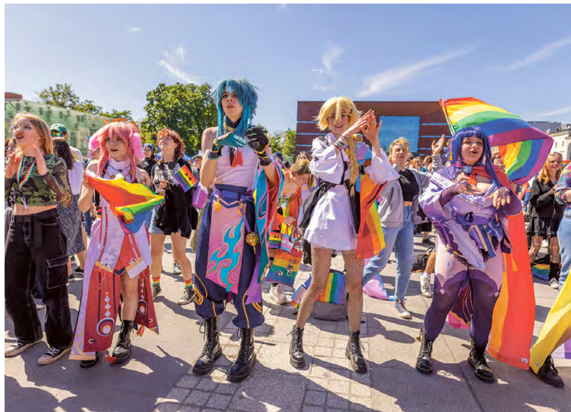
Marsz Równości we Wrocławiu, 2023 r. Królowały hasła: „W Polsce jest miejsce dla nas wszystkich”

Co widzisz, gdy zamkniesz oczy? Jak postrzegasz ludzi, gdy nie obserwujesz ich twarzy, gestów? Czy