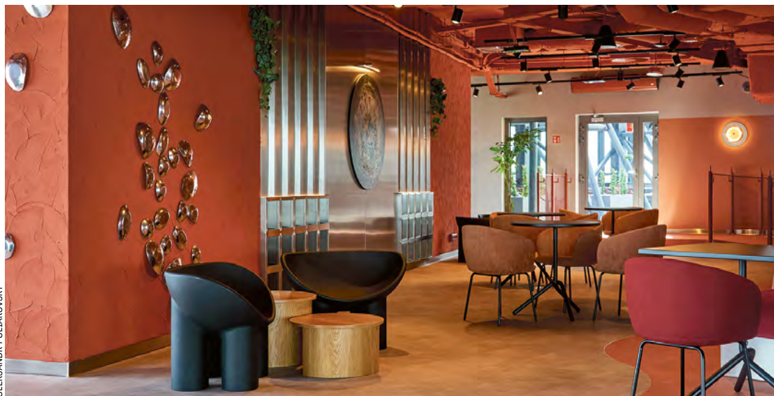
Ale metamorfoza! Tak po remoncie prezentuje się taras widokowy w najwyższym budynku we Wrocławiu