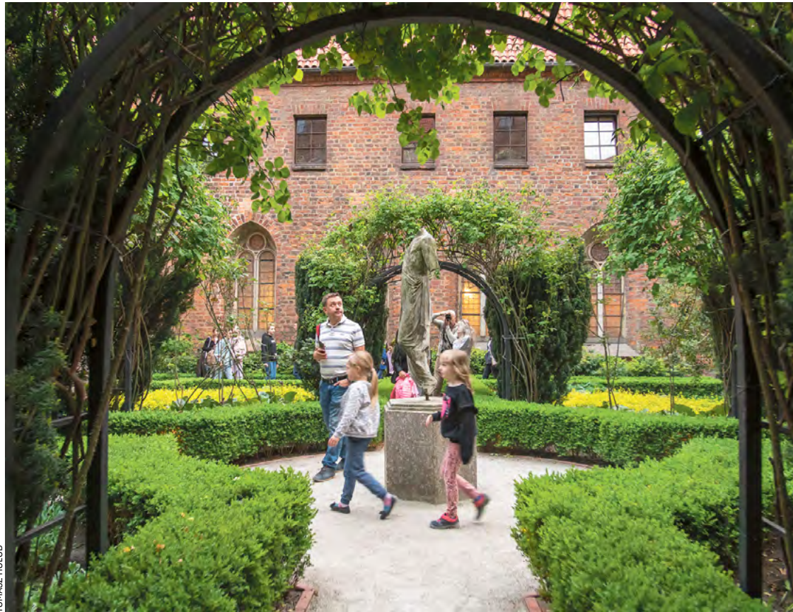
W Muzeum Architektury podczas Nocy Muzeów 18 maja warto zobaczyć piękny, zielony wirydaż

Wiele wydarzeń podczas Nocy Muzeów wymyślono specjalnie dla dzieci. Program przygotowało 31 instytucji, wśród nich: Muzeum Geologiczne, Centrum Kultury Agora, Liceum Sztuk Plastycznych, Młodzieżowe Domy