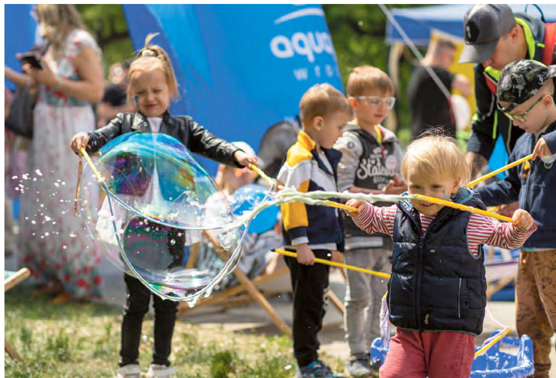
Dni Odry to rodzinne wydarzenia i mnóstwo atrakcji dla dużych i małych fanów żeglugi i dobrej zabawy

Piknik Odrzański , bulwar Xawerego Dunikowskiego (godz. 12-18). Na stoiskach zaprezentują się kluby sportowe, fundacje, organizacje i instytucje związane z Odrą, uczelnie oraz stowarzyszenia działające na rzecz zwierząt. Swoją ofertę przedstawia: Aquapark, Hydropolis, Centrum Historii Zajezdnia, Miejska Biblioteka Publiczna, Wrocławski Ogród Zoologiczny, Muzeum Poczty i Telekomunikacji, Centrum Nauki i Sztuki Stara Kopalnia w Wałbrzychu, Wrocławskie Centrum Rozwoju Społecznego.