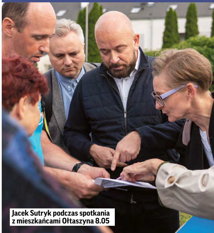
Jacek Sutryk podczas spotkania z mieszkańcami Ołtaszyna 8.05