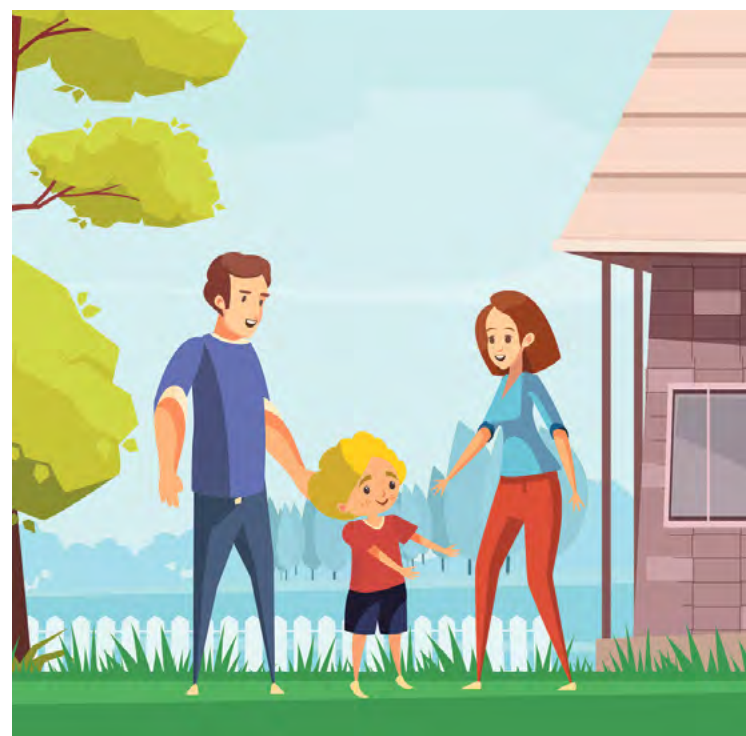
Z okazji Dnia Rodzicielstwa Zastępczego odbędzie się piknik 25 maja

Jeśli mieszkasz we Wrocławiu, jesteś rodziną zastępczą dla dzieci w wieku od 5 do 17 lat, to wraz z twoimi podopiecznymi możesz wziąć udział w konkursie „Wymarzony Dzień Dziecka”, który zorganizował MOPS. Prace można składać do 20 maja. Na zwycięzców czekają niespodzianki.