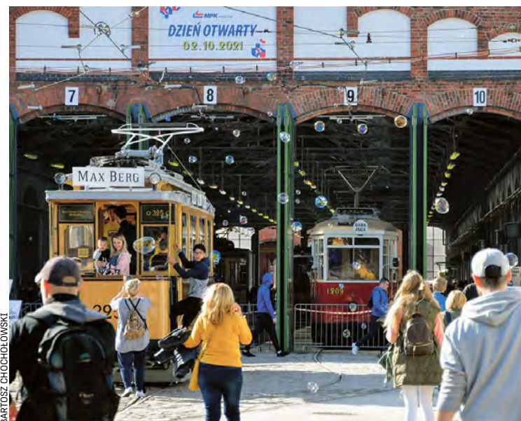
A tak wyglądał Dzień Otwarty MPK na zajezdni Gaj w 2021 roku

MPK Wrocław zaprasza na swoją największą doroczną imprezę – Dzień Otwarty MPK. To jedna z nielicznych okazji, aby zobaczyć zajezdnie od kuchni: miejsca, gdzie autobusy i tramwaje nocują, gdzie są przeglądane, naprawiane i myte.