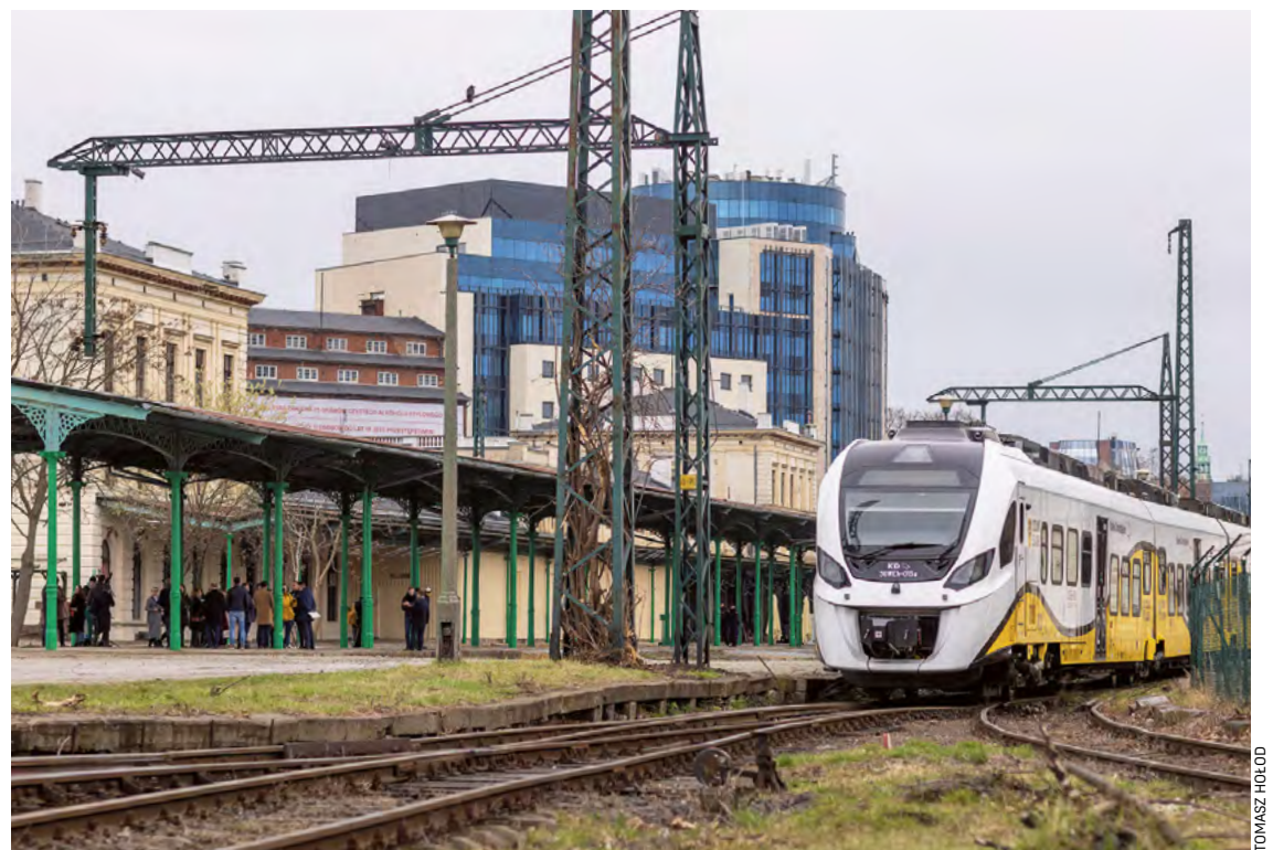
Podczas konsultacji możesz wypowiedzieć się np. na temat odbudowy nieczynnej stacji Wrocław Świebodzki

Inwestycja obejmuje m.in. odbudowę nieczynnej stacji Wrocław Świebodzki. Docelowo z układem trzytorowym: z peronem wyspowym oraz peronem jednokrawędziowym od strony ul. Robotniczej. Dworzec zapewni obsługę pasażerską dwóch linii kolejowych: nr 274 i nr 757. Przed peronami stacja przechodziłaby w układ