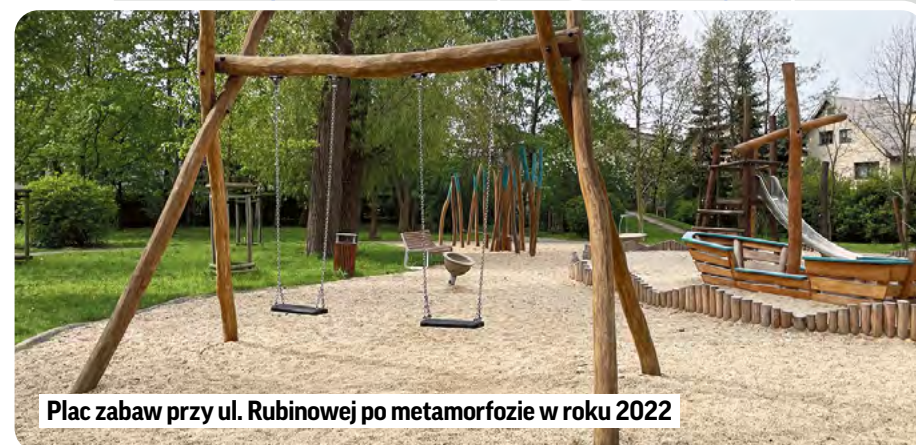
Plac zabaw przy ul. Rubinowej po metamorfozie w roku 2022

fundamenty dawnego kiosku zostały rozebrane, pojawiła się nowa ścieżka, ławki,