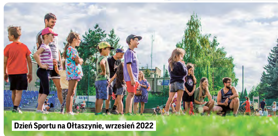
Dzień Sportu na Ołtaszynie, wrzesień 2022

Skwer między ul. Parafialną a Pszczelarską także wygląda inaczej niż kiedyś. W 2020 roku