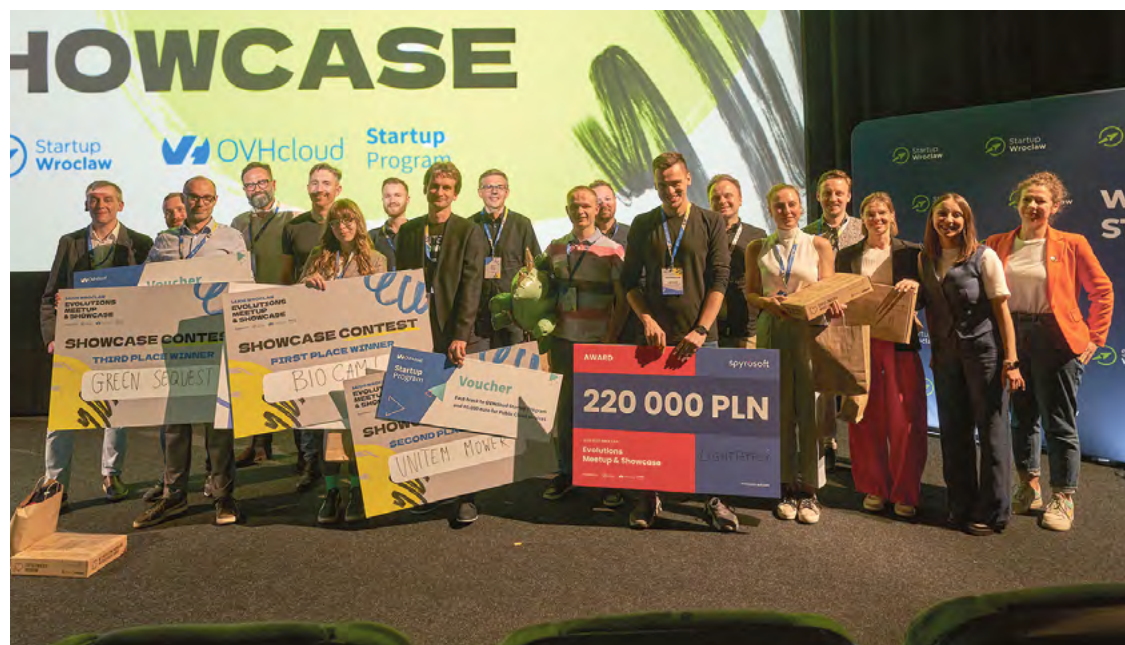
Uczestnicy i laureaci poprzedniej edycji Evolutions: Meetup & Showcase w Kinie Nowe Horyzonty

Evolutions: Meetup & Showcase, czyli największe wydarzenie regionu, gromadzące innowatorów, inwestorów, ekspertów technologicznych i mentorów, ponownie we Wrocławiu. Organizatorzy: Startup Wrocław i OVHcloud Startup Program zapraszają już 19 i 20 czerwca. Wpadniesz po solidną dawkę inspiracji?