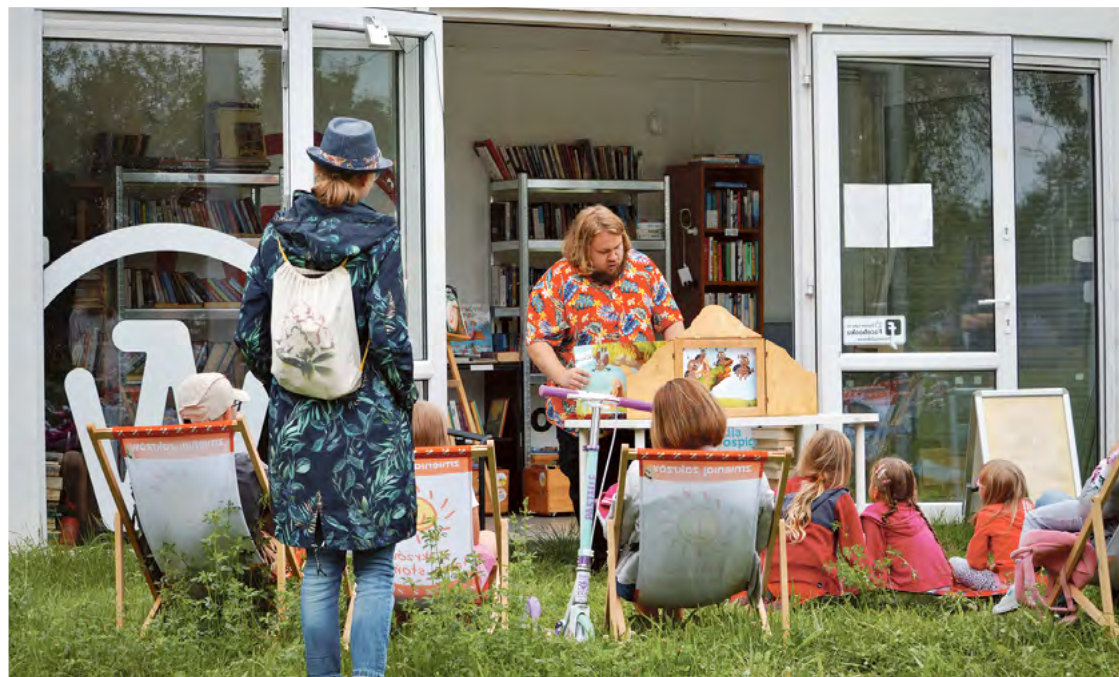
Pokaz teatru kamishibai w Bibliotece Sąsiedzkiej na Zakrzowie w parku Jedności przy ul. Królewskiej 30