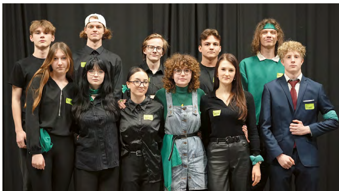
Zespół projektowy z Technikum nr 1 stworzył platformę dzięki konkursowi FUTURE LEADERS

Uczniowie Technikum nr 1 w Zespole Szkół nr 1 przy ul. Słubickiej stworzyli platformę, która pomoże młodszym kolegom w wyborze szkoły ponadpodstawowej. Na czym polega? Umożliwia wybór szkoły w oparciu o szersze dane, niż rankingi, które bazują głównie na wynikach matur. Jest tzw. dopasowywarką szkół.