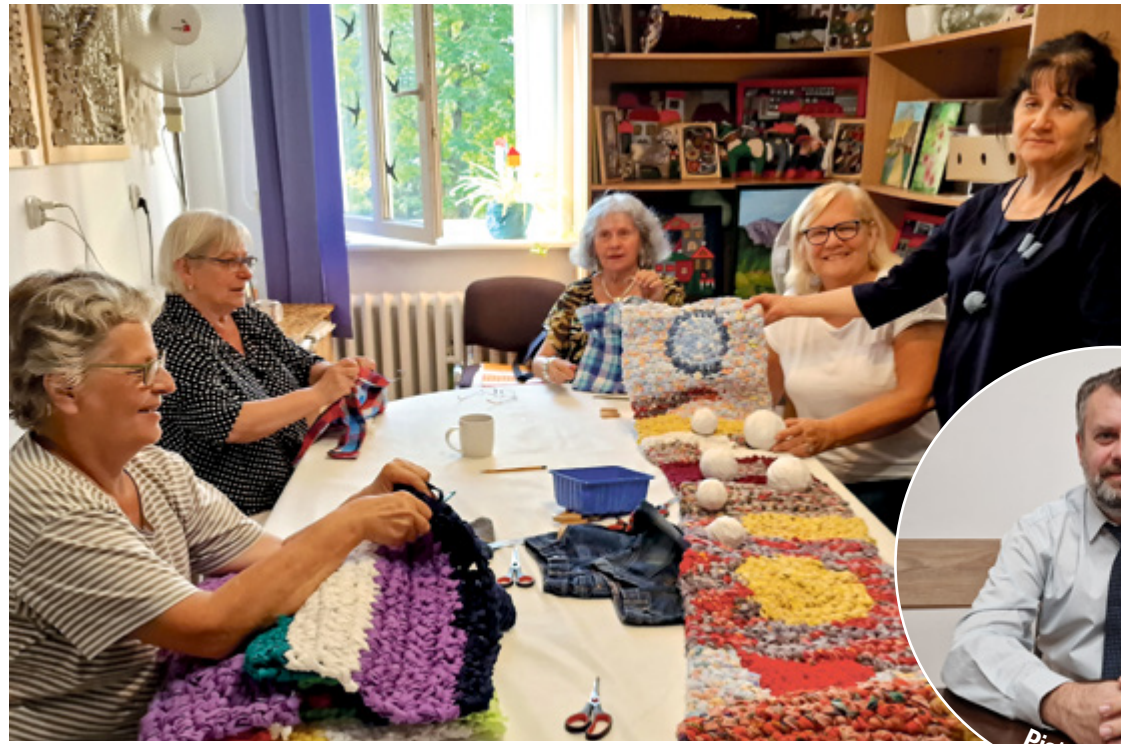
Członkinie DOPZG podczas terapii zajęciowej tworzą patchworki, które potem trafiają na wystawę