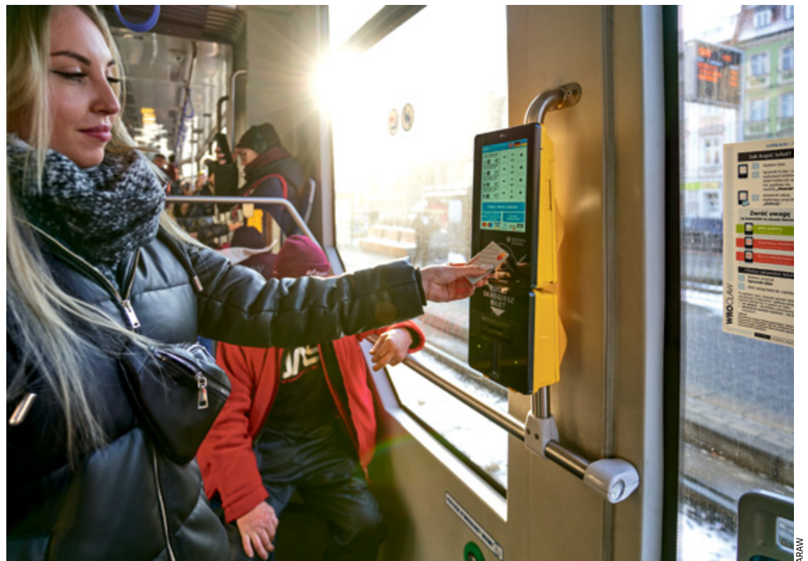
Kupiłeś bilet okresowy na określoną linię? Jeździj na nim jak dotychczas, ważne, żeby trasa się zgadzała

Zagwozdkę mogą mieć osoby, które kupiły bilet długookresowy na dwie linie, bo po zmianach w komunikacji niektóre tramwaje i autobusy jeżdżą inaczej, a bilet wykupiony „po sta-