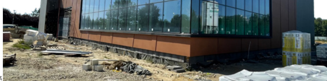
Budynek nowego basenu na Psim Polu ma już swoją bryłę. W środku trwają prace wykończeniowe

skiej pracę kończą dekarze – nakładane są warstwy izolacyjne na dachu.