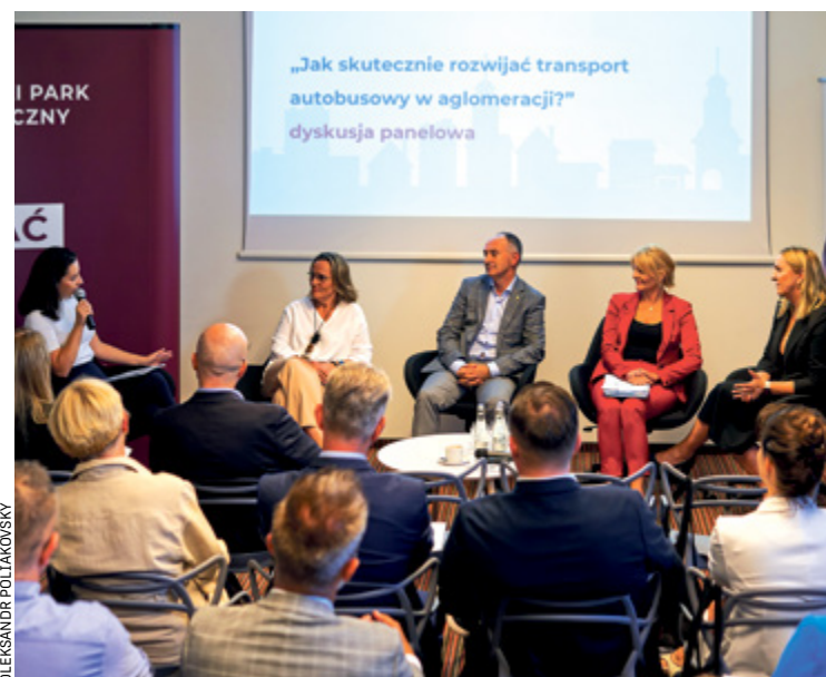
Debata o wspólnym systemie URBANCARD odbyła się 18.09 w WPT

Jeden bilet, jeden system i wszystko jasne. Tak będzie dla pasażerów autobusów 9XX. Wystarczy URBANCARD. To aglorewolucja!