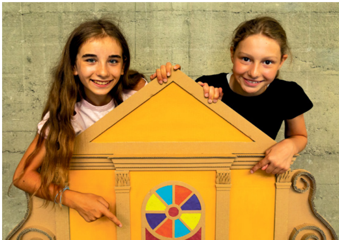
Warsztaty architektoniczne w Hali Stulecia przeznaczone są dla dzieci w wieku 6-10 lat i młodzieży 11-15 lat

Dziecięce i Młodzieżowe Studio Architektury to program cyklicznych warsztatów edukacyjnych poświęconych architekturze, projektowaniu i przestrzeni współczesnego miasta. To właśnie tutaj rozwijają się talenty pokroju Maksa Berga!