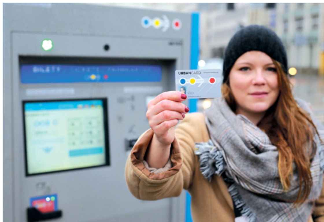
Карту URBANCARD можна виробити в одному з 5 вроцлавських пунктів продажу електронних квитків

Виготовлену картку можна забрати в одному з відділень після 2-х робочих днів з дня прийняття