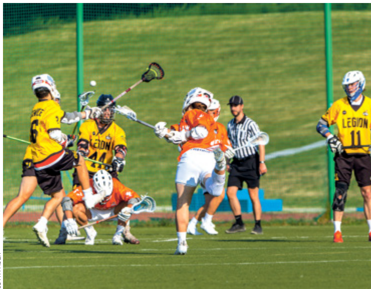
Lacrosse jest uznawany za pierwowzór hokeja na lodzie

Lacrosse to najszybszy sport na dwóch nogach i najlepiej rozwijająca się dyscyplina drużynowa na świecie. Wywodzi się z tradycji plemion irokeskich, które do dzisiaj mają ogromny wpływ na tę dyscyplinę. Jest sportem zawodowym i uniwersyteckim w USA i Kanadzie. Uczelnie rywalizują ze sobą także w Wielkiej Brytanii, Skandynawii, Niemczech, Japonii.