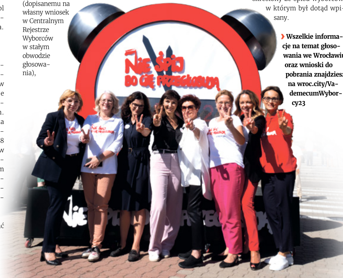
Kampanię promuje zegar odliczający czas do wyborów, który stoi przed Pałacem Kultury w Warszawie

➤ Wszelkie informacje na temat głosowania we Wrocławiu oraz wnioski do pobrania znajdziesz na wroc.city/VademecumWyborcy23