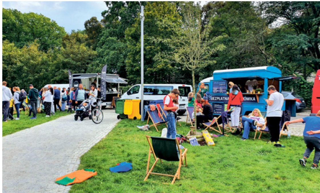
Piknik przy Żabiej Ścieżce, 2022. Cały program tegorocznych Dni Trójkąta na www.dnitrojkatapl