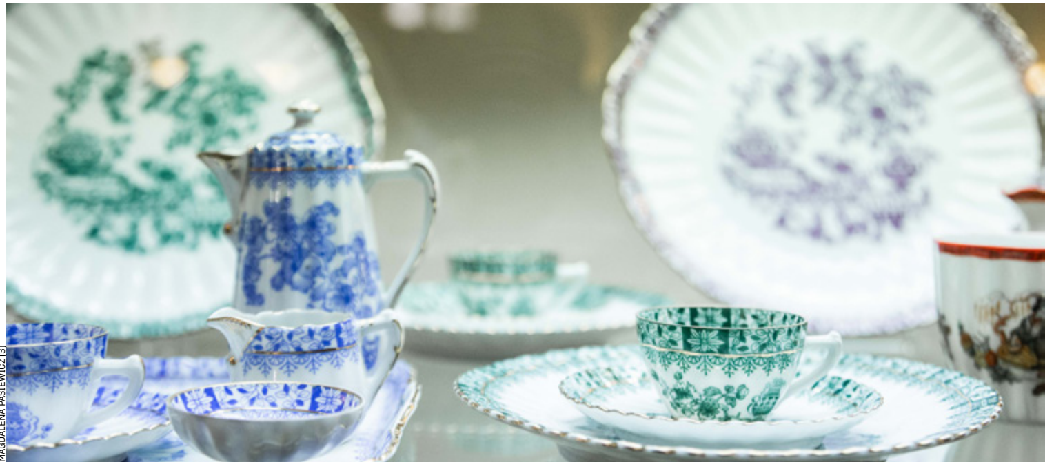
Wyjątkowo delikatne eksponaty na wystawie „Śląsk: kraina porcelany” w Starym Ratuszu we Wrocławiu obejrzymy do końca grudnia tego roku

Śląska porcelana słynęła z wysokiej jakości. – Była świetna, nie ustępowała klasą np. porcelanie z Wielkiej Brytanii, która miała nieco inny skład. Ogólnie porcelanę wytwarzano na Śląsku, łącząc