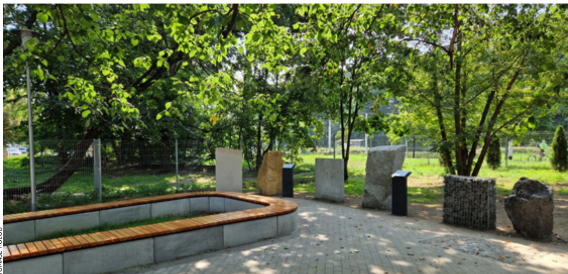
Kozanowska Osada Przygody. Etap 1. To projekt WBO 2020 oddany do użytku w tym roku na ul. Kolistej

Listę 113 zakwalifikowanych w tym roku projektów znajdziecie na kolejnych stronach.