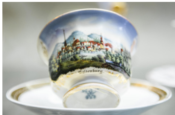
Filiżanka ze spodeczkiem z widokiem Wałbrzycha (Waldenburg)