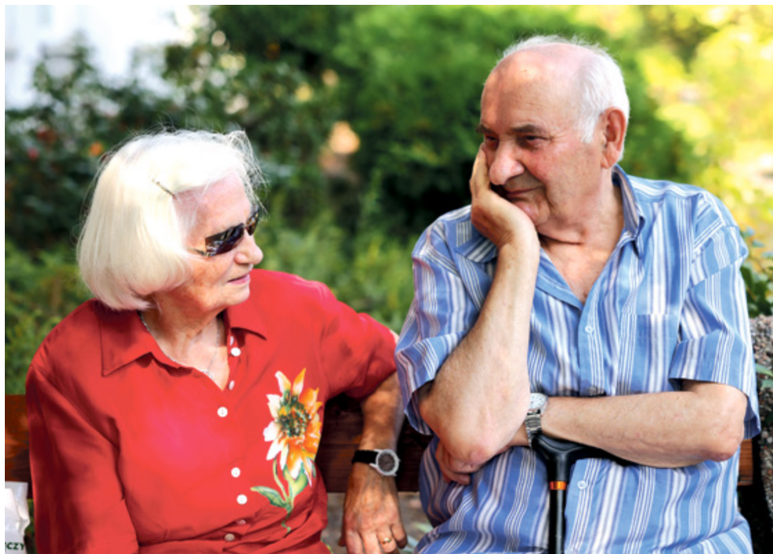
Wrocławscy seniorzy mogą korzystać z pensjonatu Miejskiego Ośrodka Pomocy Społecznej już od 30 lat