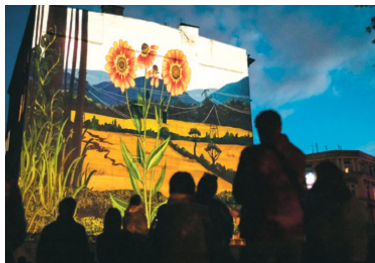
Кіномурал 2023 у місті Вроцлав відбудеться 23 вересня

Вже зовсім скоро Вроцлав перетвориться на нічну казку, адже на жителів міста чекає ніч відкритої галереї. Фасади будівель нагадуватимуть великі полотна відомих художників світу. Кіномурал 2023: місце проведення, програма, години роботи, читайте далі у матеріалі.