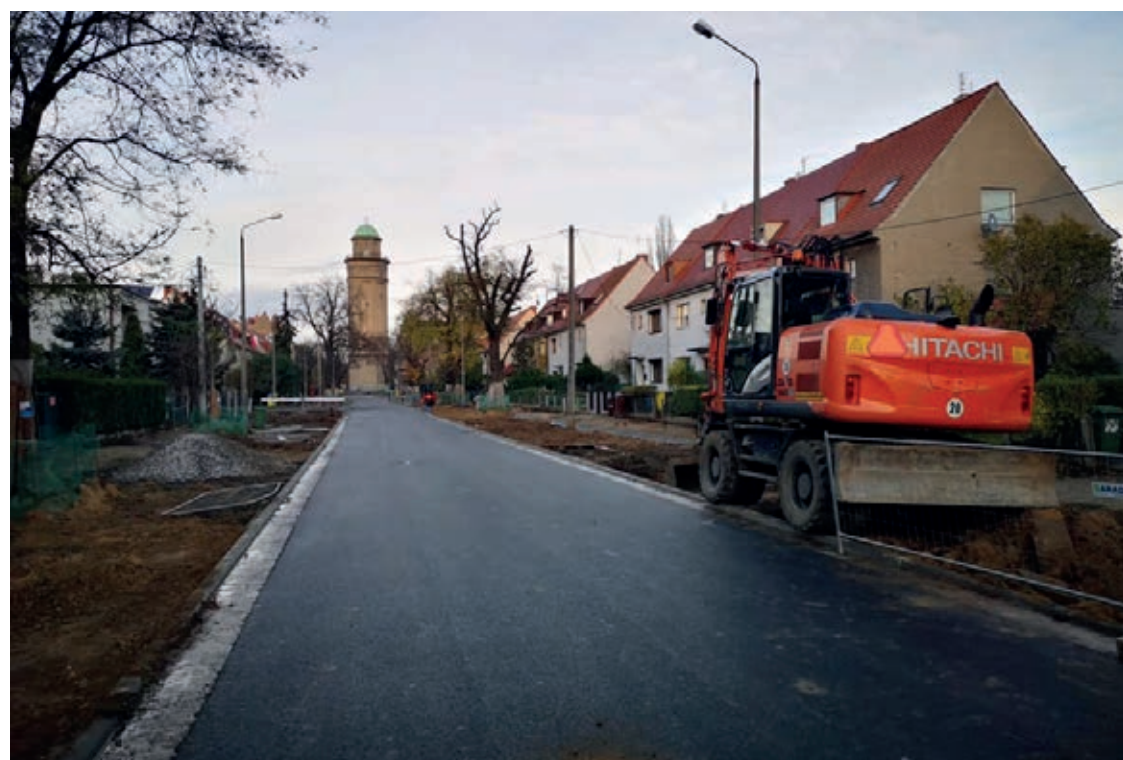
Wykonawca ułożył już trzy warstwy nawierzchni na ulicy Berenta

– Remont trwa prawie rok, więc cieszę się, że zbliża się do