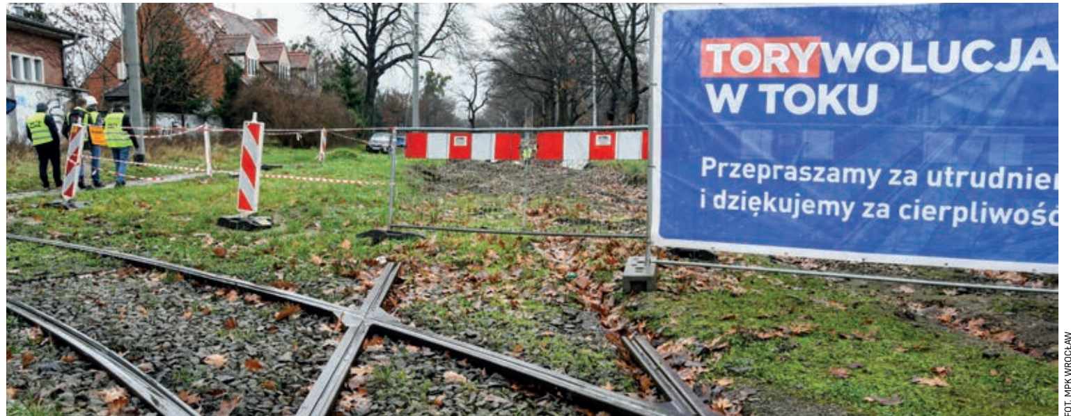
Do marca 2021 ma się zakończyć remont torowiska na ul. Olszewskiego. Po przerwie na plac budowy wrócili robotnicy

Dobra wiadomość dla mieszkańców wrocławskiego Biskupina: będą nowe szyny, a stare dęby zostaną oszczędzone.