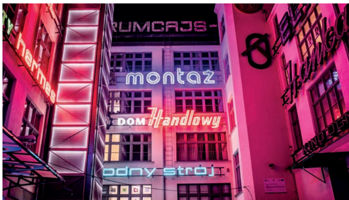
Galeria Neonów przypomina, że Wrocław zawsze słynął z iluminacji.

– Odnowiono nawierzchnię z kamiennego bruku i zadbano o jej odpowiednie odwodnienie. Wyeksponowano strefy wejść do budynku i lokali bezpośrednio z podwórza. Oprócz tego mocno ograniczono