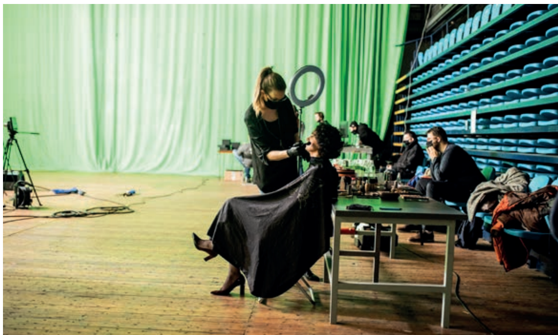
W hali zdjęciowej Centrum Technologii Audiowizualnych laureaci 30 Kreatywnych przyznawali, że mają lekką treść, bo nie co dzień dostaje się nagrody

Gospodarze programu wraz z kilkunastoosobową ekipą realizatorów: kamerzystów, dźwiękowców, fachowców od efektów specjalnych, przez niemal cały piątek, 4 grudnia, pracowali w hali zdjęciowej Centrum Technologii Audiowizualnych. W intensywnie oświetlonej reflektorami sali połowę ścian wypełnia jaskrawozielony materiał z naniesionymi znakami. To największy w Polsce greenbox, technologia wykorzystywana w realizacji filmów i programów telewizyjnych. – Daje nam olbrzymie możliwości technologiczne. Podczas gali 30 Kreatywnych będziemy