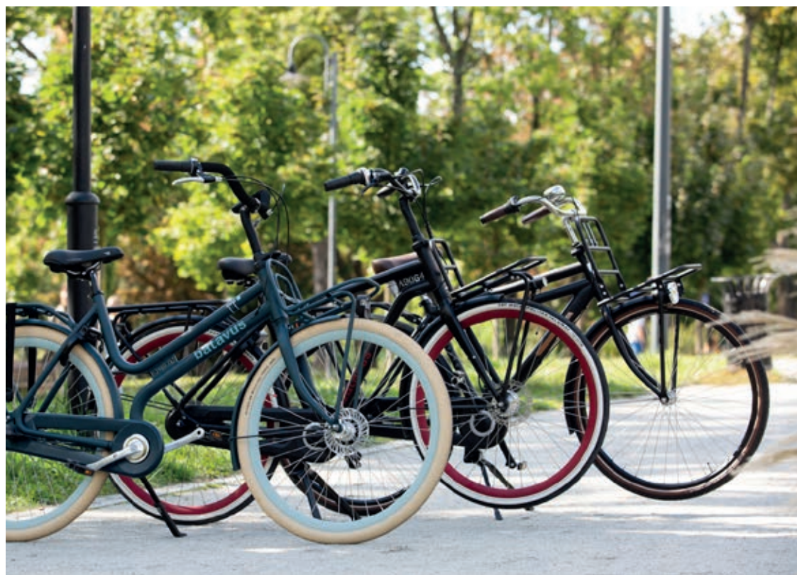
Oto trzy nagrody główne od firmy Stylowe Rowery dla laureatów rywalizacji

Wręczenie nagród głównych (statuetek, rowerów, bonów do serwisu rowerowego i na kurs angielskiego) zaplanowane jest na 18 grudnia we wrocławskim aquaparku. Gala zostanie transmitowana online. Pozostałe 170 nagród będzie do odbioru w namiocie przed Centrum Obsługi Mieszkańca przy ul. Zapolskiej w dniach 18, 21 i 22 grudnia w godz. 17.30-19.00.