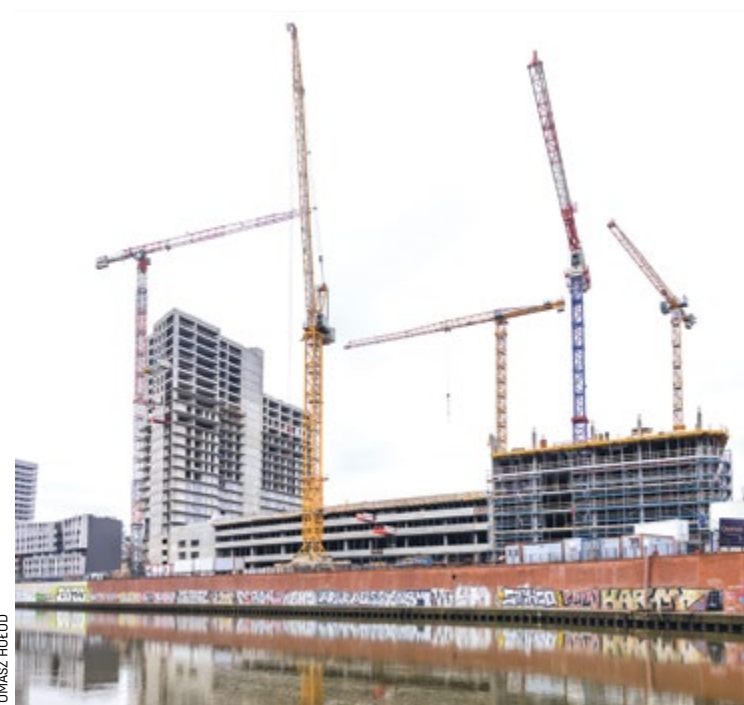
Budowa kompleksu wieżowców Quorum przy ulicy Sikorskiego

Przy ul. Sikorskiego na wrocławskim Szczepinie powstaje wielofunkcyjny kompleks wieżowców Quorum. Buduje się tu drugi, po Sky Tower, najwyższy budynek we Wrocławiu. Cała inwestycja ma być gotowa pod koniec 2023 roku.