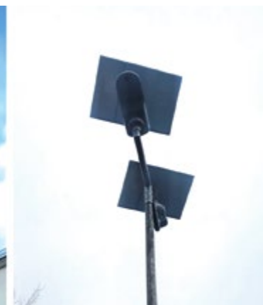
Lampy solarno-ledowe zamontowano testowo na Ołbinie, Muchoborze Małym i Przedmieściu Świdnickim