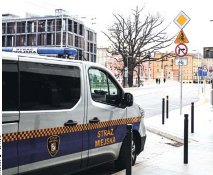
Kierowcy jeżdżą ostrożnie, jakby nie byli pewni, czy są już otwarte

Kierowcy od 30.01 mogą poruszać się po wyremontowanych mostach Pomorskich. Strażnicy miejscy obserwują płynność jazdy, działanie sygnalizacji świetlnej i zachowania kierowców.