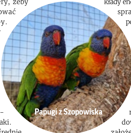
Papugi z Szopowiska

nie płaci (śmiech). To moja pasja (tak samo jak praca weterynarza), więc nie narzekam. Schody pojawiają się w nieprzewidzianych sytuacjach, jak np. nagła choroba któregoś ze zwierzątek, wtedy trzeba wyczarować dodatkowe pokłady energii i czasu, żeby sprawę ogarnąć, ale póki co się udaje.