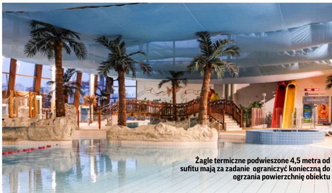
Żagle termiczne podwieszane 4,5 metra od sufitu mają za zadanie ograniczyć konieczną do ogrzania powierzchnię obiektu

– Nie kupujemy gazu od PGNiG, ale bezpośrednio na giełdzie paliwowej. Generalnie, porównując rok do roku, koszty prądu i gazu są wyższe o 400–500 proc. To nie zapowiadane 1200, ale wciąż sporo więcej. By te koszty ograniczyć, między innymi założyliśmy żagle termiczne. To 2300 mkw. specjalnej tkaniny podwieszanej 4,5 m od sufitu. Zmierzyliśmy, że pod żaglem jest o 4 stopnie cieplej niż nad nim. To zysk energetyczny rzędu 20 proc. Pamiętajmy, że 54 proc. ceny biletu to te koszty: ogrzania wody, powietrza czy saun – opisuje dyrektor obiektu na Borowskiej Kornel Kempniński.