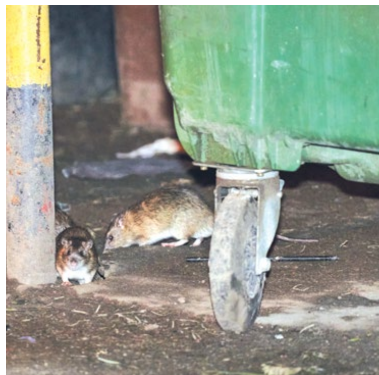
Szczury poszukują jedzenia, dlatego warto dbać o porządek koło domu

Rusza specjalna interwencyjna deratyzacja w nieruchomościach i na terenach należących do gminy. Na ekranach komunikacji miejskiej odbędzie się także akcja edukacyjna.