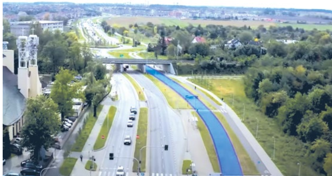
Fragment planowanego specjalnego pasa dla autobusów na Jagodno, biegnący obok kościoła przy ul. Bardzkiej

Na początku 2025 autobusy powinny pojechać na Jagodno wydzielonym pasem. Powstanie 5 par przystanków, miejsce na torowisko, a na końcu trasy – nowa pętla z parkingiem dla aut i rowerów. Nową drogę zbuduje firma od mostów Pomorskich.