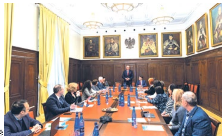
Зустріч у Вроцлавській політехніці, присвячена інавгурації проекту «Unite!», січень 2023 р.