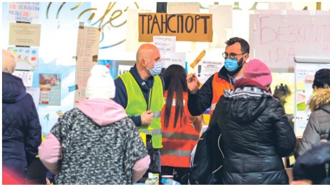
Лютий 2022, Біженці з України і польські волонтери на Залізничному Вокзалі у Вроцлаві

Найважливіші зміни, що викладені в оновленому Законі, пов'язані із ущільненням сис-