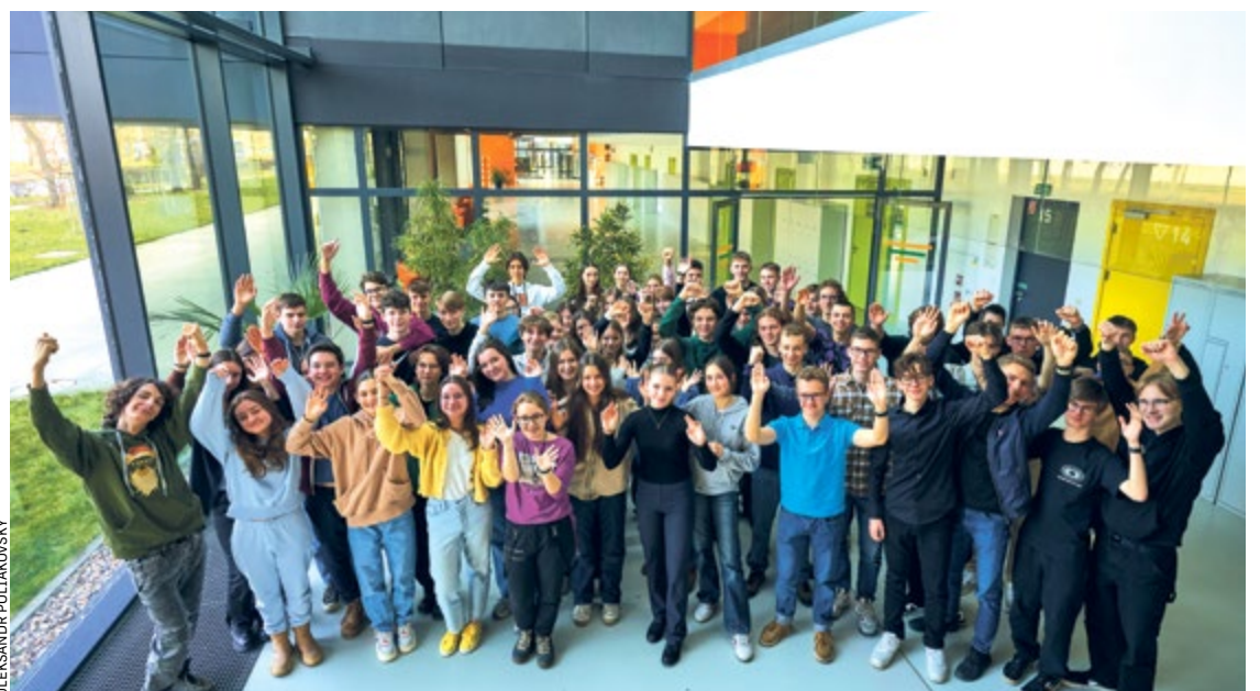
Uczniowie V Liceum Ogólnokształcącego, którzy uczestniczą w Szkolnej Internetowej Grze Giełdowej

W tym roku trzy klasy z V LO rozegrały w panelu edukacyjnym. Zajęli pierwsze (II F), trzecie (IV F) i czwarte miejsce (I D). W dodatku 1 D została najlepiej oceniona wśród wszystkich klas pierwszych w Polsce.