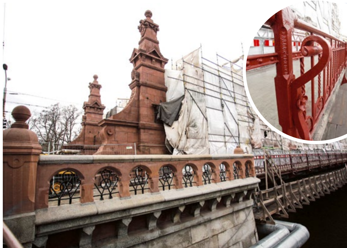
Most Zwierzyniecki cały czas jest przejezdny. Barwa balustrad to czerwień żelazowa (zdz. w kółku)

– Chodnik północny jest gotowy, ruch pieszy i rowerowy odbywają się po nim od lipca minionego roku. Wymaga jeszcze położenia granitowych płyt, które zostaną zamontowane na samym końcu inwestycji – aby nie uległy uszkodzeniu bądź zabrudzeniu