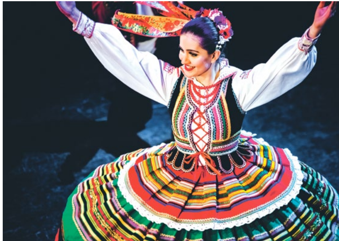
Tancerka Reprezentacyjnego Dolnośląskiego Zespołu Pieśni i Tańca „Wrocław” w stroju lubelskim

Na repertuar zespołu składają się tańce, pieśni i przyspiewki z kilku regionów Polski (m.in. lubelskiego, rzeszowskiego, krakowskiego i wielkopolskiego). A jak będzie wyglądał koncert? – Będą radosne, żywiotowe oberki i polki, liryczne i melancholijne kujawiaki, nie zabraknie oczywiście dostojnego poloneza. Tańce narodowe i regionalne. Wytniemy kilka hołubców,