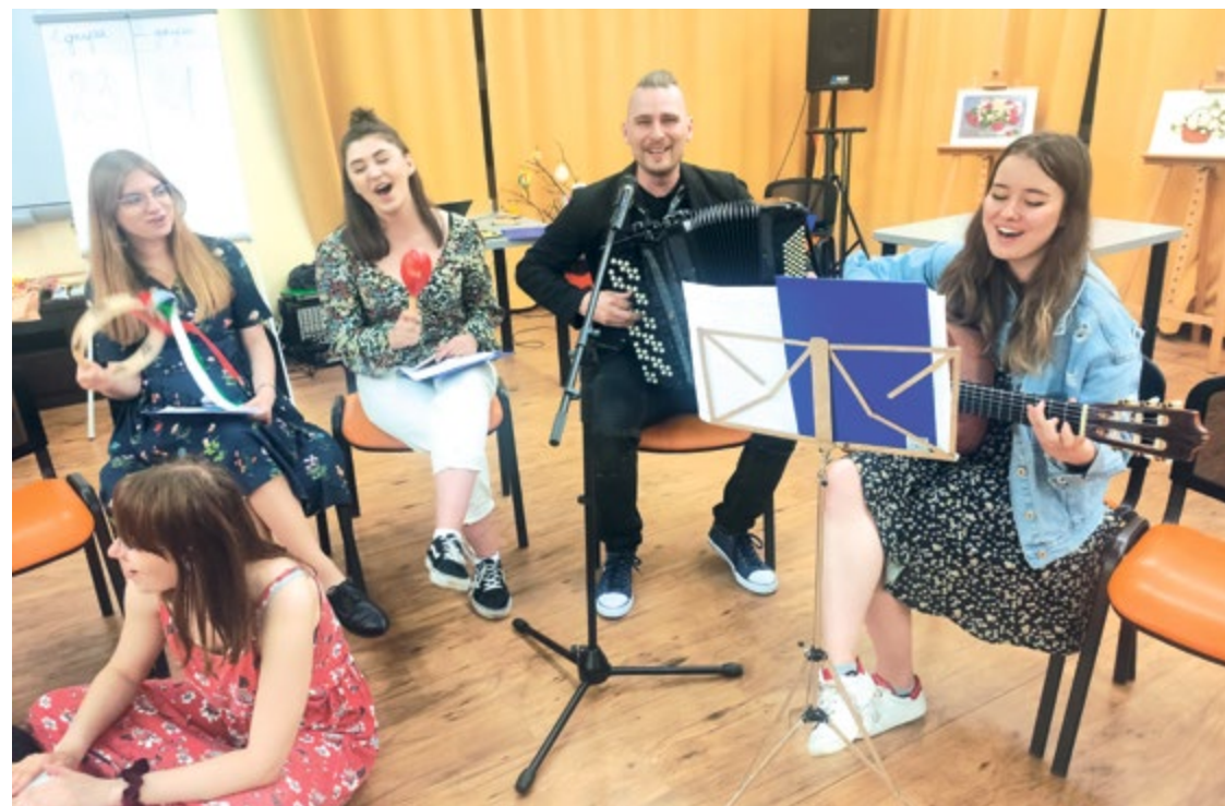
Studenci z Koła Naukowego Muzykoterapii Akademii Muzycznej we Wrocławiu podczas koncertu

Wnioski o dofinansowanie należy składać w Biurze Współpracy z Uczelniami Wyższymi, Rynek 13, II piętro lub za pośrednictwem platformy ePUAP do 23.03.2023 r.