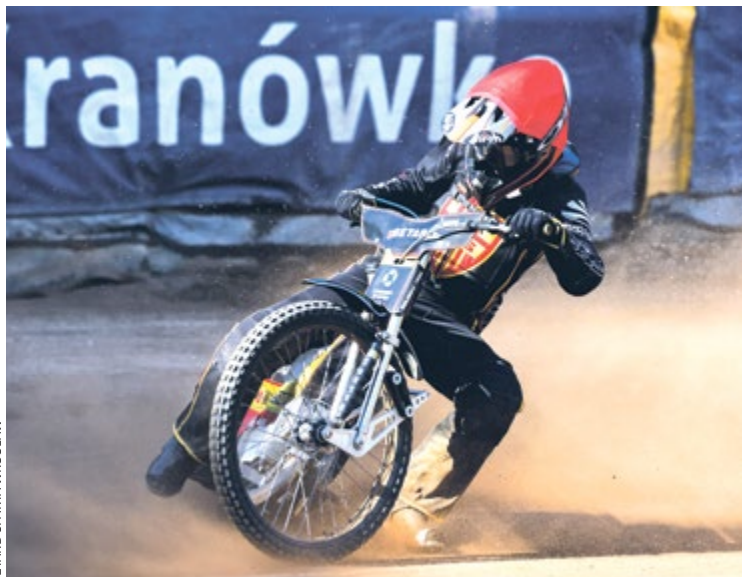
Do każdej z grup w szkółce przechodzi po selekcji ok. 5-6 zawodników

➤ Formularz na stronie wroc-city/ZgłoszenieKandydata