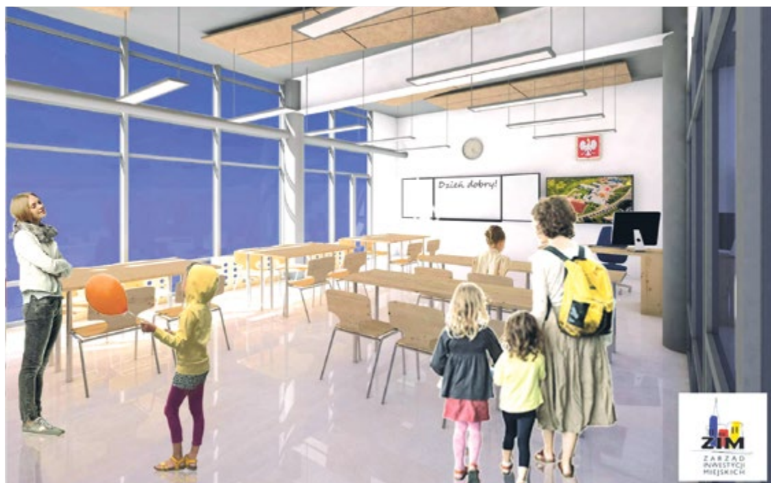
Wizualizacja nowej sali w budynku Zespołu Szkolno-Przedszkolnego nr 12 na Maślicach we Wrocławiu

Do wymiany są okna i drzwi. Poza tym trzeba wyremontować elewację budynku głównego, a także przebudować instalacje: sanitarną, grzewczą i teletechniczną. Przetarg na to zadanie ma być ogłoszony wkrótce przez