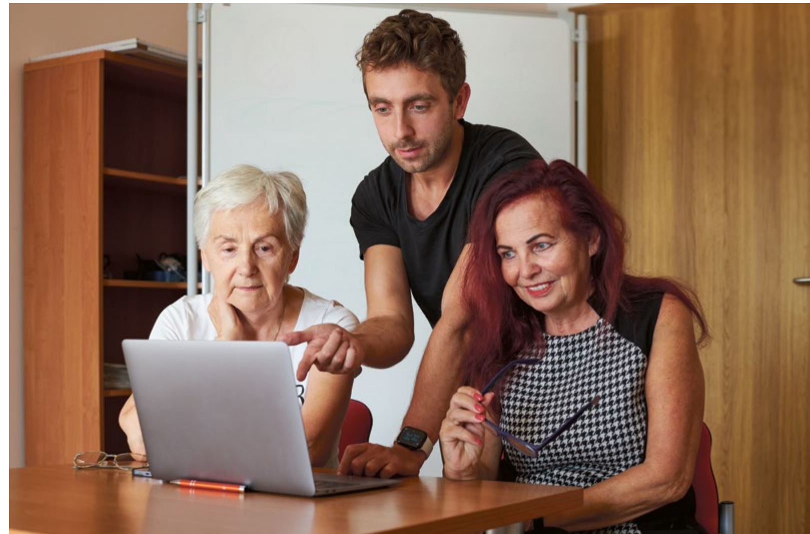
Jak rozliczyć się przez internet, seniorzy dowiedzą się podczas szkoleń we Wrocławskim Centrum Seniora i Przestrzeni Trzeciego Wieku (patrz ramka)

Pracownicy z Ukrainy, którzy otrzymają od polskiego pracodawcy PIT-11 za rok 2022 i nadal tu mieszkają i pracują, są zobowiązani do złożenia deklaracji PIT 37, jako osoby posiadające status rezydenta podatkowego w Polsce. Tylko jeśli pracownik był zatrudniony krócej niż 183 dni w roku nie musi składać PIT-37. Jeśli w ciągu 2022 roku osoba z Ukrainy pracowała w Polsce na kilku etatach, to z każdej firmy powinna otrzymać osobne deklaracje PIT-11. Każdy z nich powinna wykażać w swoim jednym formularzu sprawozdawczym PIT-37 za 2022 rok.