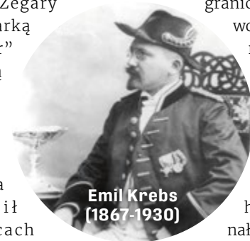
Emil Krebs (1867-1930)

Z Wrocławia do Świebodzic jest 70 km. Przejazd zajmuje nieco ponad 1 h. Najlepiej ruszyć A4 w stronę granicy z Niemcami. Na węźle Kostomłoty zjeżdżamy w kierunku Strzegomia, a stamtąd w stronę Świebodzic. Pociągami dojedziemy w 55 minut.