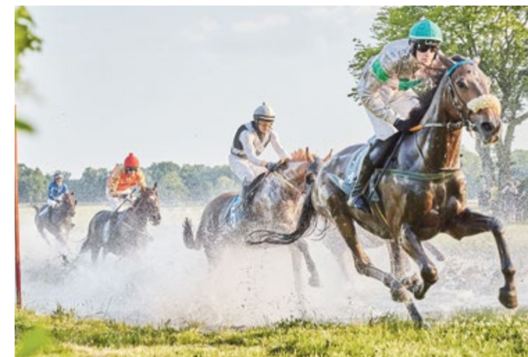
Na torach na Partynicach 3 maja odbędzie się aż osiem gonitw

Obejrzyj galerię zdjęć na www.wroclaw.pl