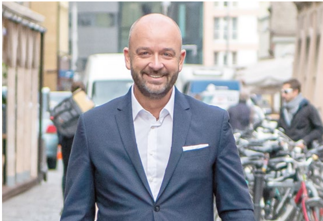
– Dla zameldowanych mieszkańców przygotowaliśmy pakiet korzyści – zachęca prezydent Sutryk

Od danych meldunkowych uzależnione są na przykład wielkości budżetów rad osiedli. Więcej środków otrzymują te osiedla, gdzie zameldowanych jest więcej mieszkańców. Zyskują również ci, którzy na osiedlach mają wyznaczone Strefy Płatnego Parkowania. Płatne miejsca parkowania zapewniają większą rotację samochodów i gwarantują, że w pobliżu domu znajdziemy miejsce postojowe. Bo zameldowany mieszkaniec nie musi