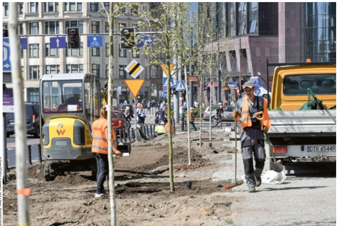
GRZEGORZ RAJTER, MAREK KSIEŻAREK

Oczywiście, że nie. Średnio w ciągu ostatnich 5 lat na terenach, które podlegają ZZM, rocznie wycinamy ok. 1400 chorych lub uszkodzonych drzew. Za tym idą jednak nasadzenia, których mamy średnio 2700 rocznie. Czyli jesteśmy na plusie,