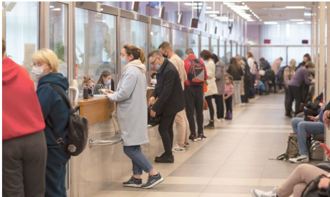
Numer PESEL obywatele Ukrainy mogą otrzymać w Centrach Obsługi Mieszkańca UM Wrocławia

Osoby, które zdecydowały się przyjąć pod swój dach uchodźcę z Ukrainy, mogą ubiegać się o dodatkowe świadczenie z tego tytułu. To 40 złotych dziennie na osobę. Do 22 kwietnia złożono