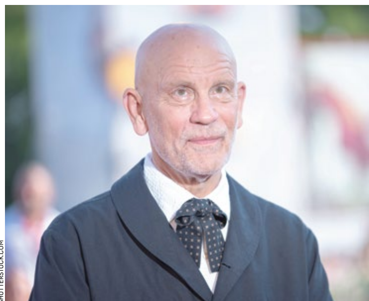
John Malkovich zagra w filmie „A Winter’s Journey” lirnika