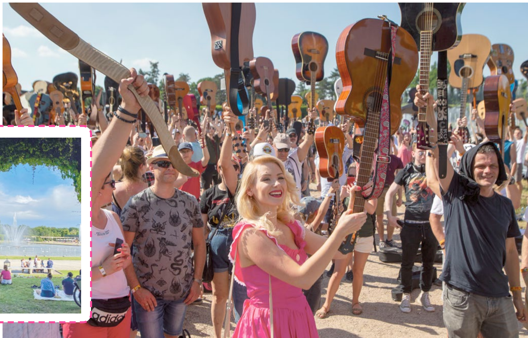
Z okazji 20. rocznicy bicia gitarowego rekordu Guinnessa 1 maja na wrocławskim Rynku odbędą się występy, warsztaty i spotkania, na dalszą zabawę na koncertach zaprasza Hala Stulecia

Świata 2022. Wyniki ok. godz. 16.15, a już o godz. 17 koncert gwiazd, czyli Dire Straits w Hali Stulecia. a wszystko za sprawą festiwalu 3-Majówka, który co roku rozpoczyna sezon imprez plenerowych w Polsce. W ciągu trzech dni na