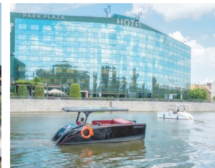
Miasto możemy zwiedzić z wody cichym katamaranem solarnym

Organizatorzy zadbałi również o atrakcje. Będą przejażdżki na kucykach, zawody „hobby horse”, pokaz woltyżerki sportowej czy wyścigi w goglach VR. Najmłodsi będą mogli także pobawić się na placu zabaw Konikowo i spróbować swoich sił w parku linoowym. Wydarzenie odbywa się pod znakiem solidarności z Ukrainą, przez cały dzień prowadzone będą zbiórki pieniędzy, a cały dochód z atrakcji zostanie przeznaczony na pomoc naszym sąsiadom. Start o godz. 14, wstęp wolny. Impreza potrwa do godz. 19.