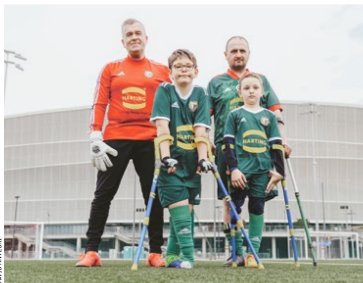
Od sezonu 2023 liga ma szansę na powiększenie o nową drużynę