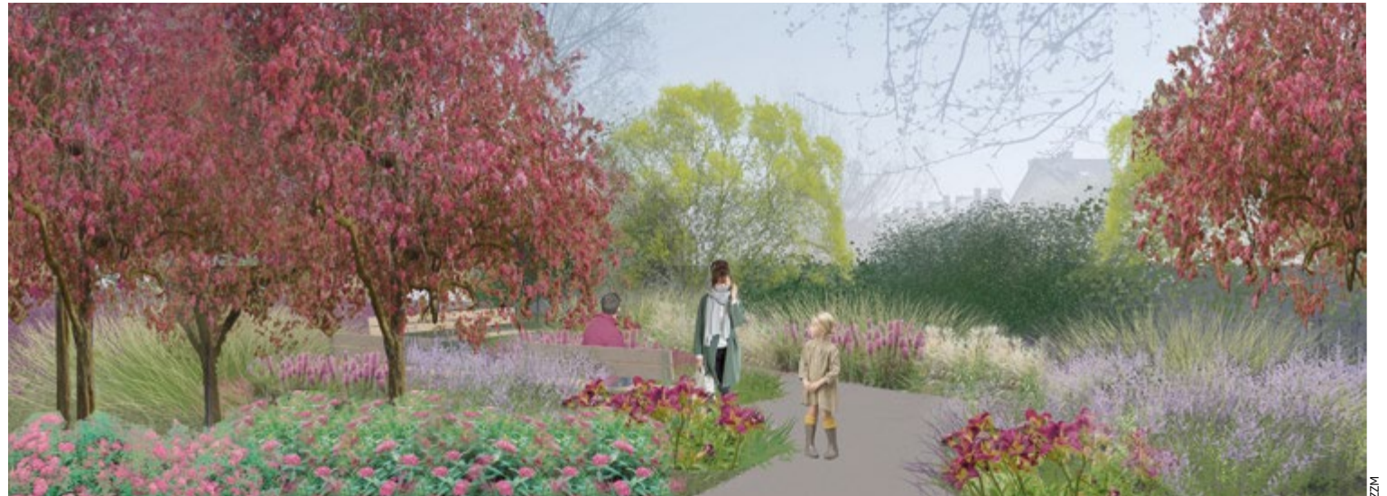
Wizualizacja skweru u zbiegu ulic Litewskiej i Kowieńskiej. Teren po ogródkach działkowych będzie zielonym miejscem spotkań

Kolejny park kieszonkowy miasto zamierza stworzyć u zbiegu ulic Litewskiej i Kowieńskiej na Psim Polu. Jeśli wszystko pójdzie zgodnie z planem, to mieszkańcy będą mogli korzystać z zielonej enklawy już latem tego roku.