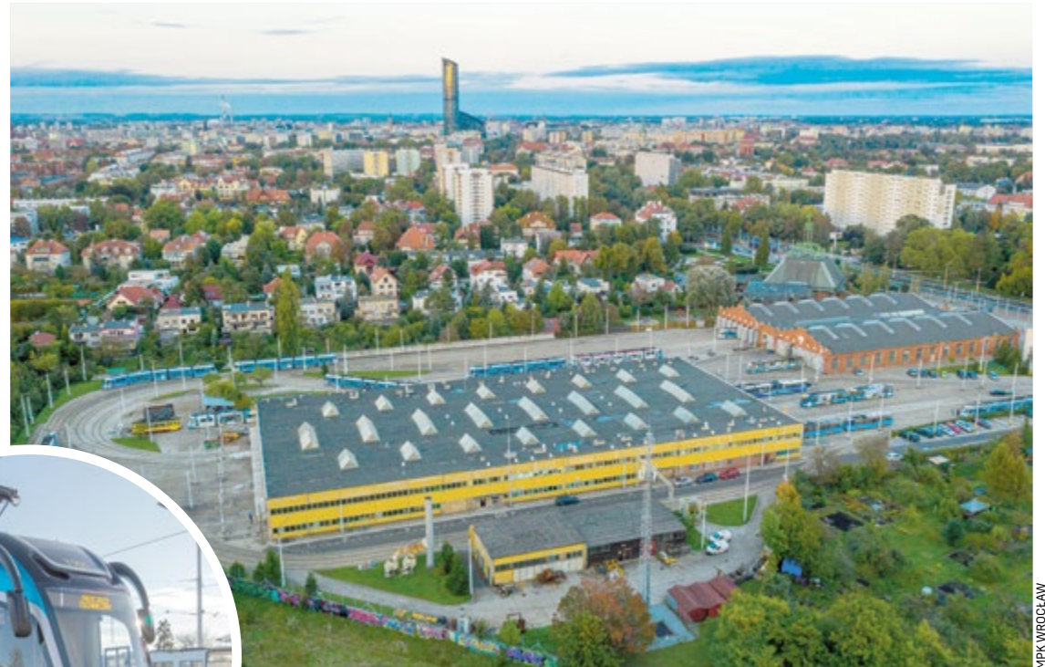
Zajezdnia po remoncie zmieści 130 tramwajów, w tym 46 nowych Moderusów

Długość nowych torów razem z rozjazdami to 1918 mpt (metrów pojedynczego toru). Zamontowane zostaną 24 rozjazdy