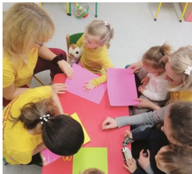
Klub „Słonecznik” prowadzi zajęcia dla dzieci od 5. m-ca do 3. r. ż.

Z myślą o najmłodszych uciekinierach wojennych we Wrocławiu zorganizowano 289 miejsc w publicznych żłobkach. W niepublicznych może powstać ok. 800.