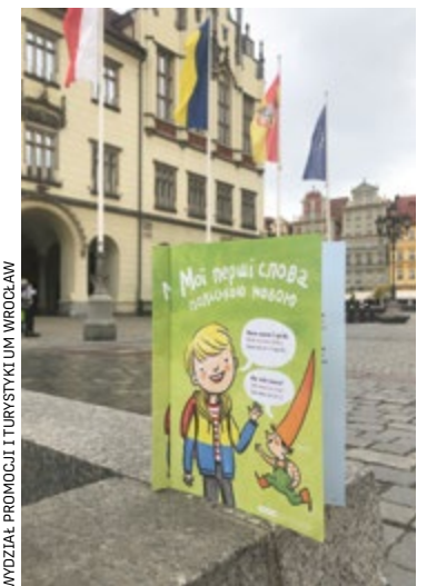
WIDZIAŁE PROMOCJĘ I TURYSTYKI UM WROCŁAW

Видання доступне у двох версіях: українській та російською