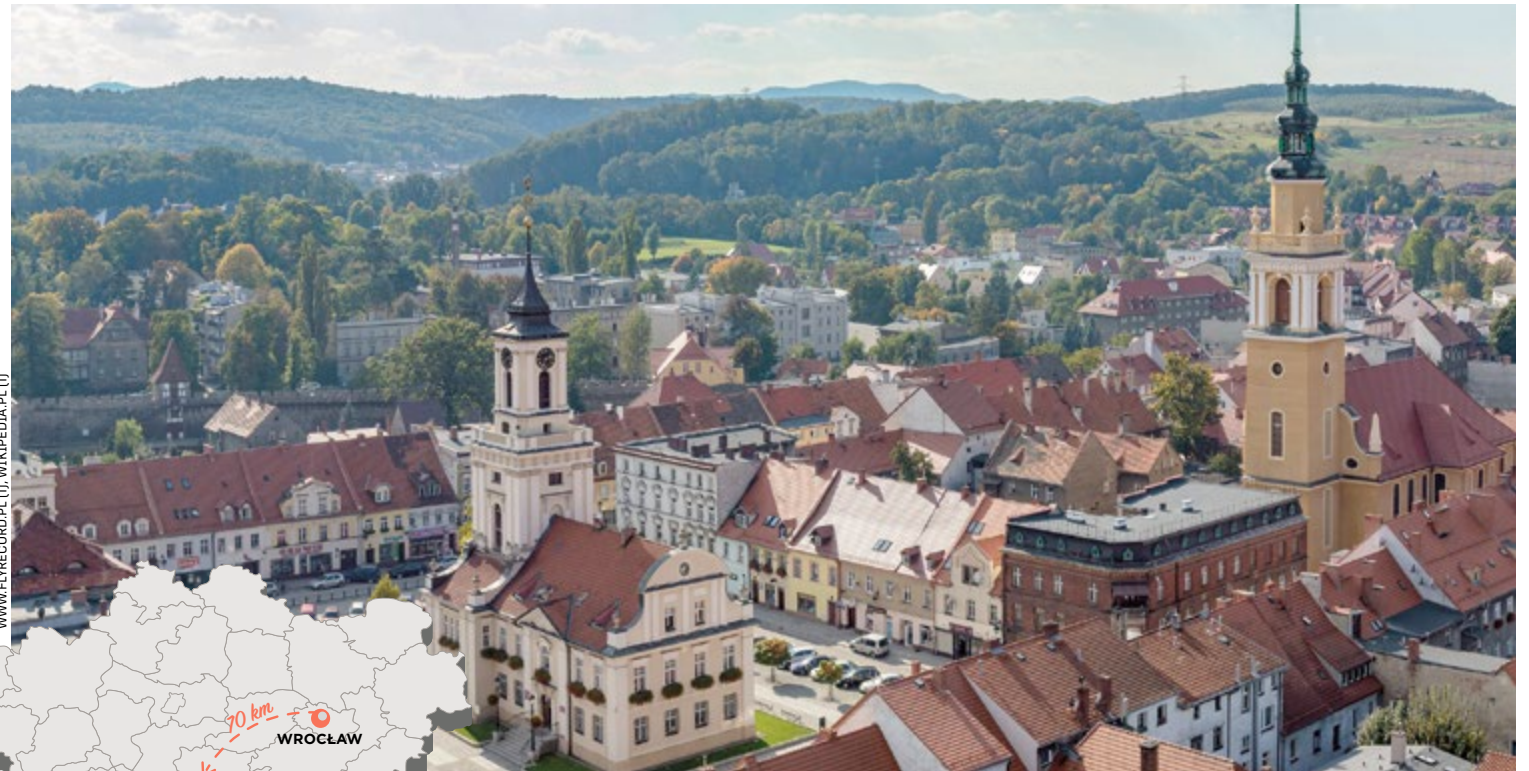
Ozdobą centrum jest ratusz w stylu klasycystycznym (z lewej) i kościół św. Piotra i Pawła

W Świebodzicach jest również kilka interesujących zabytków sakralnych. Najstarsze to pozostałości kościoła św. Anny w Pełcznicy z przełomu XII i XIII w. Według legendy obiekt spłonął od uderzenia pioruna, inne źródła podają, że kościół został zniszczony podczas najazdu Tatarów.