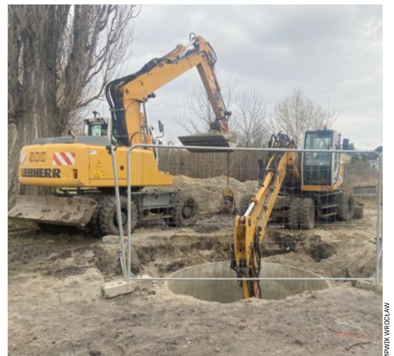
Prace przy budowie kanalizacji już ruszyły przy ul. Popielskiego