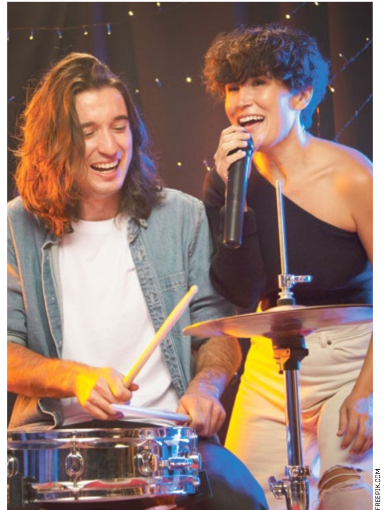
Do 6 maja do udziału w koncercie zgłosić się mogą zespoły i chóry