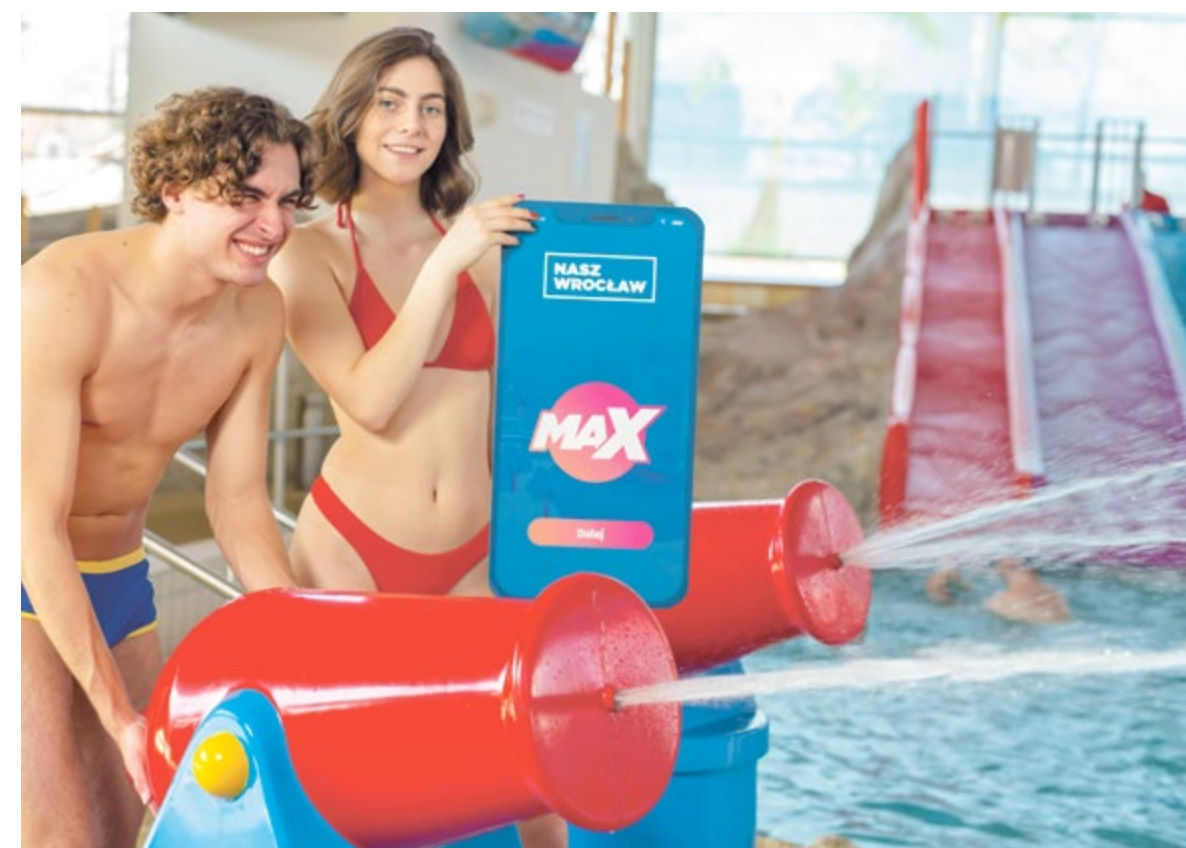
Z programem Nasz Wrocław MAX możesz m.in. kupić za połowę ceny roczny karnet VIP do aquaparku