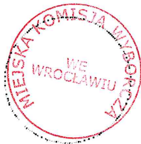
Pieczęć Miejskiej Komisji Wyborczej