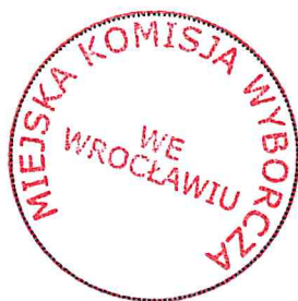
Pieczęć Miejskiej Komisji Wyborczej