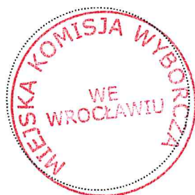
Pieczeń Miejskiej Komisji Wyborczej