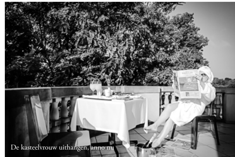
De kasteelvrouw uithangen, anno nu