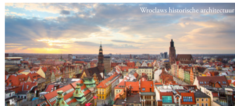
Wrocław's historische architectuur