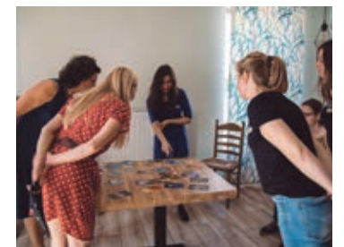
„Pole do działania” – warsztaty

24 października włącznie. Zorganizowane są m.in. w Starej Piekarni, siedzibie Rady Osiedla Psie Pole-Zawidawie, a także w Centrum Bibliotecznokulturalnym „Fama”.