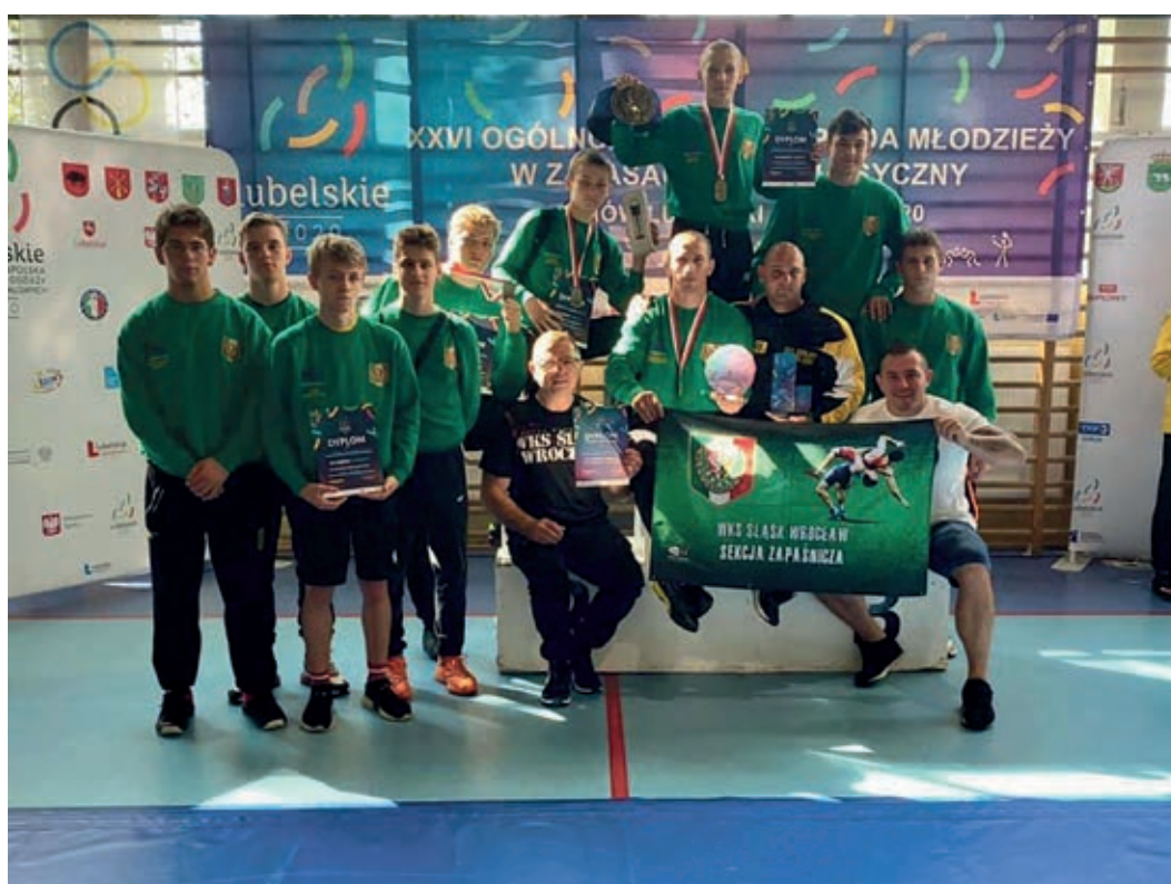
Wrocławska drużyna opuszczała Lubelskie z tarczą

Warto podkreślić, że dzięki dobrym wynikom wszystkich zapaśników WKS Śląsk okazał się najlepszy w klasyfikacji drużynowej.