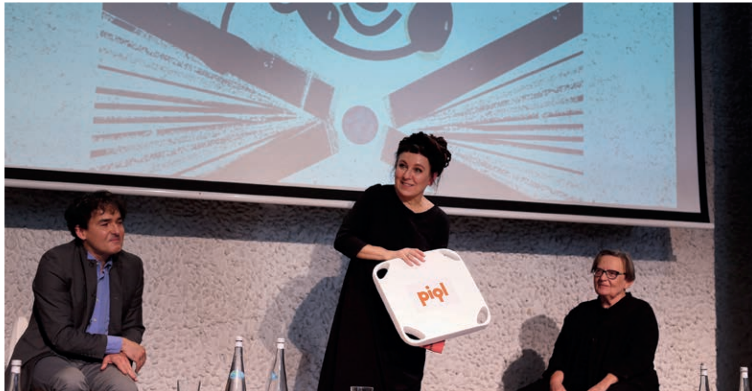
Olga Tokarczuk osobiście przybyła na inaugurację Tygodnia Noblowskiego do Wrocławia. Tu na konferencji m.in. z Agnieszką Holland (Rada Fundacji Olgi Tokarczuk) i Grzegorzem Zygadło, prezesem zarządu Fundacji

się 10 października, w rocznicę przyznania Nagrody Nobla Oldze Tokarczuk, a noblistka przeczyta swoje utwory o 18.30 w Arsenale. Na spotkanie obowiązują wejściówki dostępne od 6 października.