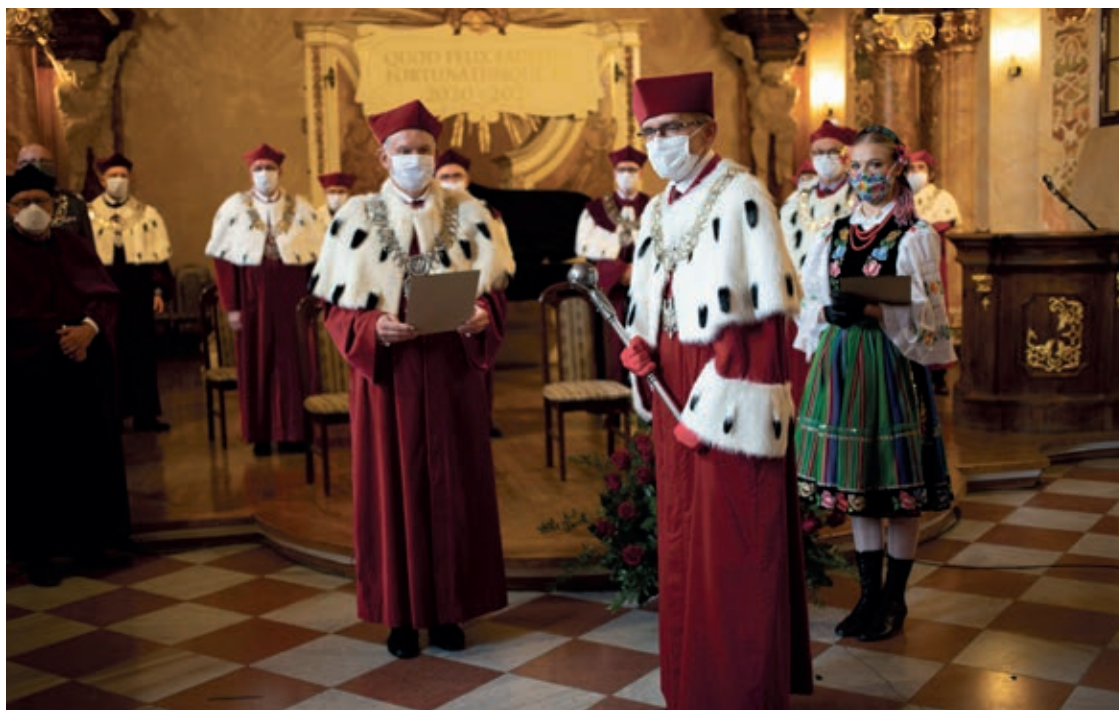
Uczelnie zaczynają działalność z zachowaniem reżimu sanitarnego

Z wykorzystaniem sieci zaliczyć będzie można także egzaminy. Uniwersytet Ekonomiczny już wiosną opracował precyzyjne zasady egzaminów w trybie online. Obejmują one m.in. konieczność wylegitymowania się, test połączenia, a w przypadku jego ze-