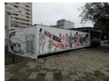
Efekt bezmyślności w kolorze czerwonym zniknie. Pozostaje wiara, że „...ludzi dobrej woli jest więcej”

Mural o powierzchni 40 m 2 zaprojektowała i w cztery dni wykonała Grażyna Małkiewicz, absolwentka wrocławskiej ASP.