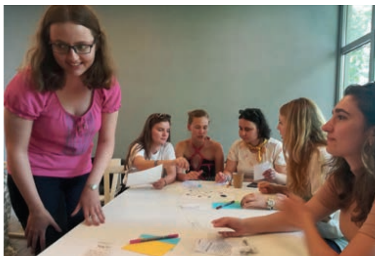
Na 100-lecie nadania kobietom praw wyborczych Polanki opracowują specjalną grę planszową

znajomość jest potrzebna współczesnym liderkom, a są to zarządzanie projektami, organizacja wydarzeń, social media – wylicza Polanka.