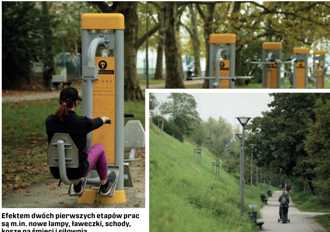
Efektom dwóch pierwszych etapów prac są m.in. nowe lampy, ławeczki, schody, kosze na śmieci i siłownia