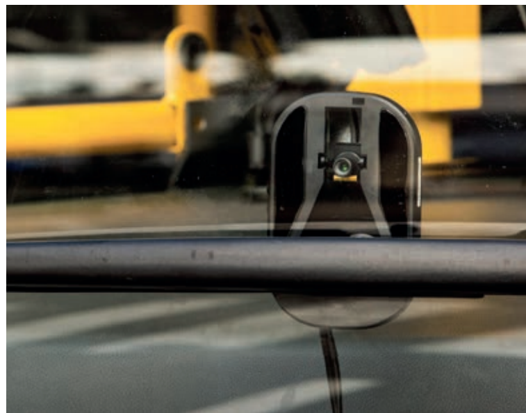
Takie inteligentne „oko” zbierze dane m.in. o mobilności pieszych i rowerzystów

Dzięki zamontowanym kamerom możliwa będzie identyfikacja infrastruktury drogowej, m.in.: sygnalizacji świetlnej, znaków drogowych czy choćby dziur w jezdni. System umożliwi mapowanie infrastruktury drogowej oraz dynamiczne mapowanie mobilności pieszych i rowerzystów. Rozwiązanie to pozwoli poprawić bezpieczeństwo w ruchu drogowym we Wrocławiu. Dodatkowo będzie ostrzegał kierowców autobusów przed nagłym wtargnięciem na jezdnię innych użytkowników dróg.