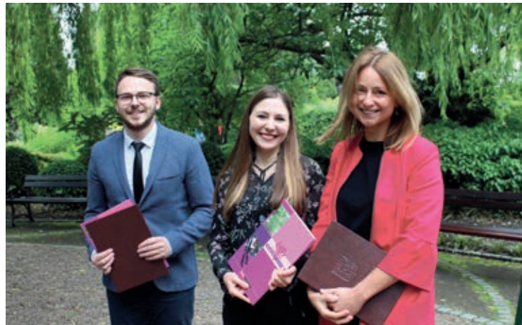
Laureaci miejskiego konkursu Wrocławska Magnolia

W lutym tego roku prezydent Wrocławia uruchomił także Fundusz Aktywności Studenckiej (FAST), który realizowany jest przez WCA. W jego ramach koła studenckie mogą zabiegać o dofinansowanie swoich projektów. W dwóch tego-