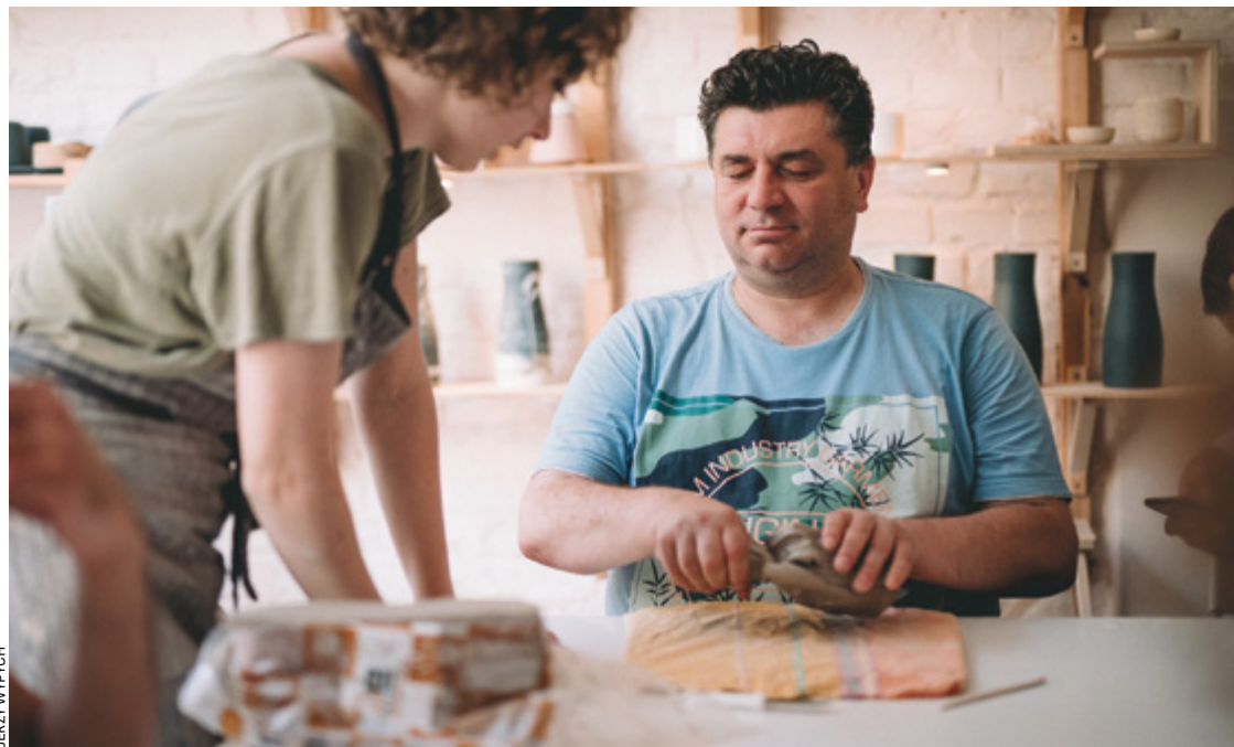
Doznanie zmysłów – warsztaty ceramiczne dla osób z dysfunkcją wzroku, lipiec 2021

1. Architektoniczna. Obejmuje cztery wymogi minimalne. Po pierwsze: brak barier w przemieszczaniu się po budynkach – dla osób na wózkach czy słabo widzących. Po drugie: rozwiązania umożliwiające dostęp do wszystkich pomieszczeń, z wyjątkiem pomieszczeń technicznych. Po trzecie: umożliwienie wstępu do budynku osobie z specjalnie przeszkolonym psem asystującym. Po czwarte: zapewnienie osobom o ograniczonej mobilności lub percepcji możliwości ewakuacji.