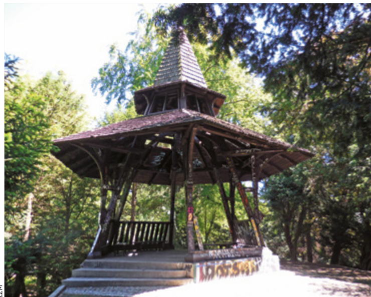
Tak wyglądała altana z tzw. wzgórza Bendera przed 2018 rokiem

Drewnianą konstrukcję wyczynkową, zbudowaną na przełomie XIX i XX w. dla podziwiania panoramy Wrocławia i Masywu Ślęży, w sierpniu 2018 r. podpalili nieznanymi sprawcami. Zarząd Zieleni Miejskiej ogłosił właśnie przetarg na wykonawcę odbudowy. Na oferty czeka do 8.09. Po podpisaniu umowy nowa altana, zwana przez wrocławian obecnie nie pawil-