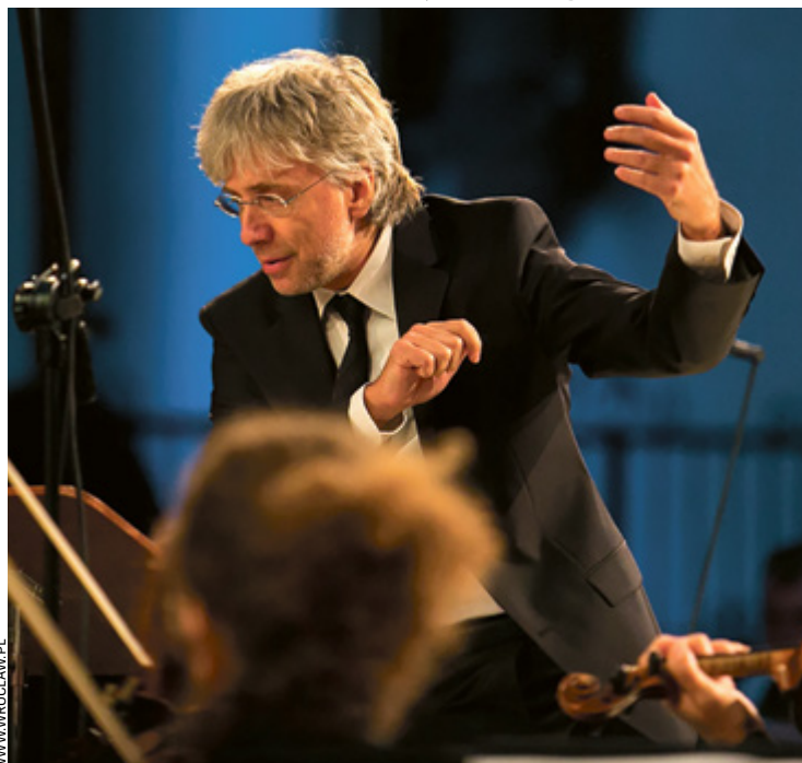
Giovanni Antonini – dyrektor artystyczny Wratistavii Cantans