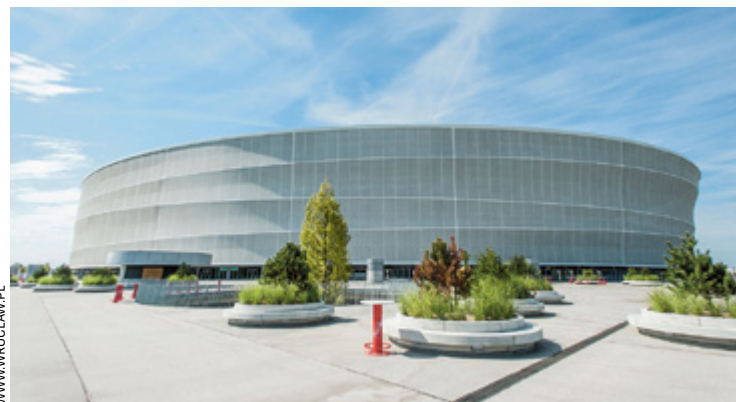
Spektakl laserowy z okazji 10-lecia stadionu już 3 i 4 września

LightOn Festival to wyjątkowe spektakle światła, którym towarzyszą muzyka i efekty specjalne, takie jak tańczące ognie, strzelające iskry, cicha pirotechnika sceniczna oraz efekty dymne. W tej edycji jednym z elementów wydarzenia będzie specjalny laserowy pokaz dokumentujący 10-lat istnienia Stadionu Wrocław i najważniejsze imprezy, które gościł. Za stronę techniczną przedsięwzięcia odpowiada pol-