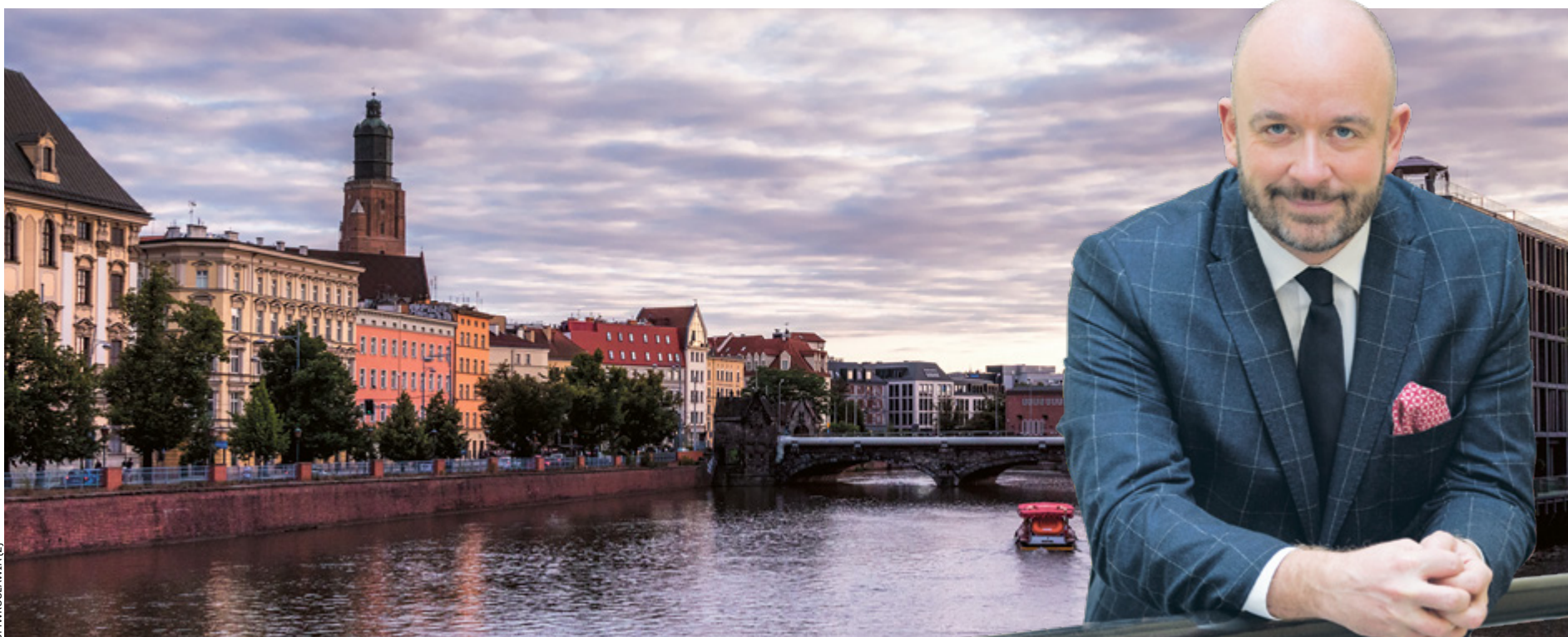
Prezydent Jacek Sutryk, socjolog po Uniwersytecie Wrocławskim, jest absolwentem Szkoły Podstawowej nr 9 im. Wincentego Pola przy ul. Nyskiej we Wrocławiu

Poprzedni rok szkolny był bardzo trudny dla uczniów, rodziców i nauczycieli. O planach Wrocławia na rok szkolny 2021/22 po długich miesiącach nauki zdalnej, a także izolacji rówieśniczej, z prezydentem Wrocławia Jackiem Sutrykiem, zasiadającym w radzie fundacji UMP, rozmawia Piotr Bera.