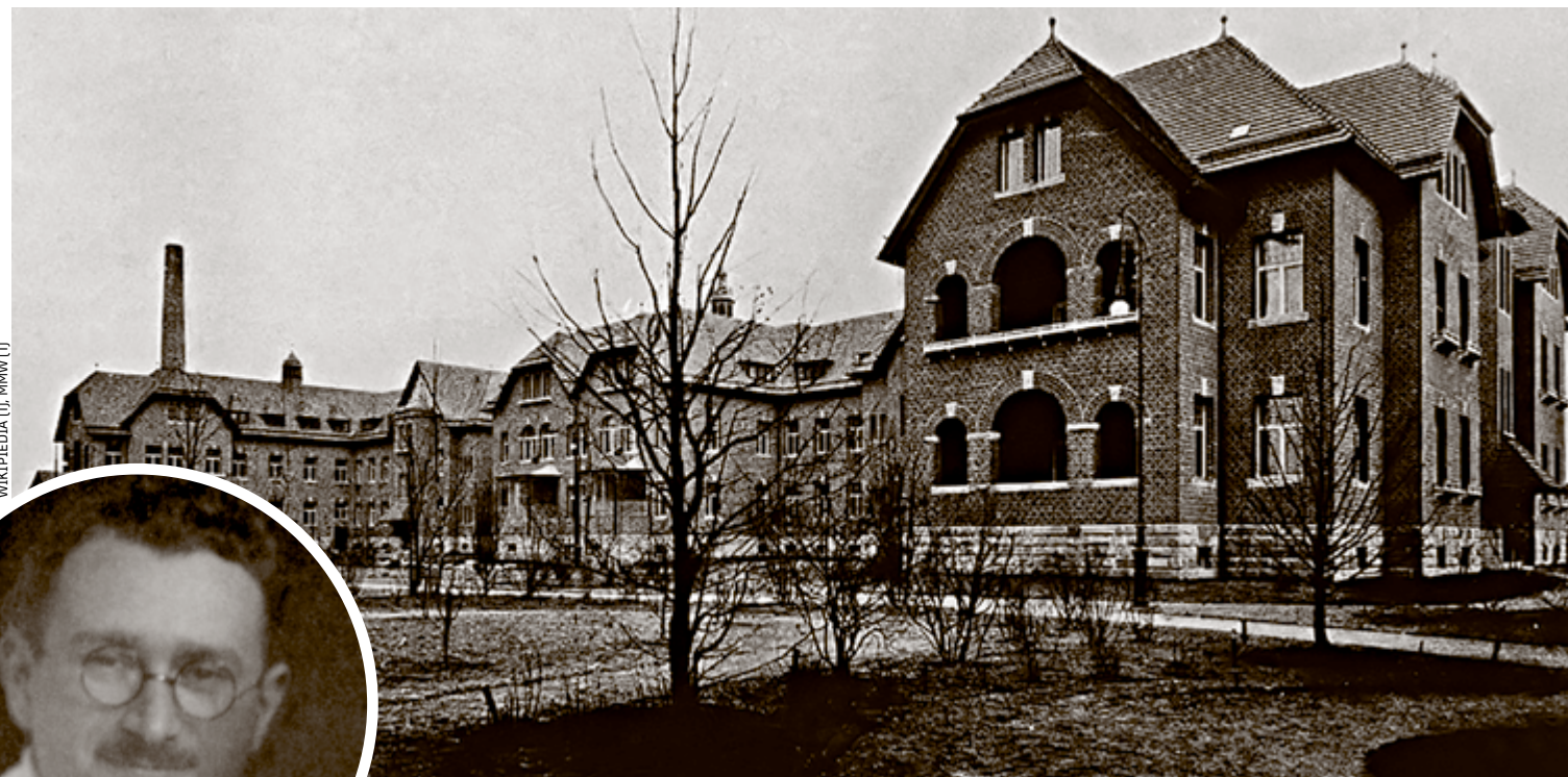
Doktor Ludwig Guttman pracował w latach 30. w szpitalu żydowskim przy dzisiejszej al. Wiśniowej

– Mimo że niemiecka medycyna należała w tym okresie do najlepszych na świecie, to tego typu urazy uznawano za przypadki beznadziejne. Chorzy z uszkodzonym rdzeniem umierali na ogół w ciągu dwóch lat od wypadku z powodu nieleczonych