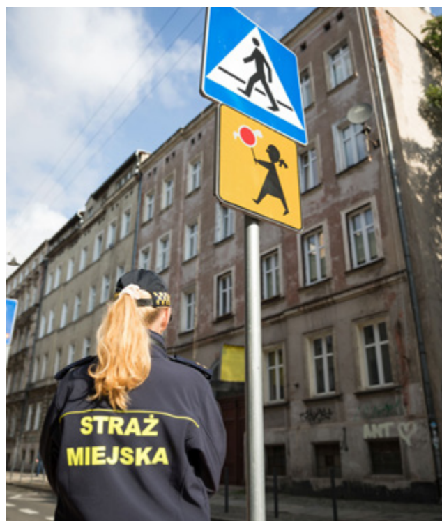
Patrol SM w okolicy SP nr 2 przy ul. Komuny Paryskiej