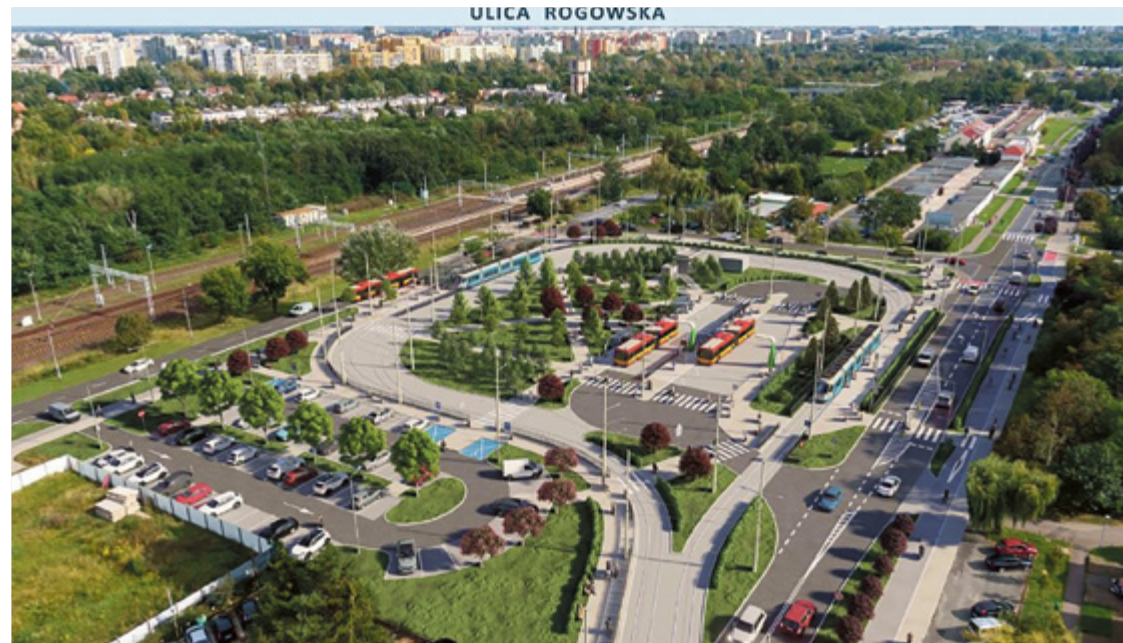
Tak będzie wyglądała ul. Rogowska po ukończeniu Trasy Autobusowo-Tramwajowej na Nowy Dwór

Firma Skanska została wybrana w przetargu na budowę ostatniego odcinka trasy autobusowo-tramwajowej na Nowy Dwór. Zadanie ma zrealizować za ponad 72 miliony złotych.