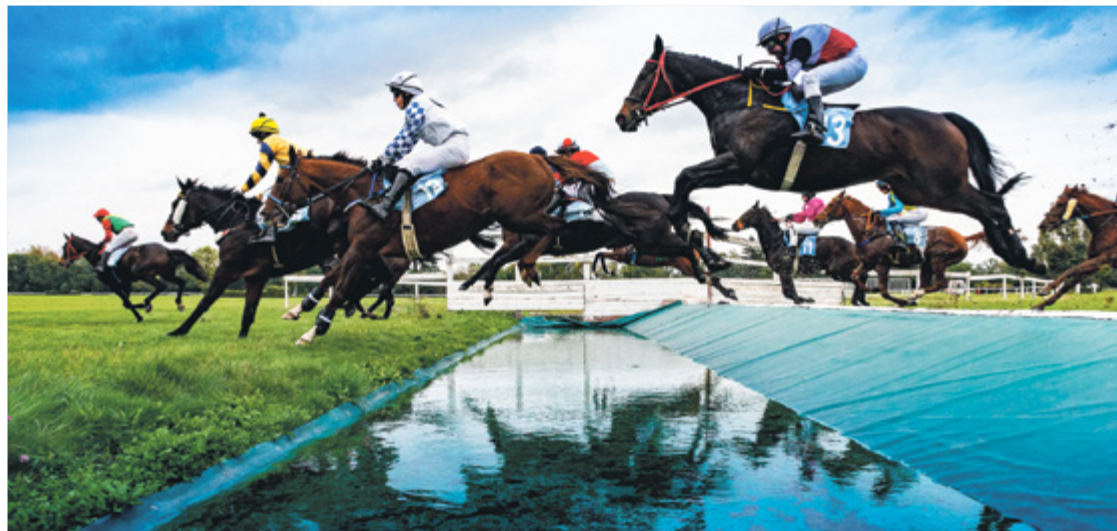
Wielka Wrocławska – najważniejsza gonitwa sezonu na Wrocławskim Torze Wyścigów Konnych

Przed nami najważniejsze wydarzenie sezonu 2021 na Wrocławskim Torze Wyścigów Konnych – Partynice. W niedzielę, 5 września odbędzie się Wielka Wrocławska – Nagroda Prezydenta Wrocławia. W programie znalazło się 7 gonitw.