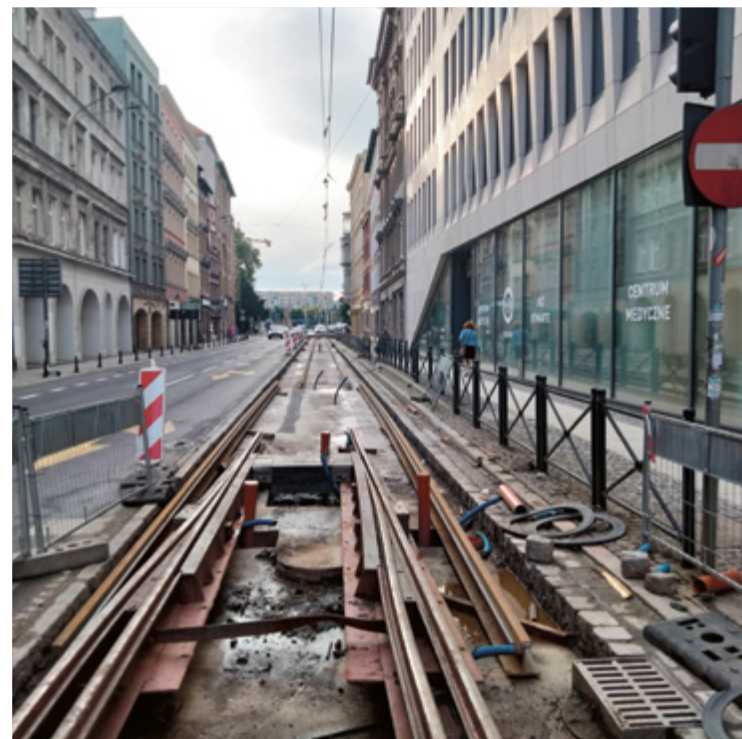
Pierwszy etap prac rozpoczął się od ul. Ruskiej pod koniec sierpnia

Trwa remont jednego z najważniejszych węzłów komunikacyjnych. W ramach TORYwulacji MPK wymieni tam rozjazdy, łuki i skrzyżowania torów. Prace zostały podzielone na pięć etapów. Prace za 5,9 mln zł wykona Zakład Sieci i Zasilania sp. z o.o.