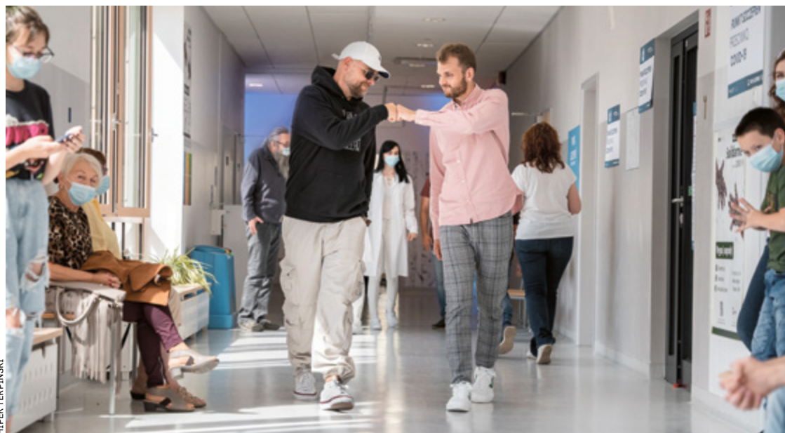
Spoty z raperem TEDE promują we Wrocławiu akcję szczepień – szczególnie wśród młodzieży

Żeby dotrzeć do młodych odbiorców, miasto przygotowało serię spotów. Ich bohaterem