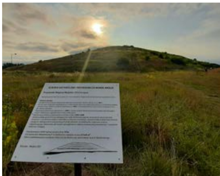
Warto podążać ścieżką historyczno-przyrodniczą wokół Maślic

wują, wymieniają stolarkę okienną, pokrycie dachu. Teraz na pal-