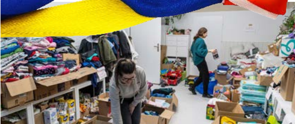
Uczniowie Głównej Wojskowej Szkoły Średniej ze spakowanymi przez siebie paczkami (zdj. na górze); wolontariusze punktu dla mam z dziećmi we Wrocławskim Parku Technologicznym (na dole)