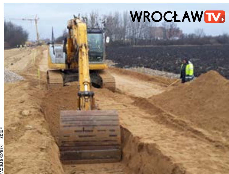
Prace budowlane powinny zakończyć się w czerwcu 2022 roku

Na Muchoborze Wielkim budują łącznik ul. Rakietowej z ul. Żwirki i Wigury. Wnioskowali o to radni Muchoboru Wielkiego i samorządowcy z Kątów Wrocławskich.