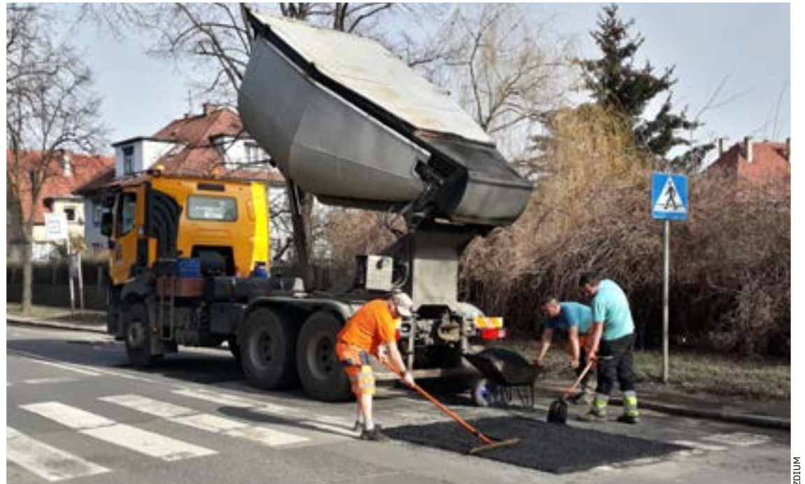
Naprawa jezdni na ul. Czekoladowej, alternatywnej dla Karkonoskiej w dojeździe na Bielany Wr.

Jak powstają dziury? Częstotki wody wnikają w głąb warstw