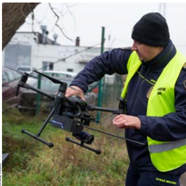
Tylko w tym roku przeprowadzono ponad 2 tys. kontroli dronem

Od 23.10 do końca roku 2021 za pomocą dronów skontrolowano 2843 kominy, pobrano 592 próbki i wykryto 33 nieprawidłowości. W sumie od początku sezonu grzewczego do 4 lutego 2022 r. kontrole z powietrza objęły 5046 kominów, z których pobrano 16 438 próbek, wykrywając 115 nieprawidłowości. Z powietrza w ostatnich miesiącach skontrolowano także 54 ogródki działkowe (to blisko 500 ha).