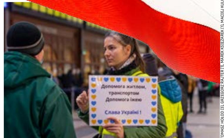
Wolontariusze udzielają informacji w Przejściu Dialogu (zdj. na górze) i pomagają uchodźcom na Dworcu Głównym PKP (na dole)