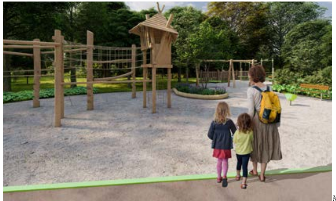
Odnowiony plac zabaw w parku Bieńkowickim powinien ucieszyć młodsze i starsze dzieci

Plac zabaw po dwóch stronach głównej alejki parkowej ma być wyposażony zarówno z myślą o dzieciach młodszych, jak