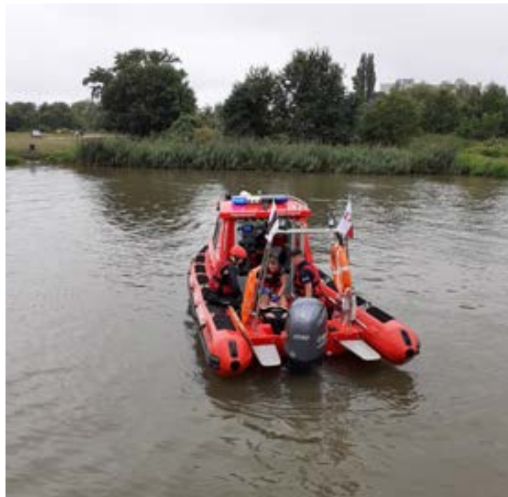
W 2021 r. na Odrze odbyły się pokazy pt. Bezpieczne wakacje

Do dyspozycji kursantów jest interaktywny sprzęt, a działania są objęte patronatem Uniwersytetu Medycznego im. Piastów Śląskich we Wrocławiu. Wiedza, którą przekazują instruktorzy na szkoleniach, jest poparta najnowszymi badaniami z dziedziny ratownictwa, a szkoleniowcami są doświadczeni ratownicy medyczni.