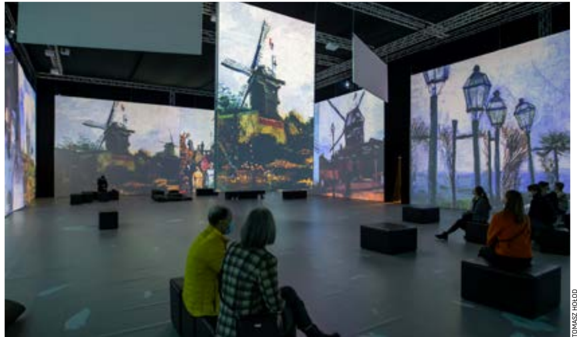
Obrazy będą wyświetlane nie tylko na ekranach, ale i na podłodze sal wystawienniczych w IASE