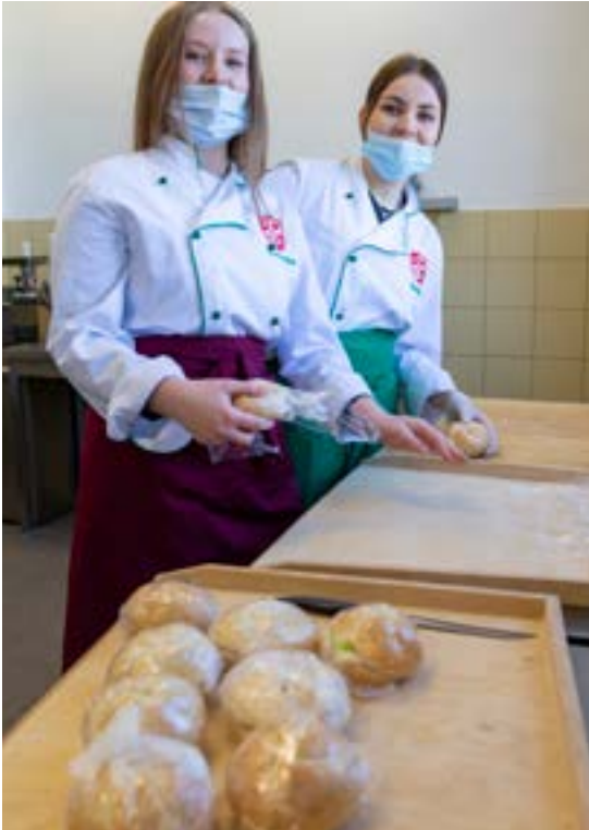
Uczniowie Zespołu Szkół Gastronomicznych od 9 marca szykują kanapki dla uchodźców

Od 24 lutego trwa wojna w Ukrainie, a do Polski przybywają licznie uchodźcy wojenni z tego kraju. Polacy stanęli na wysokości zadania i zorganizowali natychmiastową pomoc - tysiące wolontariuszy opiekuje się Ukraińcami na dworcach, dostarcza im jedzenie i ubrania, organizuje miejsca odpoczynku, segreguje dary, szykuje paczki pomocowe, udziela porad, tłumaczy rozmowy. Ci niesamowici ludzie robią to wszystko z dobrego serca.