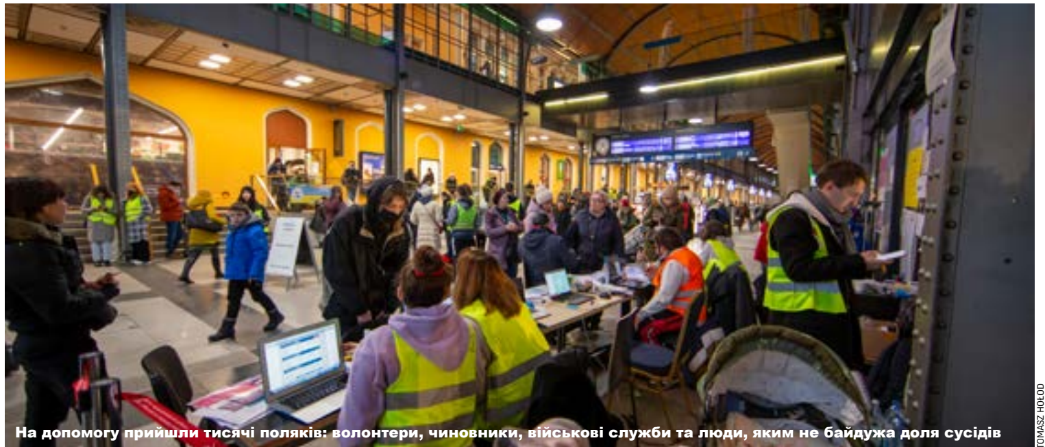
На допомогу прийшли тисячі поляків: волонтери, чиновники, військові служби та люди, яким не байдужа доля сусідів

Вроцлав вже переповнений. Протягом останніх трьох тижнів до міста потягом в'їхало близько 140 тис. людей. Вроцлав закликає шукати і будувати своє майбутнє також у менших місцевостях, в котрих готові допомагати біженцям. Частина українців залишить-