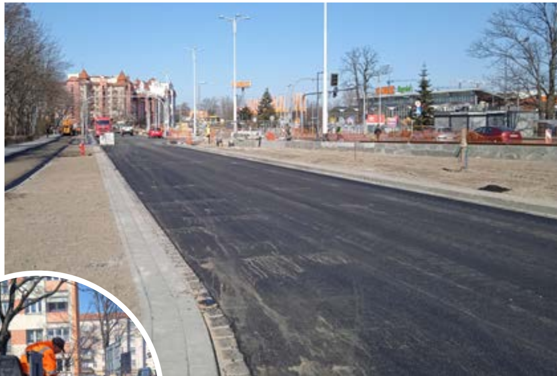
Nowa nawierzchnia na południowym pasie ul. Długiej jest już dostępna dla kierowców, trwają też prace nad budową trasy rowerowej