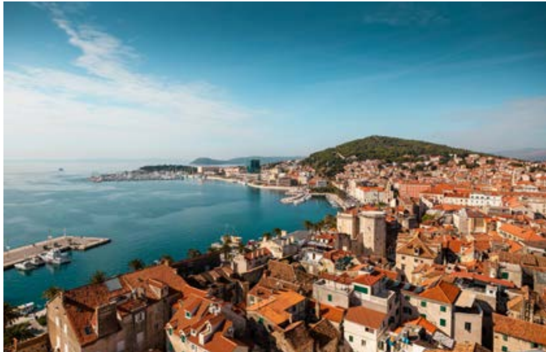
W tym roku z wrocławskiego lotniska będzie można polecieć do lubianego przez Polaków Splitu

Duży wybór mają podróżni czekający na kierunki południowe. W nowym rozkładzie zwraca uwagę aż 9 połączeń do Włoch, 5 do Hiszpanii (w tym Alicante, Barcelona Girona czy Lanzarote w archipelagu Wysp Kanaryjskich) oraz trzy do Grecji (w tym Ateny, Kreta Chania i Korfu). Wśród innych typowo wakacyjnych kierunków znajdują się m.in. Malta, dwa miasta w Chorwacji – Zadar i Split, a także Podgorica (Czarnogóra),