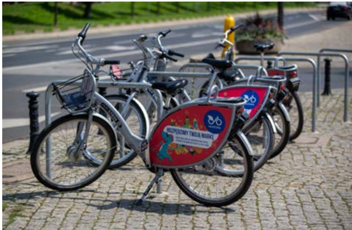
Wiosną na ulice Wrocławia wyjedzie 2265 jednośladów, w tym 65 tzw. rowerów nietypowych

Wszystkie rowery niestandardowe należy wcześniej zarezerwować. Następnie wybrany pojazd zostanie dostarczony do wskazanej przez użytkownika stacji, z której będzie można go