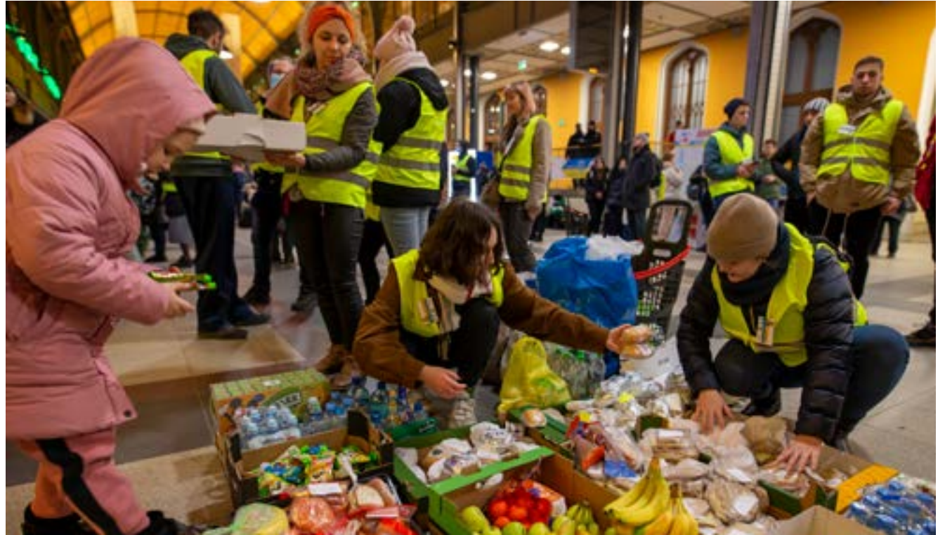
Na Dworcu Głównym PKP od początku wojny w Ukrainie wolontariusze pomagają przyjeżdżającym pociągami - rozdzielają jedzenie i napoje, a także informują, gdzie w mieście prowadzone są inne punkty wsparcia