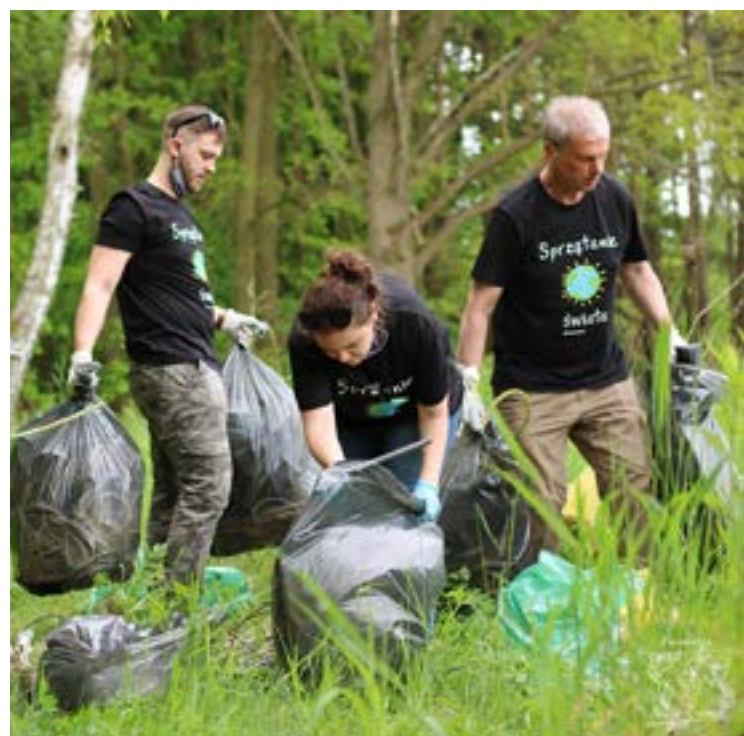
Akcja sprzątanania w ubiegłym roku zgromadziła wielu chętnych

Wrocławski Ekosystem zachęca do wiosennego sprzątanania miasta i zgłaszania organizowanych akcji. Bezpłatnie rozda worki, rękawiczki oraz odbierze zebrane śmieci.