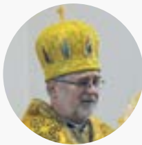
+ Володимир Ющак Єпископ Вроцлавсько-Кошалінської УГКЦ

Від свого імені та імені духовенств і мирян Вроцлавсько-Кошалінської єпархії УГКЦ, сердечно вітаємо у Вроцлаві всіх, хто був змушений залишити рідний дім та рідні стіни, тікаючи з України через війну, викликаної нападом російських військ.