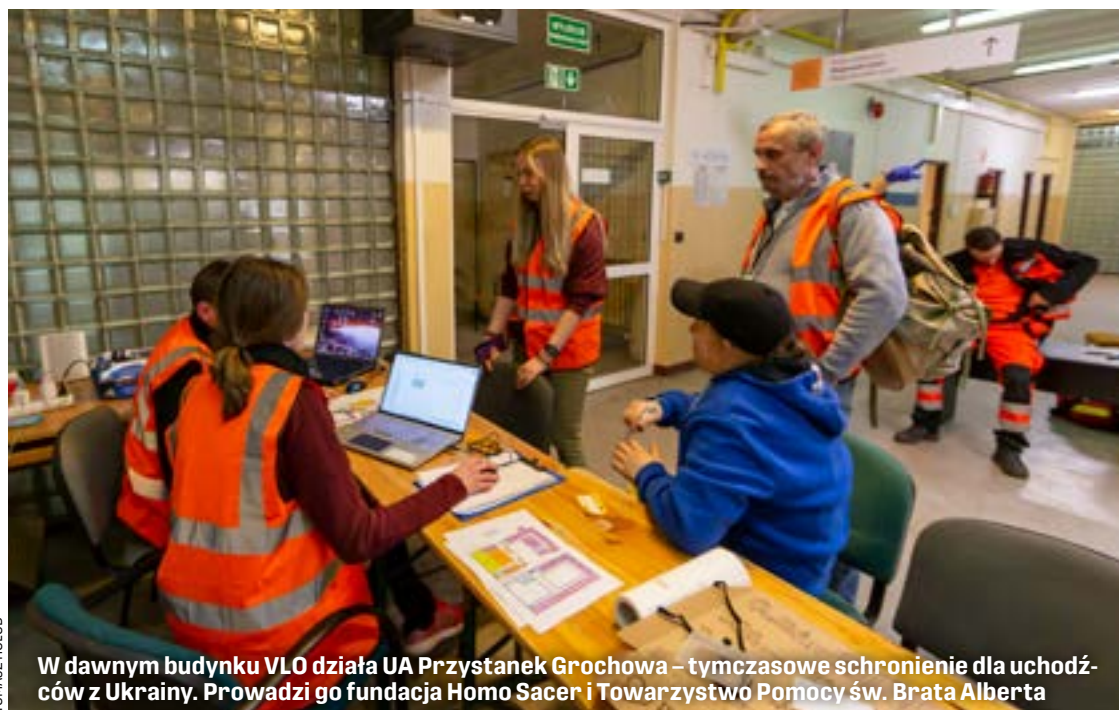
W dawnym budynku VLO działa UA Przystanek Grochowa – tymczasowe schronienie dla uchodźców z Ukrainy. Prowadzi go fundacja Homo Sacer i Towarzystwo Pomocy św. Brata Alberta