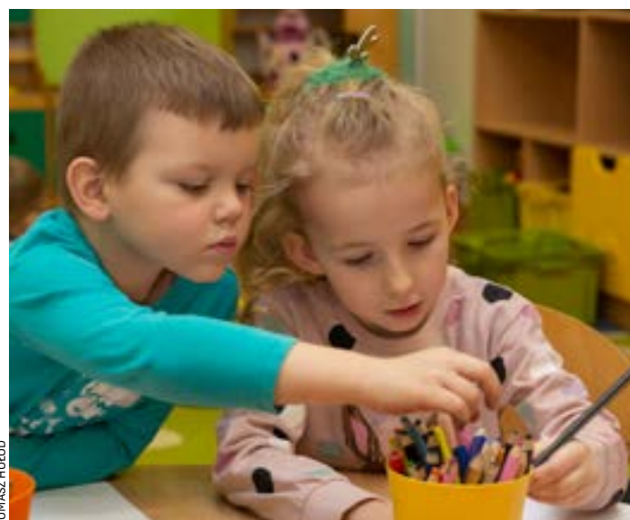
W Przedszkolu nr 121 przy ul. Tramwajowej dzieci z grupy Kaczuszek już czekają na młodsze koleżanki i kolegów

Nauka zacznie się we wrześniu. Ale zapisać się należy za kilka dni. Rodzice i dziadkowie kandydatów do wrocławskich przedszkoli przygotujcie PESEL-e swoich absolwentów żłobków, bo 23 marca startuje rekrutacja.