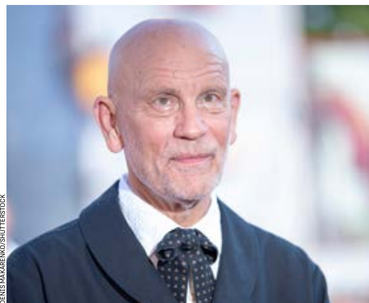
John Malkovich (68 l.) nie tylko gra, ale i reżyseruje filmy

Słynny aktor przyjedzie ze spektaklem inspirowanym życiem seryjnego mordercy z Wiednia. To nie pierwsza wizyta Malkovicha w naszym mieście.