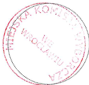
Pieczęć Miejskiej Komisji Wyborczej