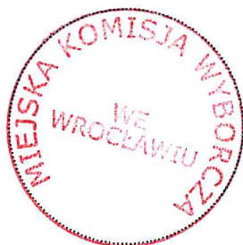
Pieczęć Miejskiej Komisji Wyborczej