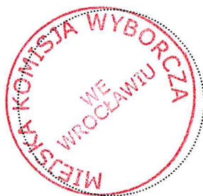
Pieczęć Miejskiej Komisji Wyborczej