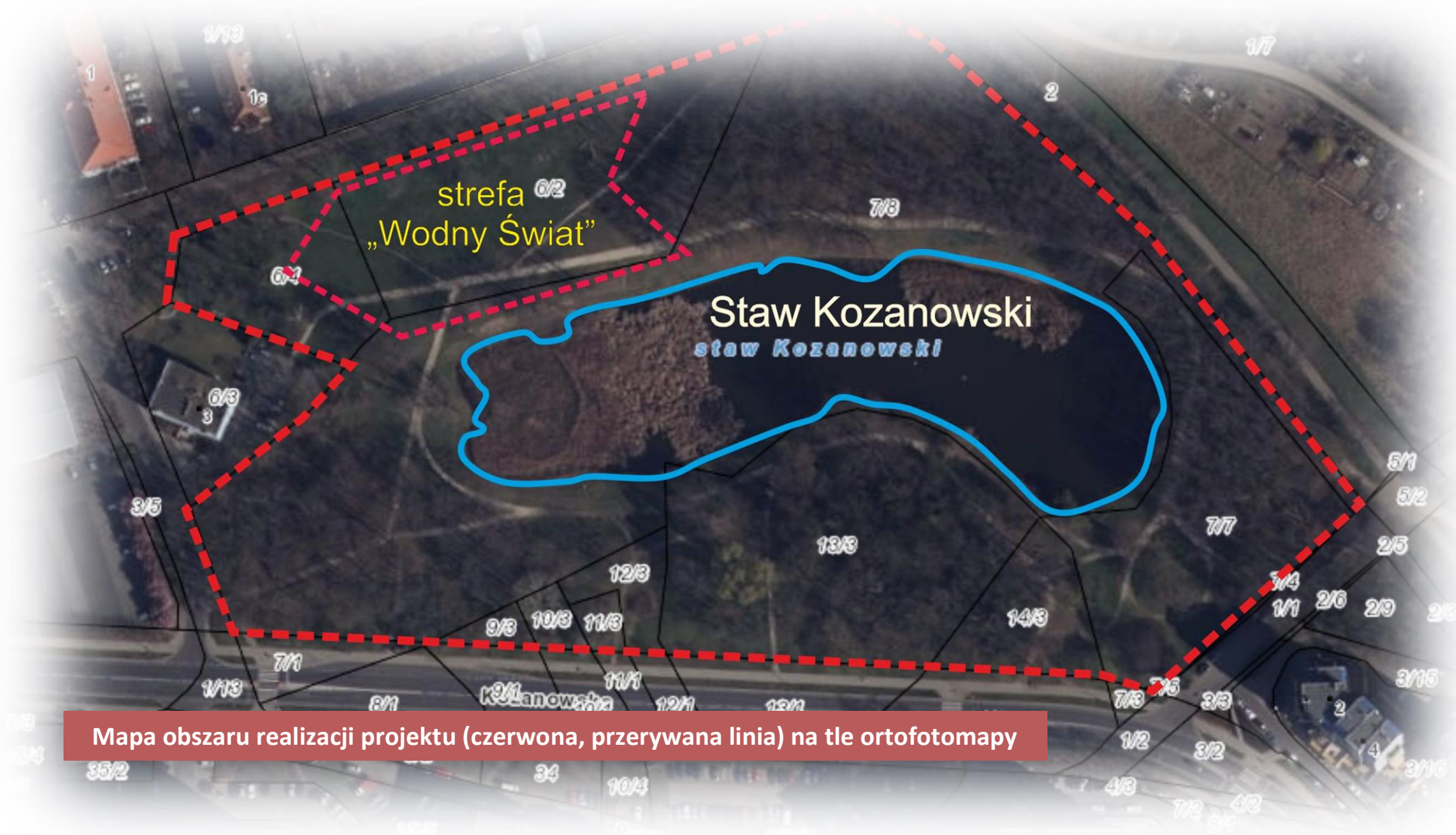
Mapa obszaru realizacji projektu (czerwona, przerywana linia) na tle ortofotomapy