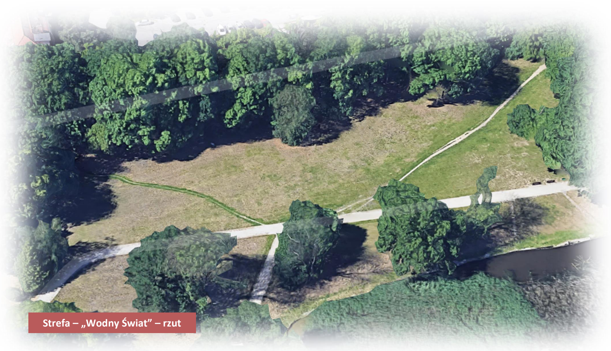
Strefa – „Wodny Świat” – rzut