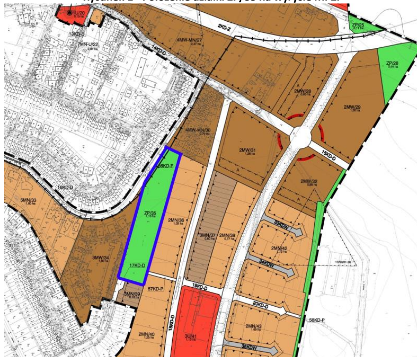
Rysunek 1 - Położenie działki ZP/35 na wyrysie MPZP

Terem ZP/35 obejmuje ponad 1ha ziemi. Niemożliwe jest, aby zagospodarować cały obszar w ramach projektu WBO 2016. W związku z powyższym planuje się, aby w 1 roku uporządkować cały teren powierzchni działki 80/1 i wybudować plac zabaw – ok. 200m 2 . Miejsce zabaw dla dzieci planuje się umiejscowić od strony drogi dojazdowej od ulicy Wierzyńskiego, od strony planowanej drogi na działce 1/3 (teren 57KD-P).