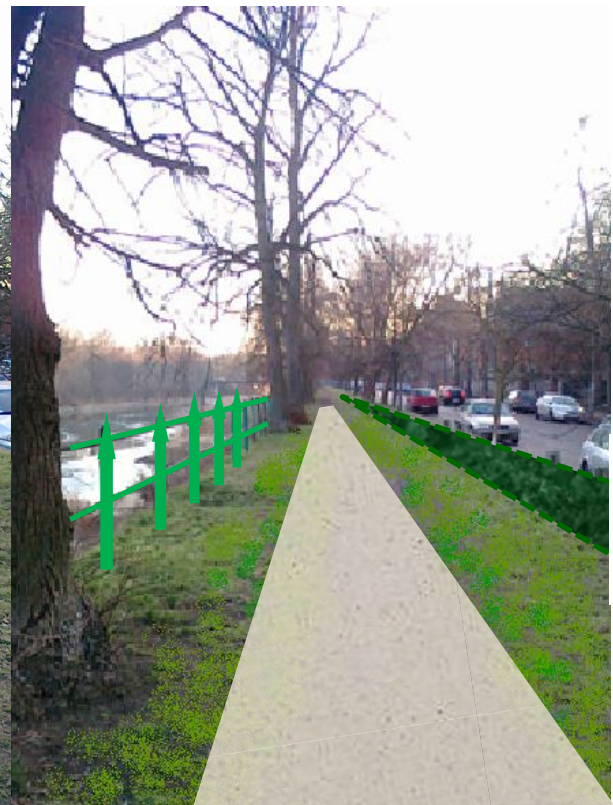
Po – nowa nawierzchnia i żywopłót przy jezdni