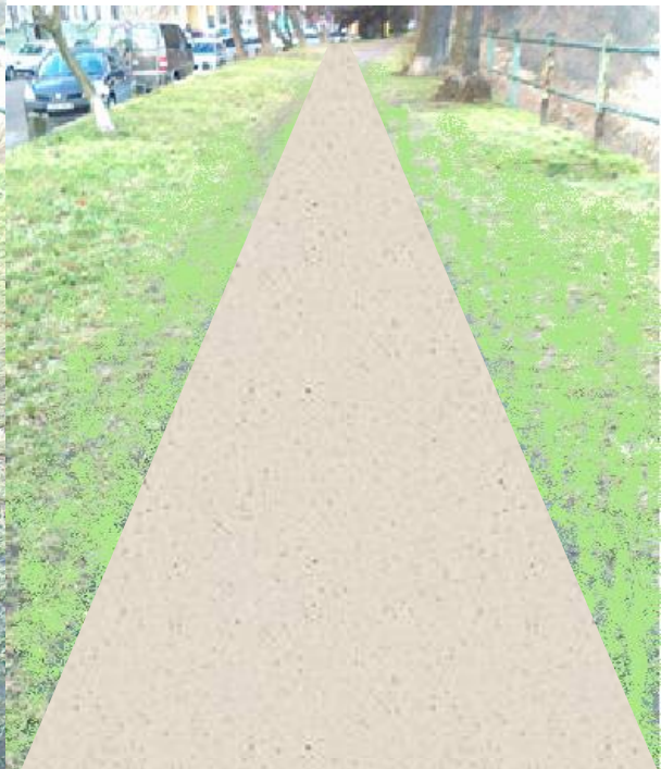
Po – nowa nawierzchnia