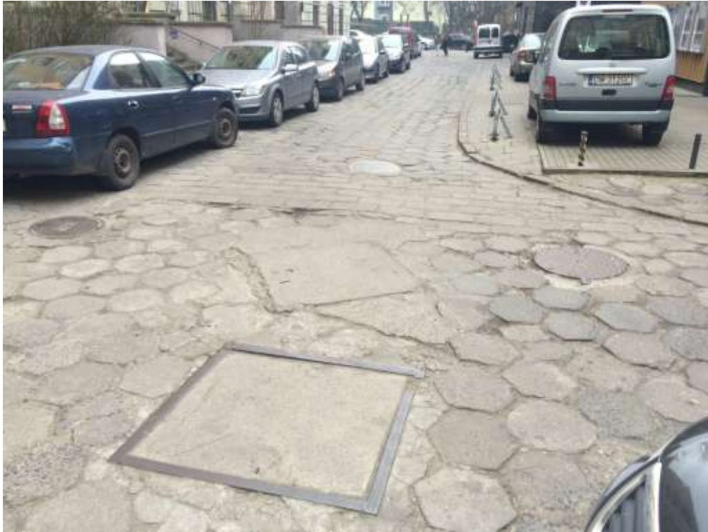
Rysunek 3 Fatalny stan nawierzchni podwórka przy pl. T Kościuszki 14