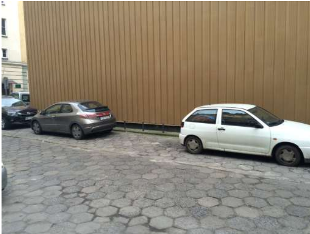
Rysunek 4 Brak wyznaczonych miejsc parkingowych powodujący nieoptymalne wykorzystanie przestrzeni parkingowej