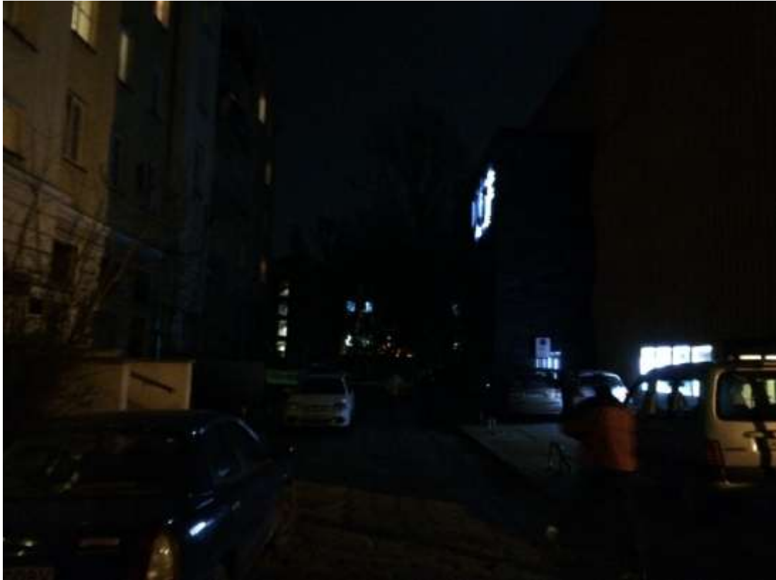
Rysunek 7 Fatalne oświetlenie podwórka