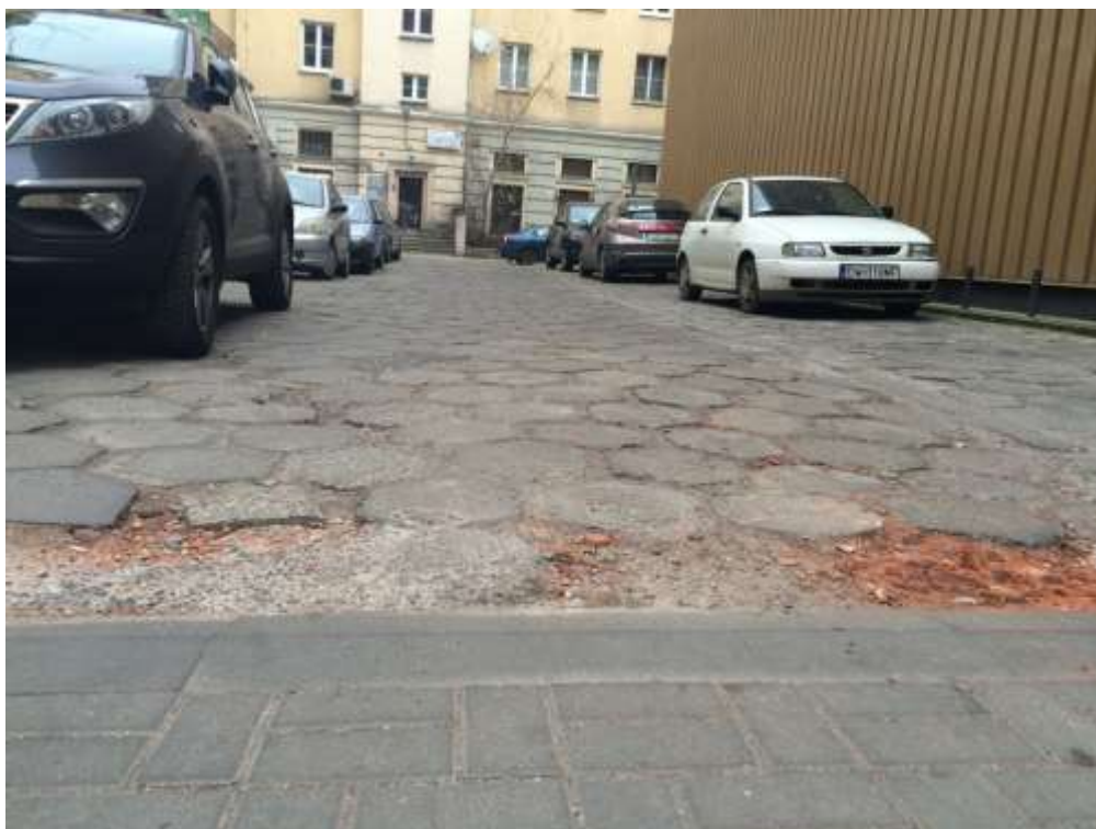
Rysunek 2 Prowizoryczna naprawa nawierzchni