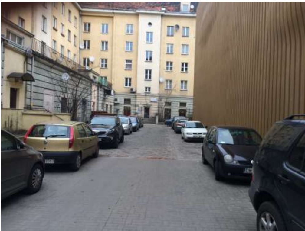
Rysunek 1 Widok na niewyremontowaną część podwórka