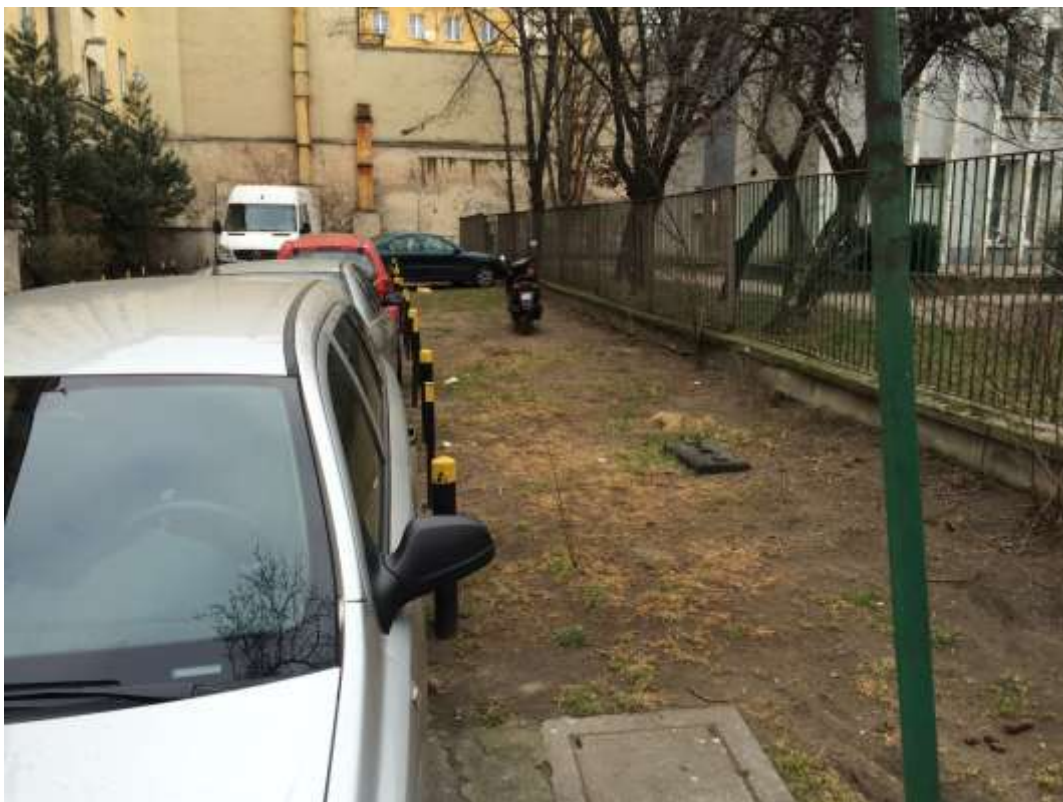
Rysunek 8 Niewykorzystany teren "zielony" - optymalizacja pod kątem miejsc parkingowych