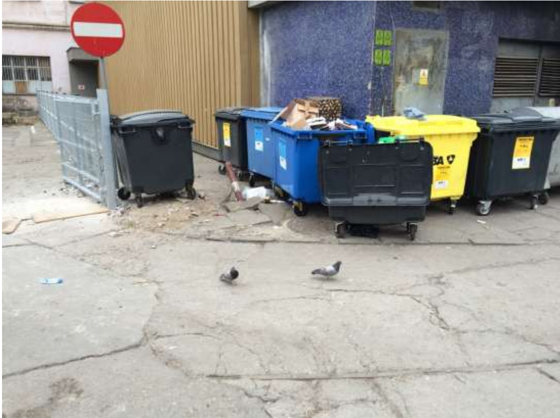
Rysunek 9 Wolnostojące kubły na śmieci