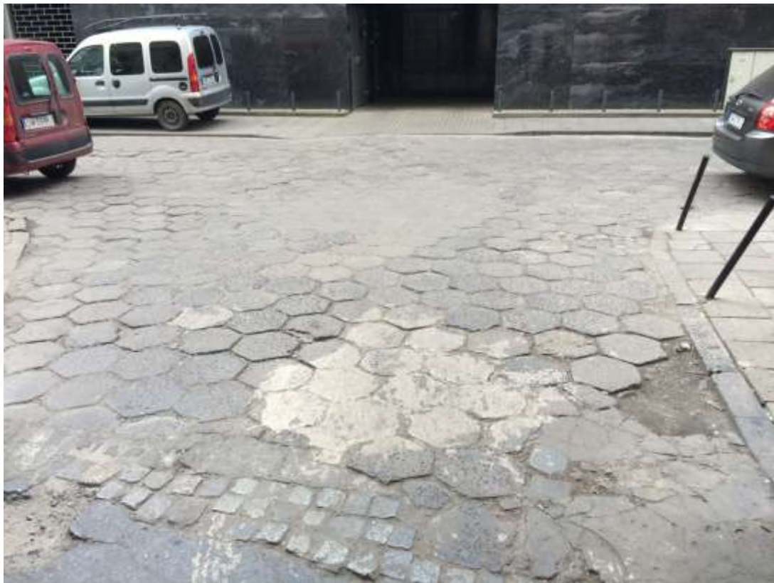
Rysunek 10 Stan nawierzchni - wjazd od strony pl.Kościuszki