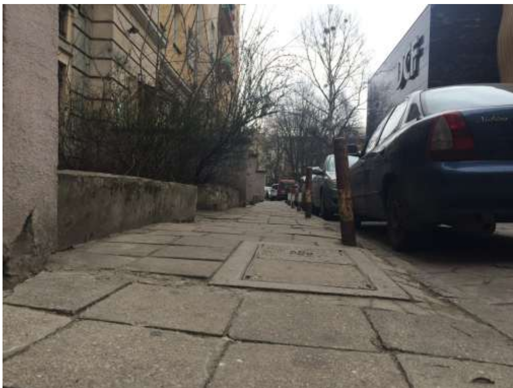
Rysunek 11 Nawierzchnia chodnika w podwórku