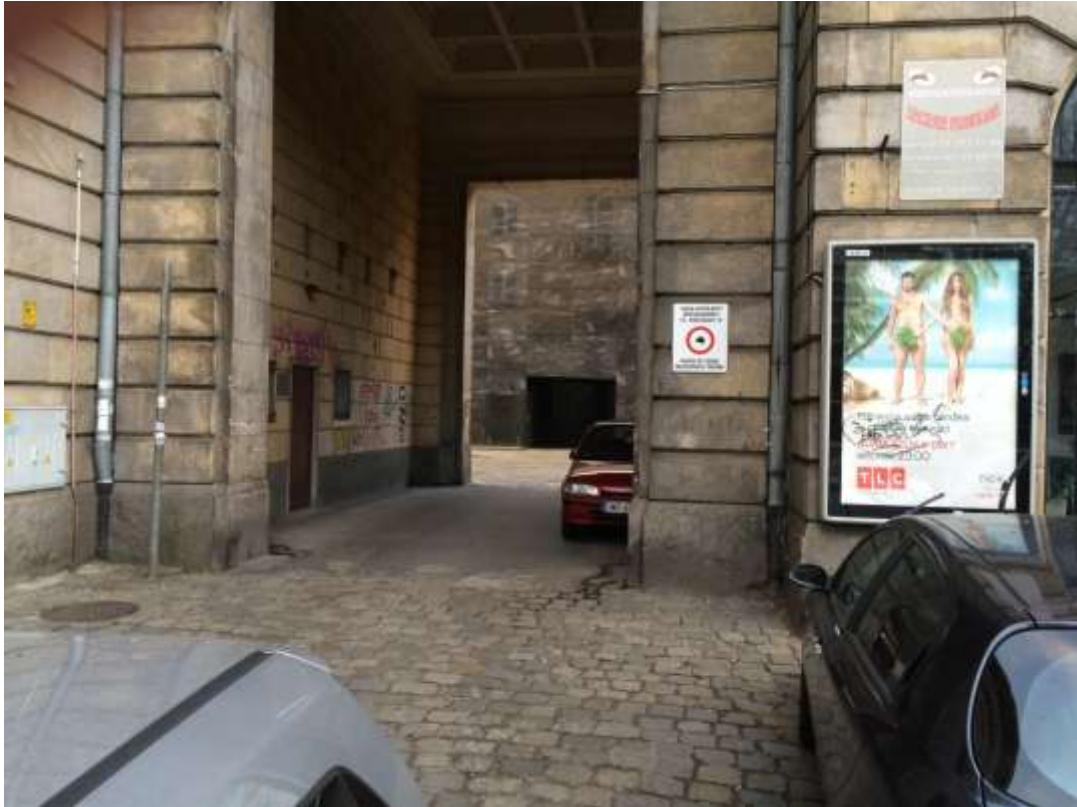
Rysunek 5 Wjazd od Pl. Kościuszki - pojazd zaparkowany w bramie