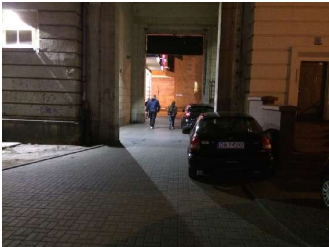
Rysunek 6 Wjazd na podwórko od ul. Piłsudskiego - zaparkowane pojazdy uniemożliwiają swobodny wjazd