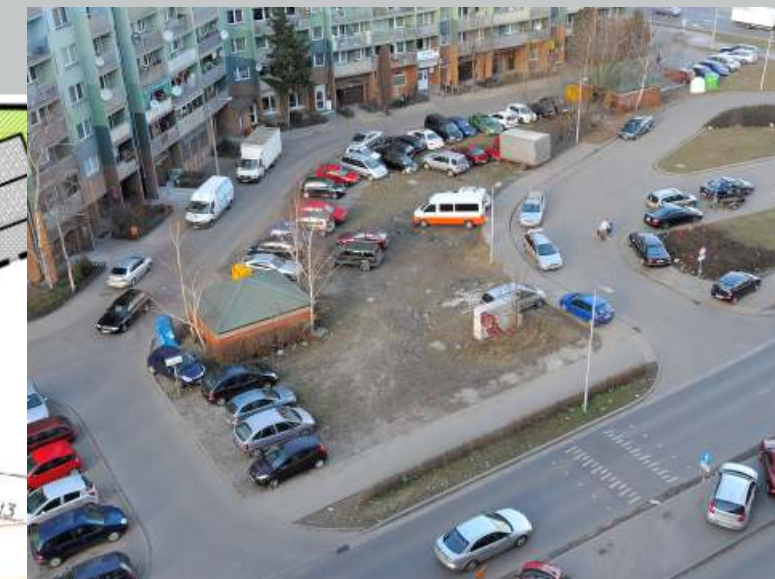
Widok z góry na wschodnią część obszaru objętego opracowaniem – z prawej strony fragment wybudowanego postoiu dla taksówek. Projektowany parking stanowi naturalne zagospodarowanie dalszej części terenu. Brak uporządkowanych miejsc postojowych powoduje chaos na tym obszarze, zdesperowani kierowcy często parkują nawet na chodnikach przy postoiu dla taksówek.