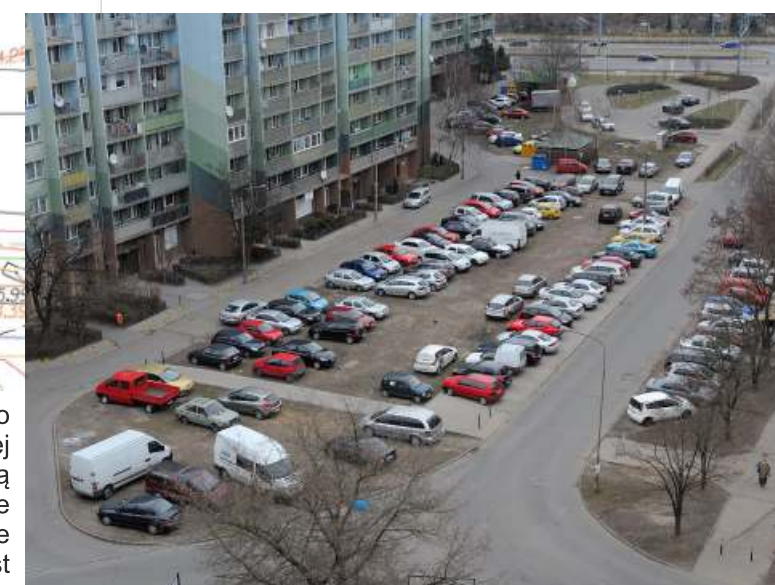
Widok z góry na część obszaru objętego opracowaniem – działki gminne wzdłuż ul. Krynickiej nie są zagospodarowane. W czasie deszczu robią się w tym miejscu gigantyczne kałuże i wszechobecne błoto. Zdjęcie zostało wykonane w czasie godzin pracy – wieczorami „parking” jest wykorzystany w 100%.