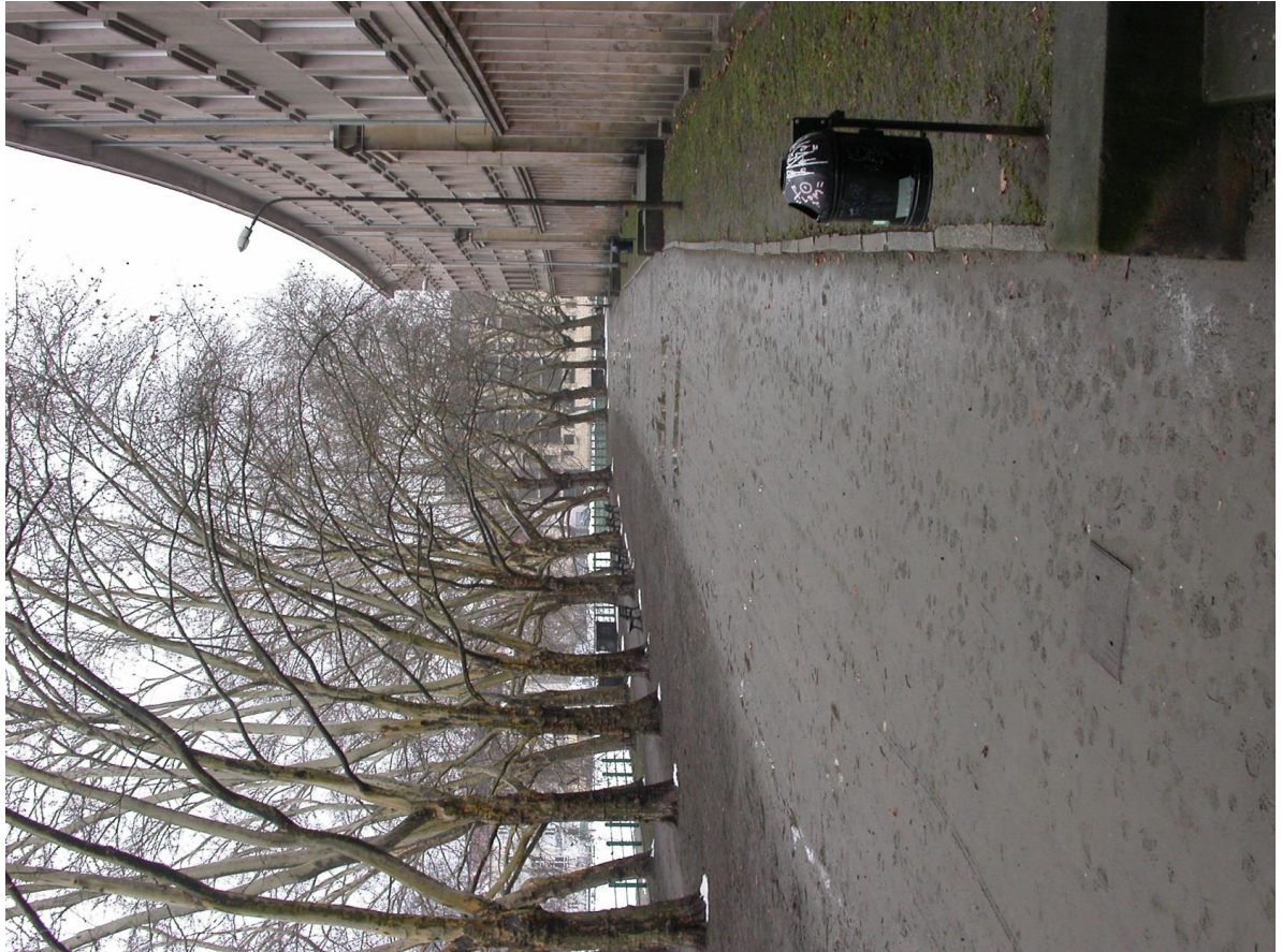
Powyżej - stan obecny, poniżej – propozycja zagospodarowania