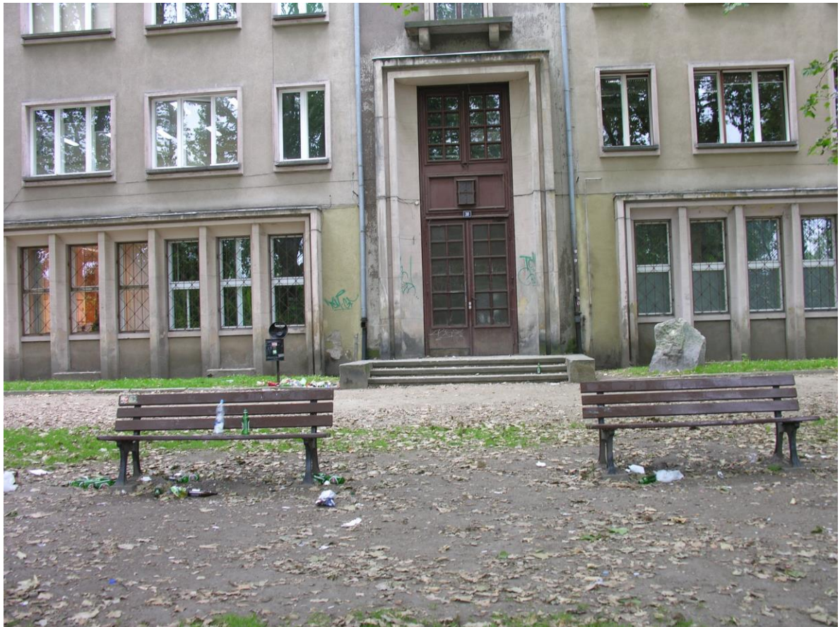
Powyżej - stan obecny, poniżej – propozycja zagospodarowania