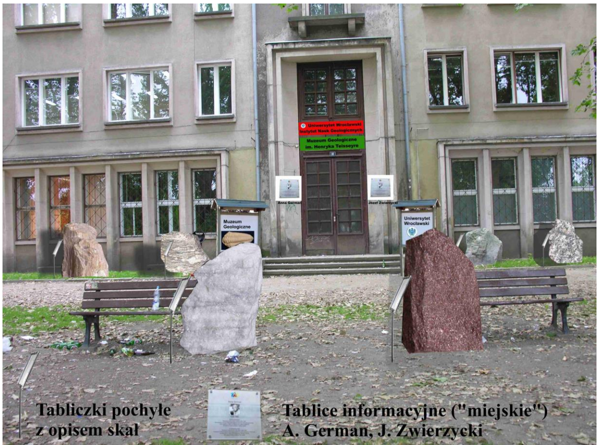
Tabliczki pochyle z opisem skał