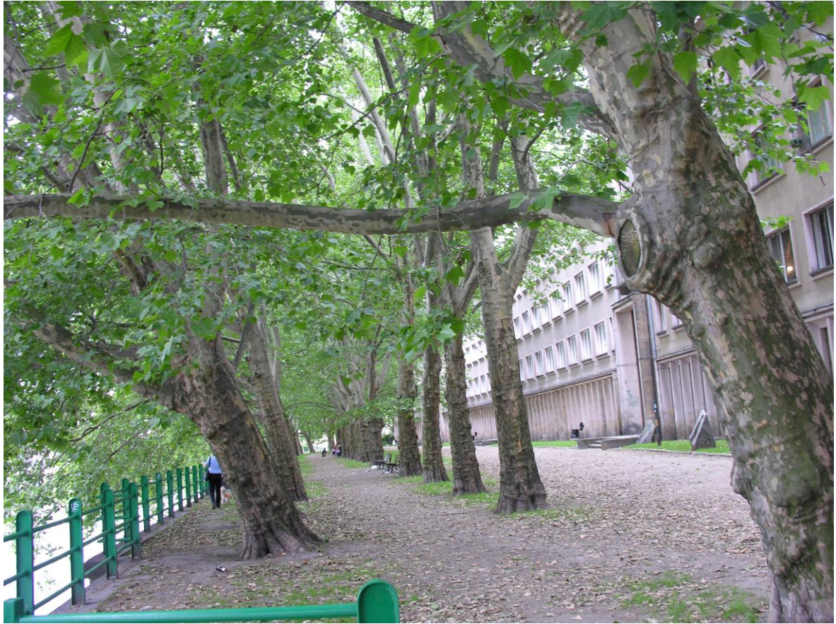
Powyżej - stan obecny, poniżej – propozycja zagospodarowania