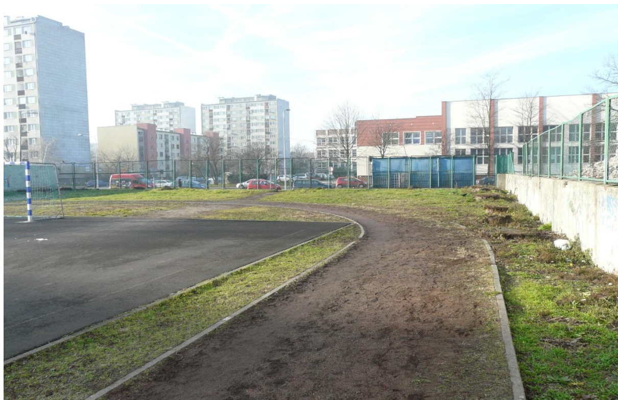
Zdjęcie 13 - łuk bieżni okrężnej po prawej miejsce na kawałek tartanu rozgrzewkowego.