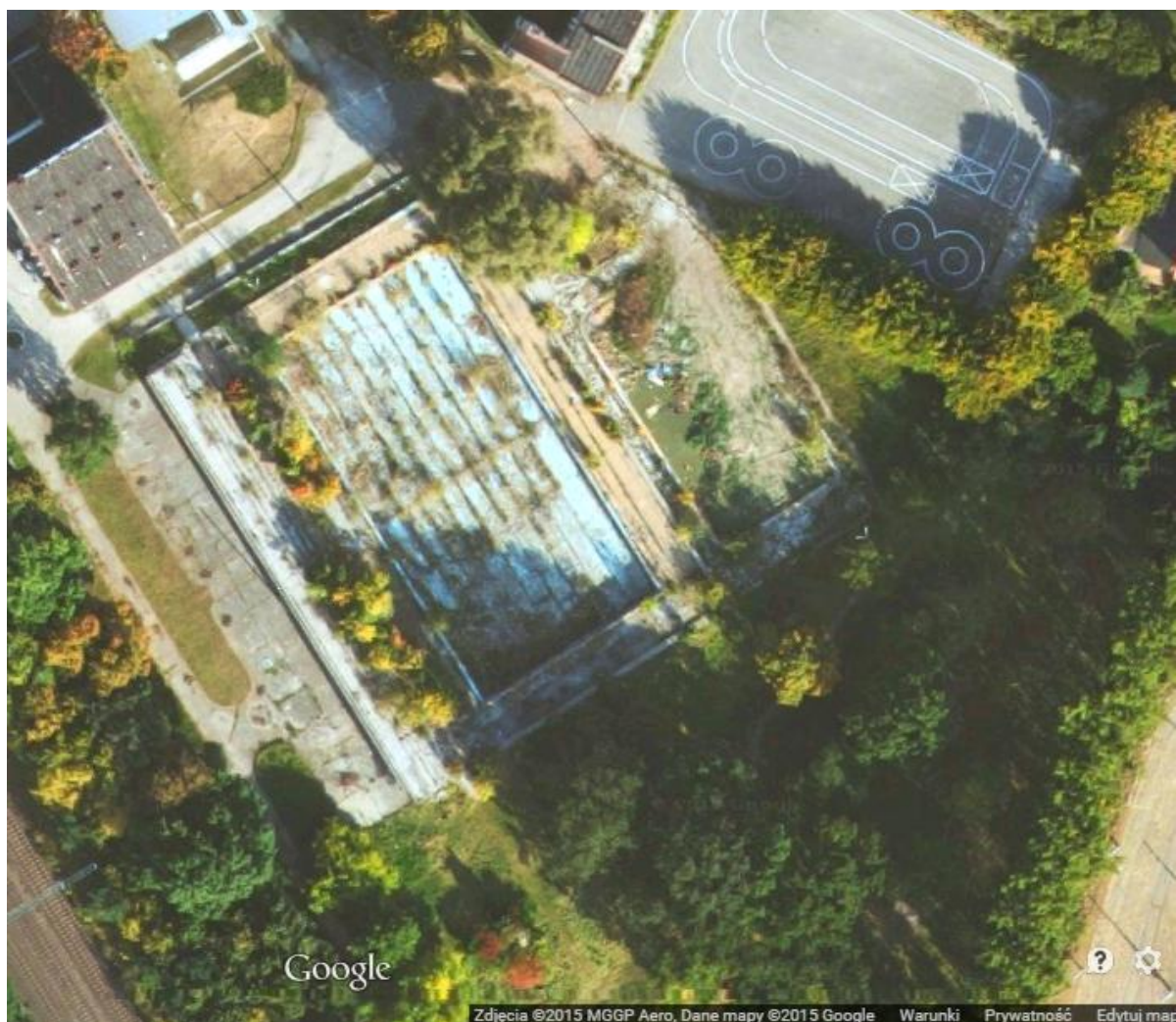
Stan niecki basenu przy ul. Raclawickiej – rzut z góry