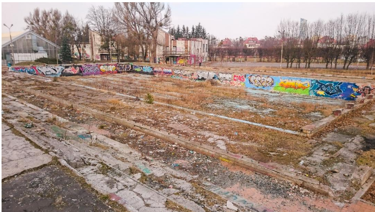
Stan techniczny basenu przy ul. Raclawickiej (2)