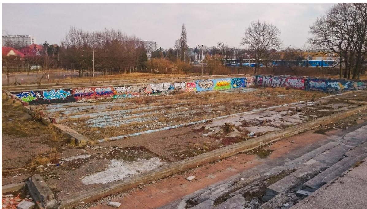
Stan techniczny basenu przy ul. Raławickiej (1)