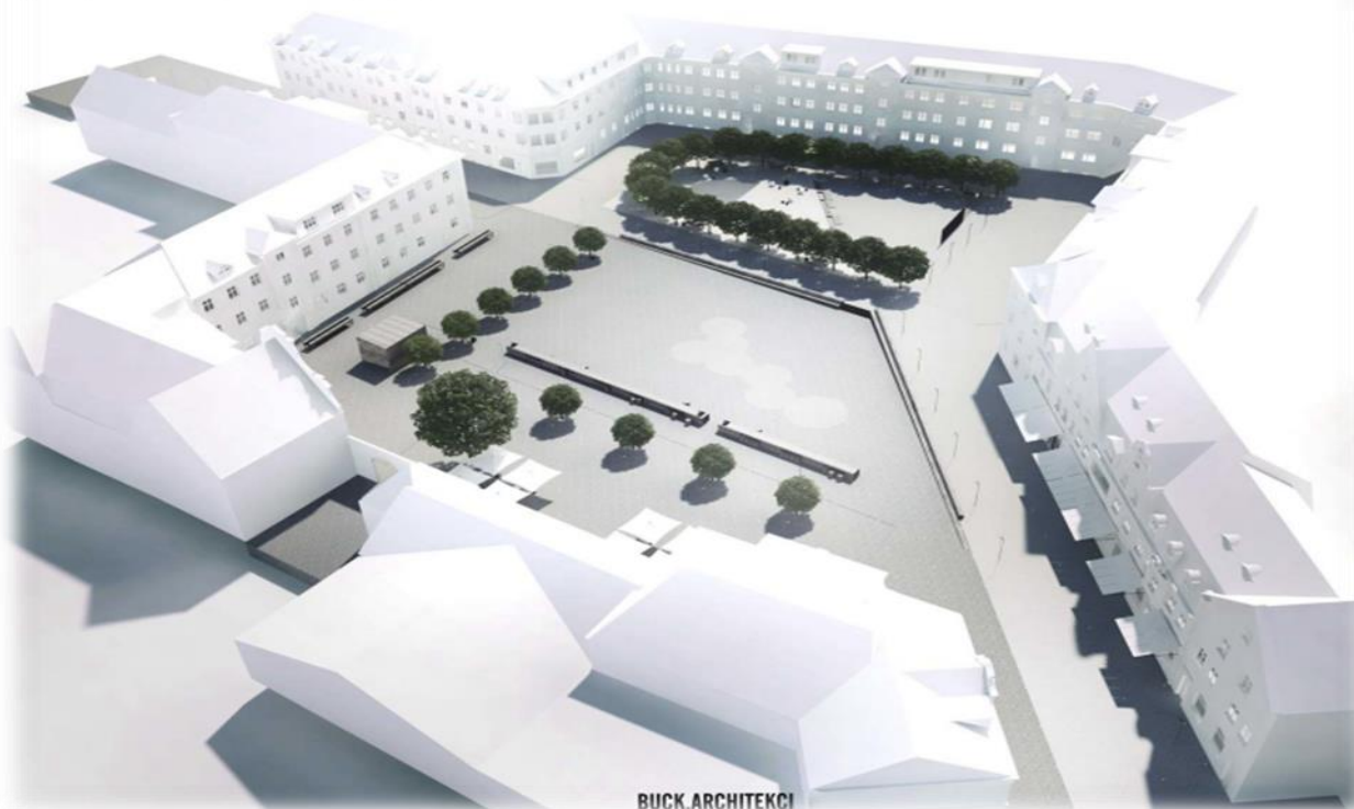
plac piłsudskiego | koncepcja pokonkursowa

Uzyskane uwagi zostaną przekazane Departamentowi Infrastruktury i Gospodarki, który przeprowadzi proces przygotowania dokumentacji projektowej rewitalizacji pl. Józefa Piłsudskiego.