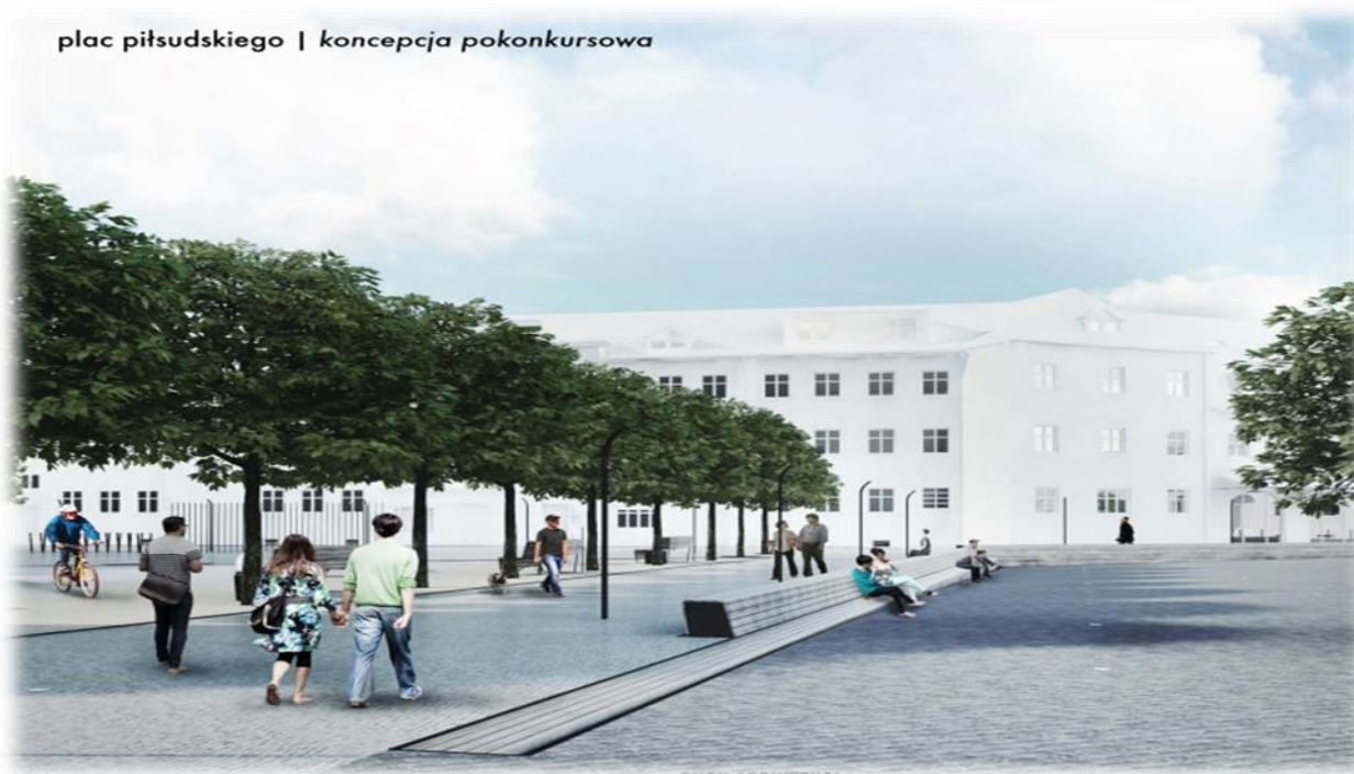
plac piłsudskiego | koncepcja pokonkursowa

Uzyskane uwagi zostaną przekazane Departamentowi Infrastruktury i Gospodarki, który przeprowadzi proces przygotowania dokumentacji projektowej rewitalizacji pl. Józefa Piłsudskiego.