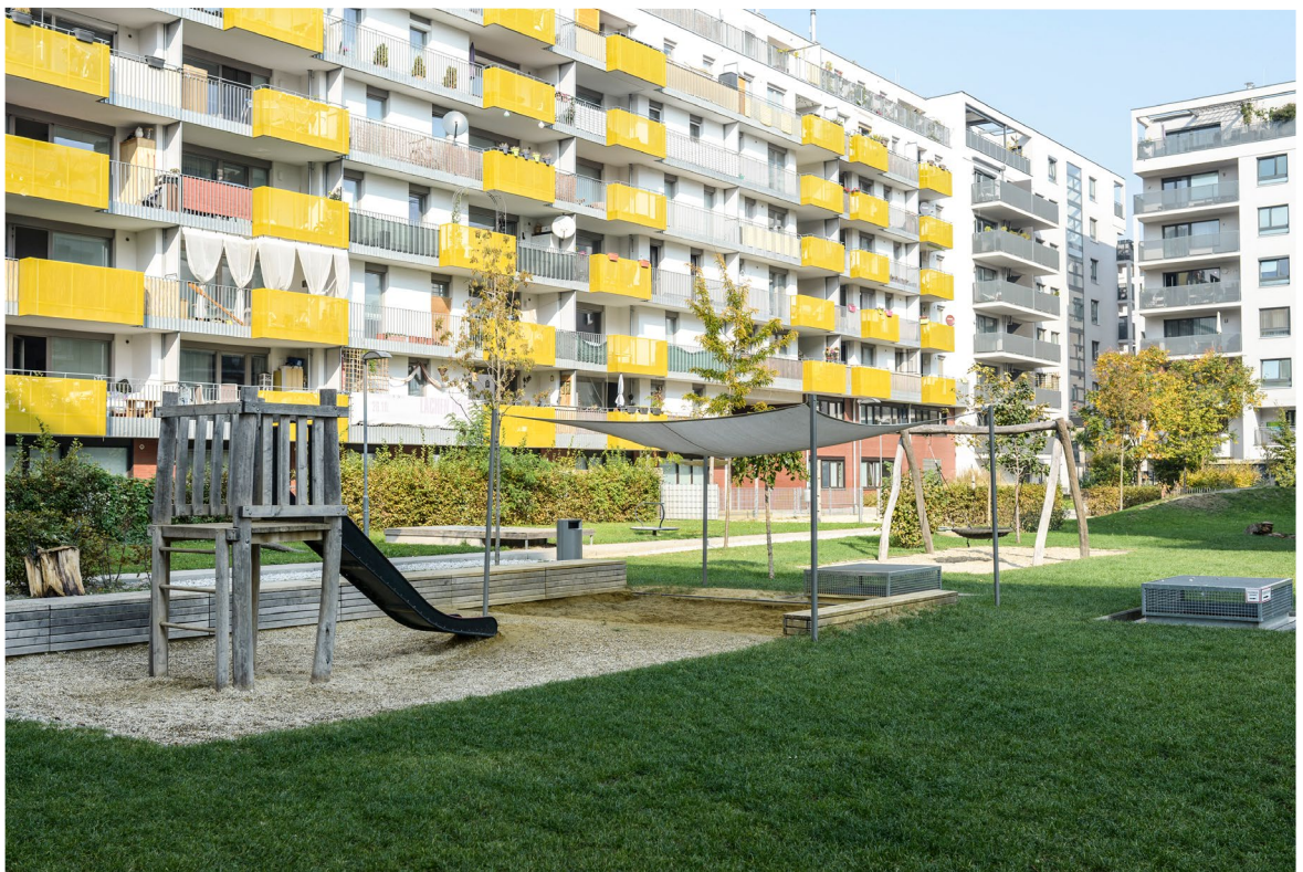
Plac zabaw na nowym osiedlu powstały w wyniku konkursu architektonicznego - Wiedeń