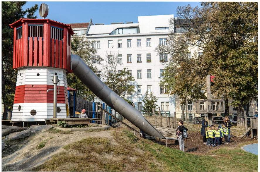
Plac zabaw powstały w wyniku konsultacji społecznych prowadzonych przez zespół menedżera kwartału w Wiedniu.