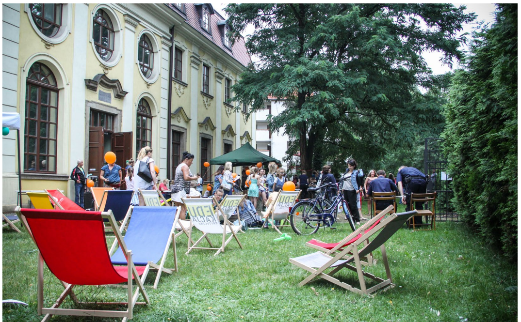
Powitanie Rady Osiedla – piknik organizowany przez Koalicję Oławską na terenie Muzeum Etnograficznego