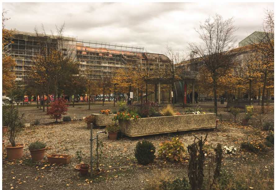
Ogród społeczny prowadzony przez mieszkańca – seniora we współpracy z dziećmi z pobliskiego przedszkola - Genewa.