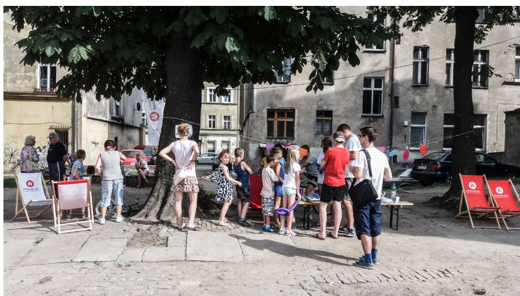
Piknik organizowany przez Stowarzyszenie Edukacji Krytycznej w podwórku na Przedmieściu Oławskim