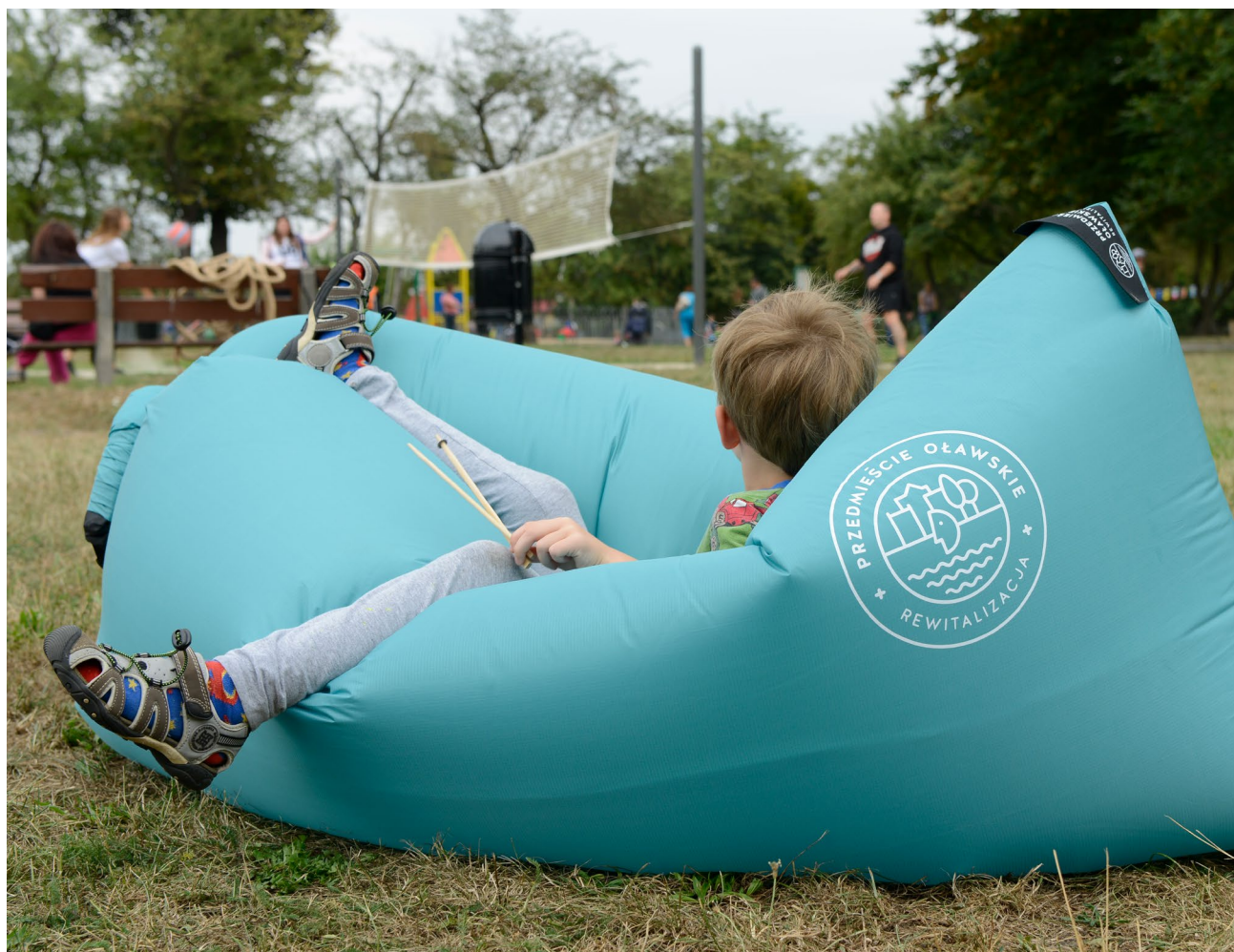
Piknik w parku na Niskich Łąkach promujący projekt zagospodarowania nabrzeży rzeki Oławy

W Polsce manager kwartału jest nowym sposobem myślenia o mieście i radzenia sobie z problemami charakterystycznymi dla obszaru rewitalizacji. W krajach Europy Zachodniej ta funkcja jest powszechna. Managerowie kwartału działają między innymi w Niemczech, w Austrii i Holandii.