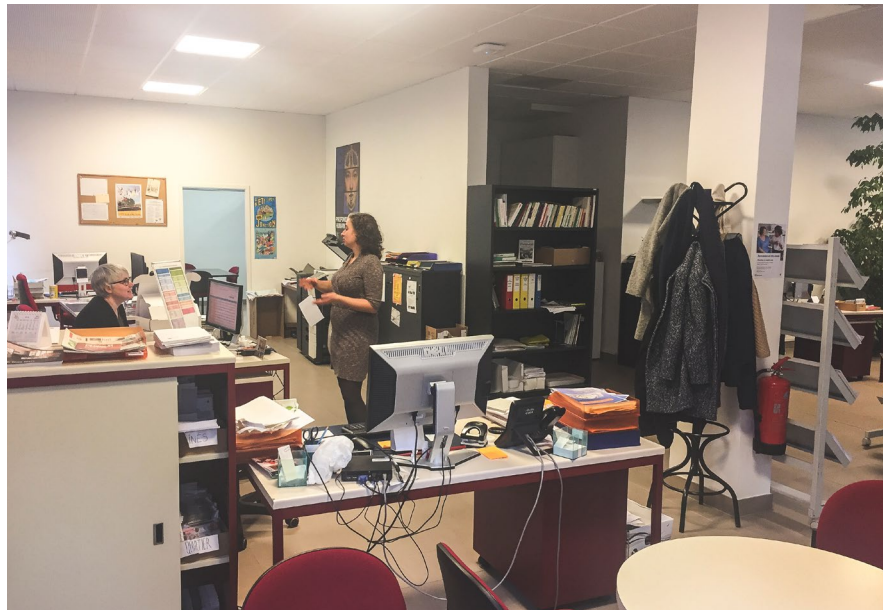
Biuro Anten Społecznych w dzielnicy Plainpalais Jonction/Acacias w Genewie

przeprowadzają ankiety a następnie wyznaczają wspólnie z mieszkańcami cel, do którego będą z mieszkańcami dążyć (np. pikniki integracyjne). Początkowo Anteny mocno wspierają mieszkańców w organizacji przedsięwzięć, następnie kiedy widzą, że grupa sąsiedzka usamodzielnia się, zespół powoli wycofuje się z roli głównego organizatora działań, udzielając mieszkańcom jeszcze przez jakiś czas koniecznego wsparcia. W następnym kroku animowana grupa mieszkańców samodzielnie podejmuje inicjatywy oddolne, a Anteny diagnozują kolejny obszar wsparcia.