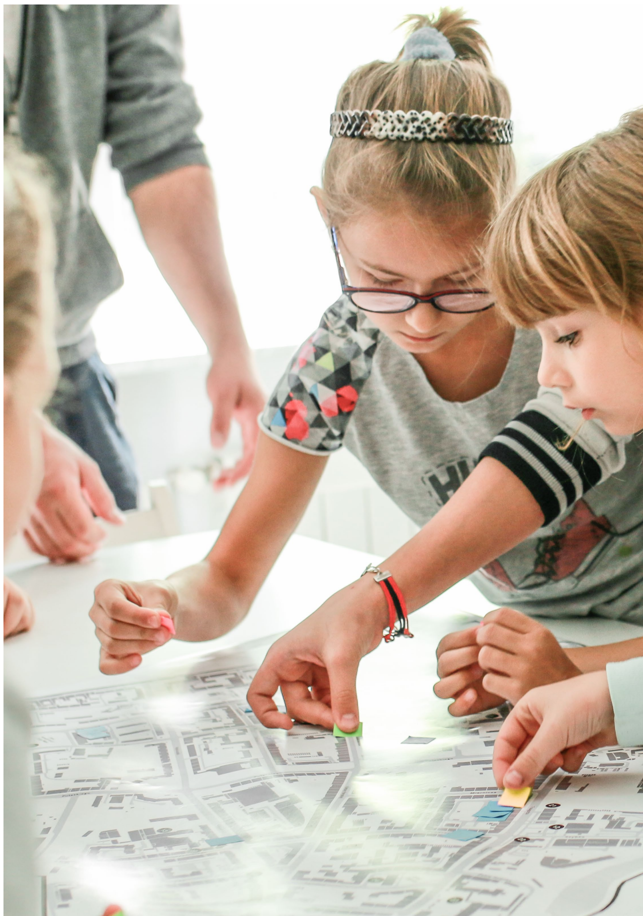
Warsztaty architektoniczne dla dzieci w ramach wydarzenia „Rodzinny weekend na Przedmieściu Oławskim” zorganizowane w ramach projektu „4 kąty na trójkącie”.