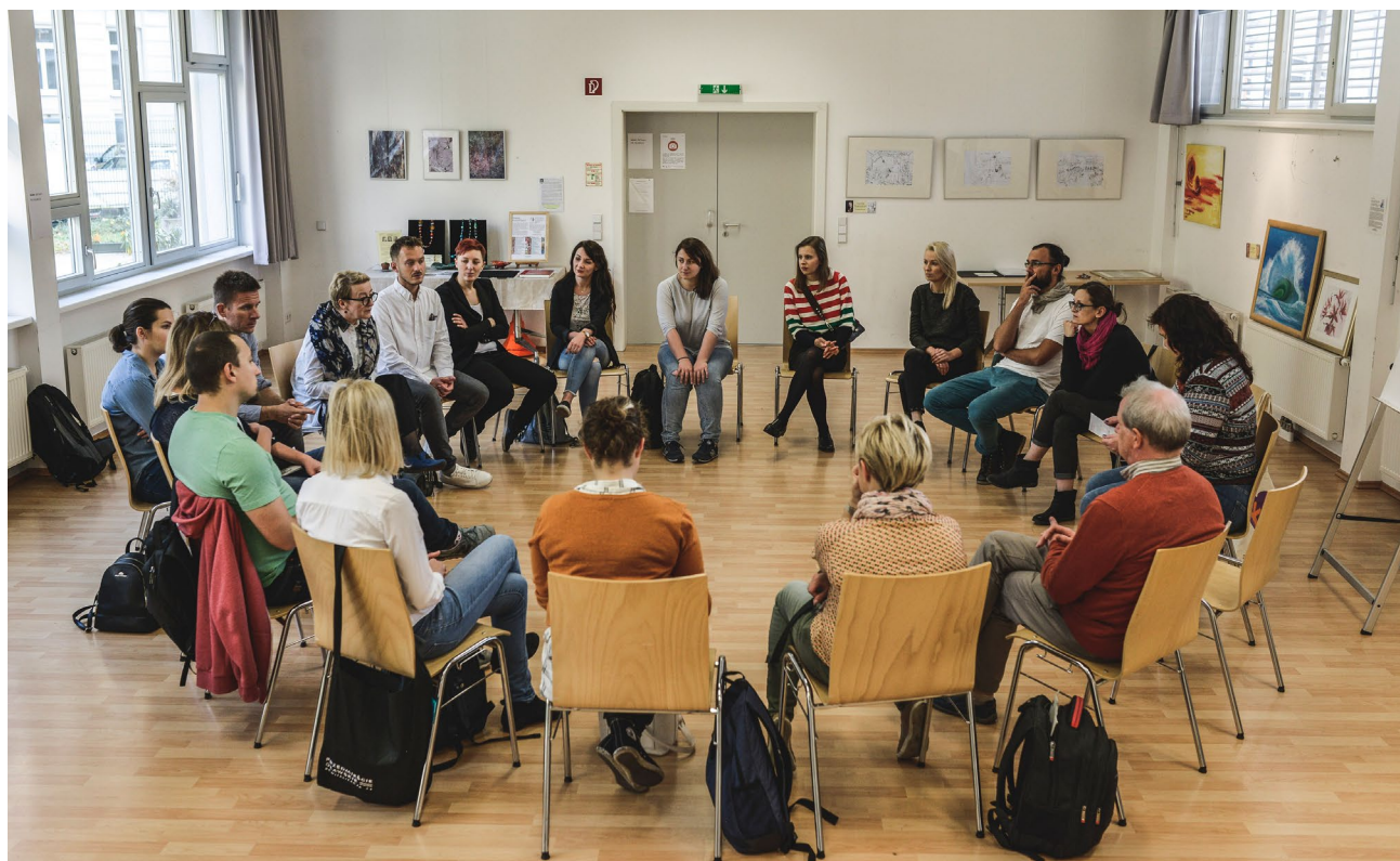
Spotkanie zespołu Wrocławskiej Rewitalizacji z przedstawicielami Gebietsbetreuung Stadterneuerung – Wiedeń