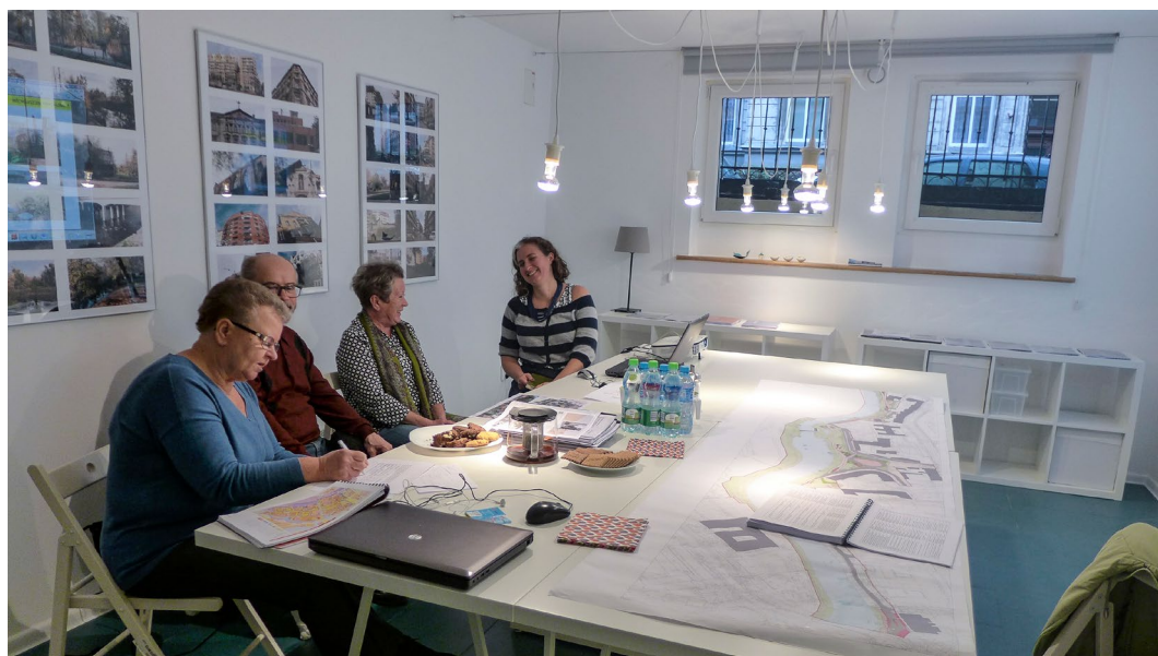
Manager kwartału rozmawia z mieszkańcami w Lokalnym Biurze Rewitalizacji