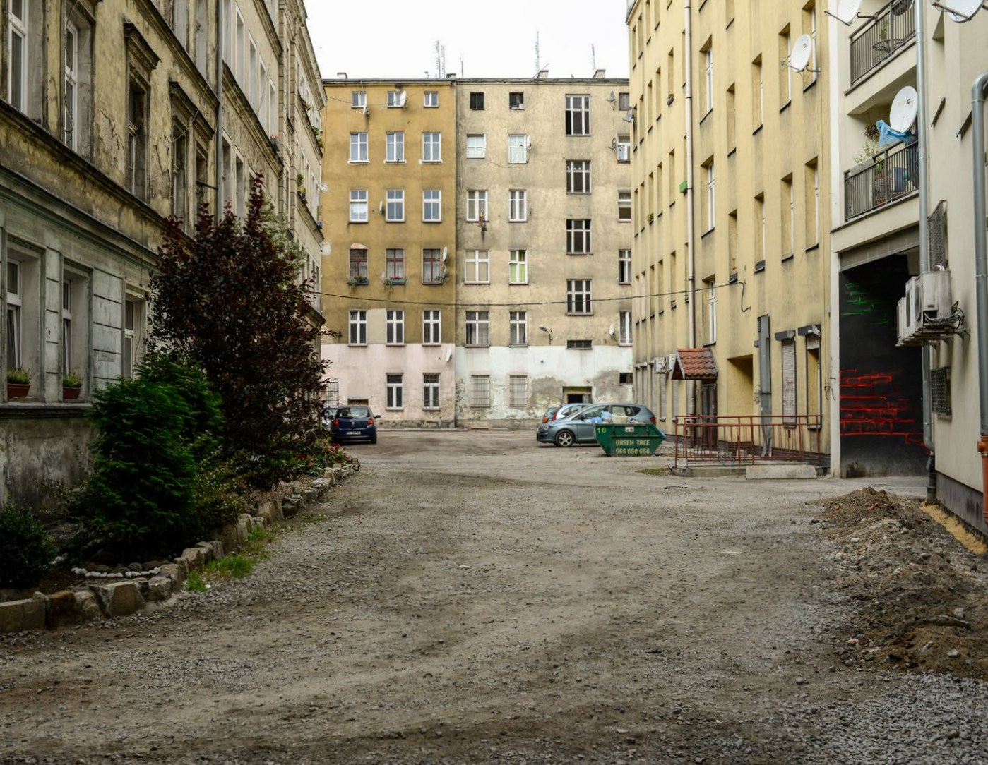
Skromne elewacje i uboga przestrzeń na jednym z podwórek Przedmieścia Oławskiego.

powierzchni pracowni i biur mają do dyspozycji dodatkowy fragment przyległego terenu na wolnym powietrzu. Wrocławskim przykładem jest spółdzielnia PANATO działająca w podwórzu na Nadodrze.