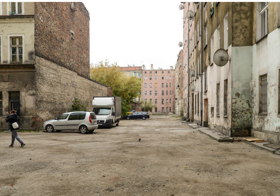
Jedno z wrocławskich podwórek, na którym widać wiele typowych deficytów - brak zieleni i oświetlenia, chaotycznie parkujące samochody, nieprzyjazna przestrzeń.