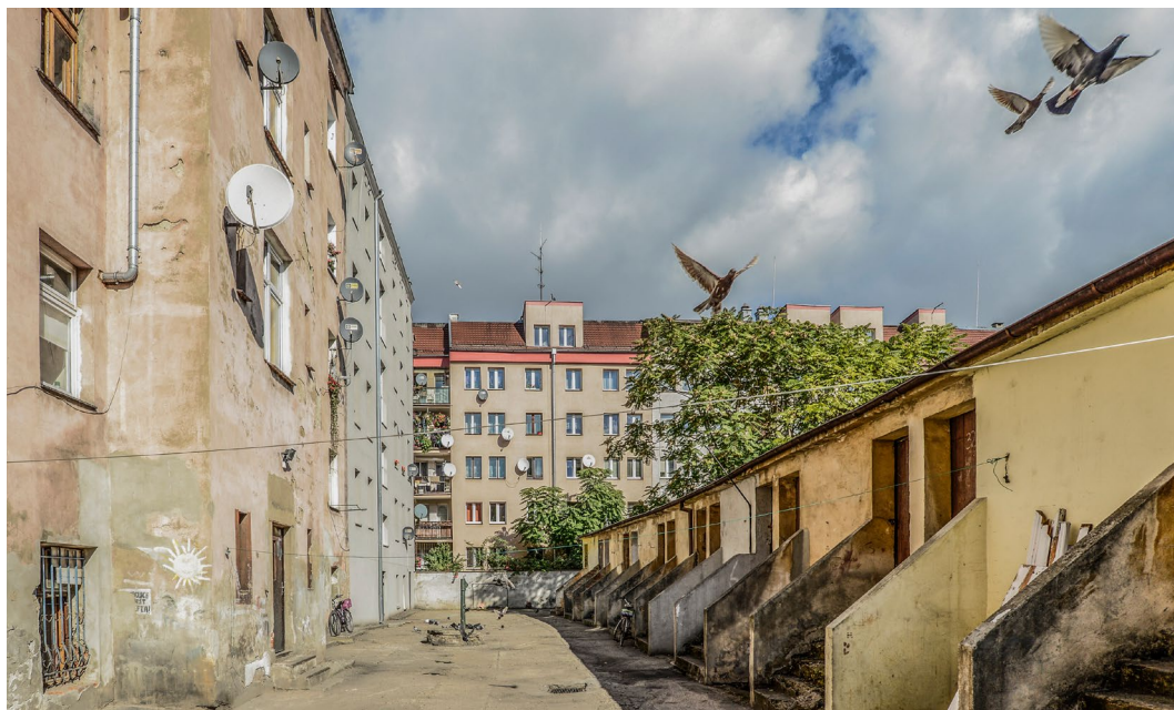
Po prawej stronie widać komórki lokatorskie - na Przedmieściu Oławskim częsty widok, mimo iż mieszkańcy na ogół już z nich nie korzystają.