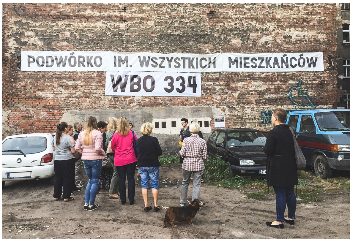
W 2016 roku mieszkańcy kwartału zorganizowali świąteczny festyn i nadali podwórku nazwę: Podwórkko im. Wszystkich Mieszkańców. Projekt boiska i strefy wypoczynku został zgłoszony do Wrocławskiego Budżetu Obywatelskiego i za drugim podejściem w 2018 roku otrzymał dofinansowanie na realizację inwestycji.

Inicjatorem i koordynatorem projektu jest Wrocławska Rewitalizacja Sp. z o.o. W gestii Spółki leży wyłonienie Animatora, Projektanta i Ekspertów w celu sprawnego i efektywnego przeprowadzenia procesu przebudowy podwórza.