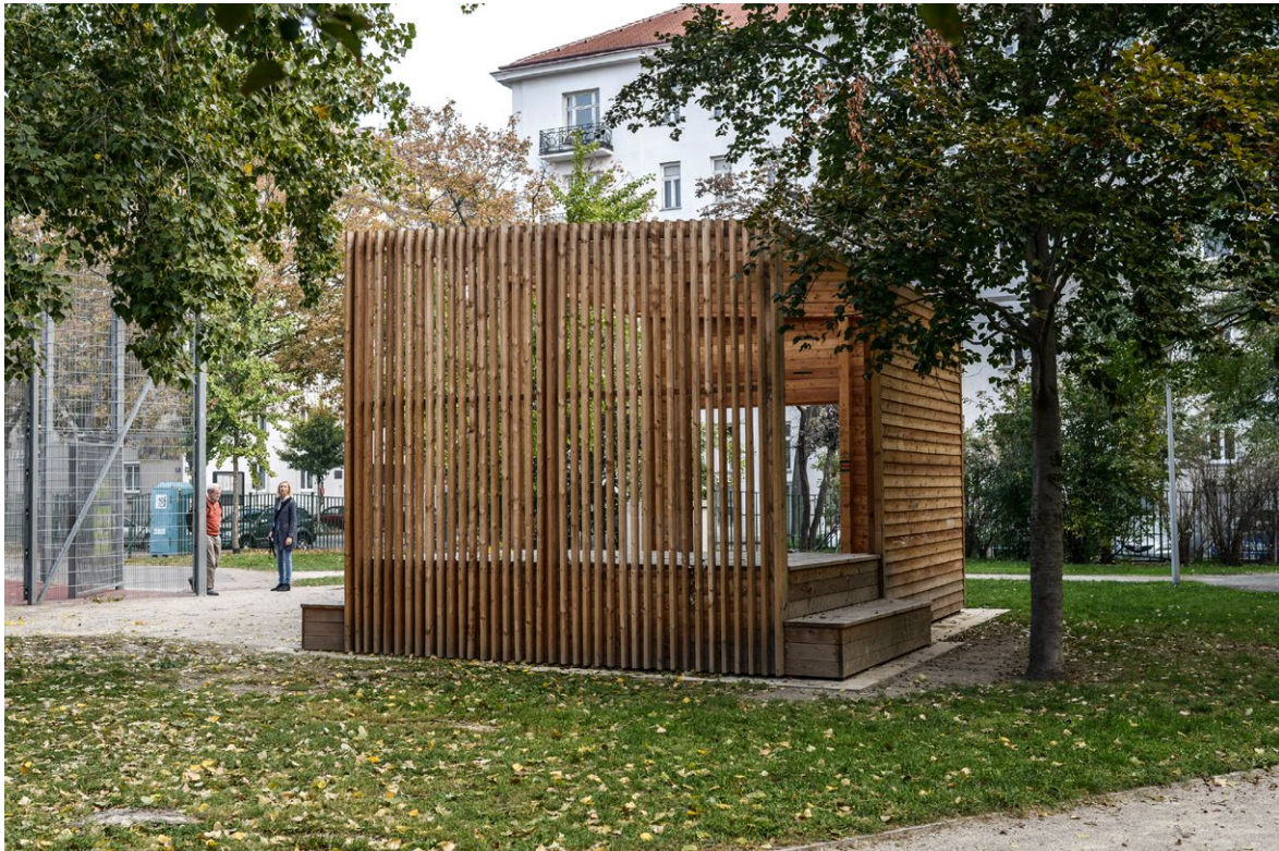
Zadaszenie w podwórzu na osiedlu Stuwerviertel w Wiedniu to dobry przykład urządzonej strefy spotkań dla mieszkańców.