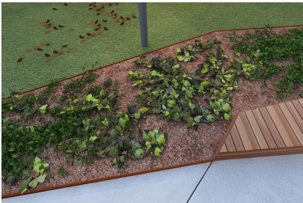
Koncepcja zagospodarowania podwórza im. Wszystkich Mieszkańców. Autor: Maciej Marzecki