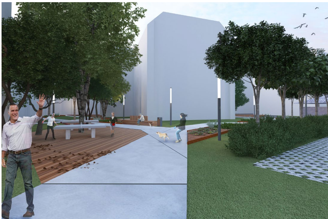
Koncepcja zagospodarowania podwórza im. Wszystkich Mieszkańców. Autor: Maciej Marzecki