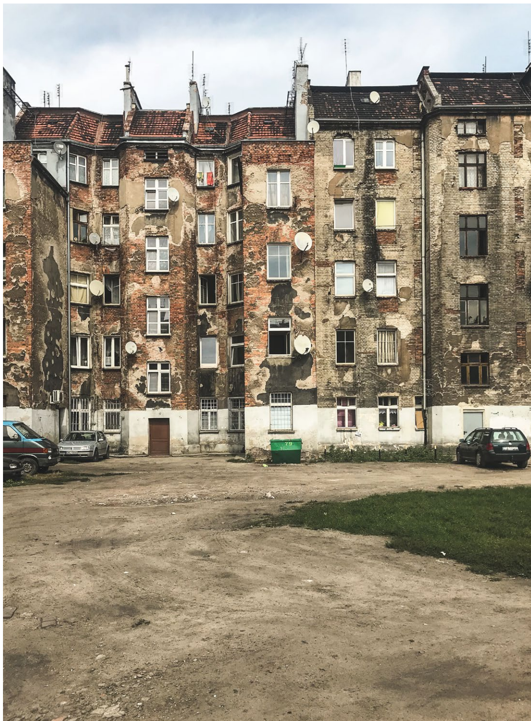
Podwórze im. Wszystkich Mieszkańców w 2018 r.