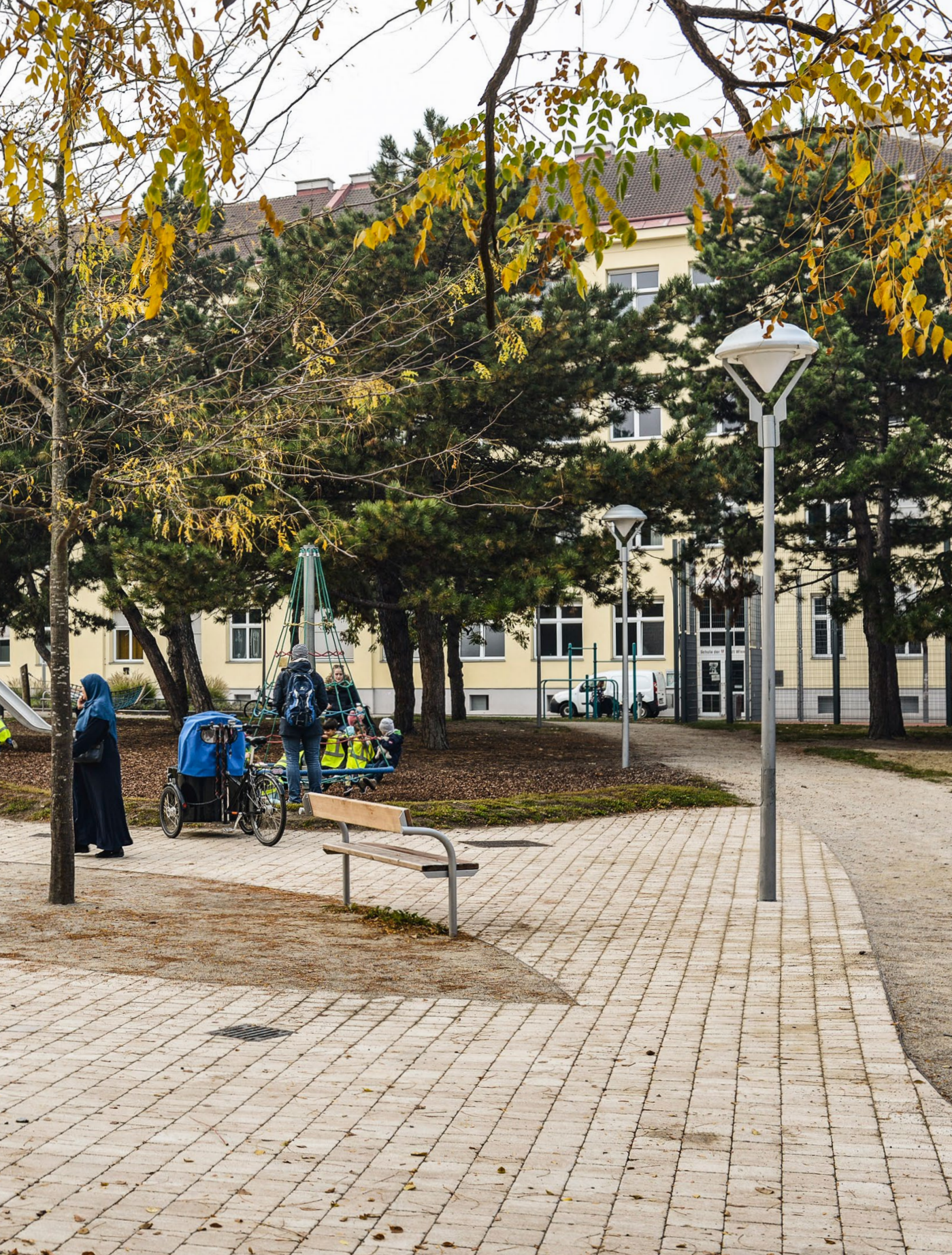
Przykład podwórka w Wiedniu na osiedlu Stuwenviertel, z urządzonej strefą zabaw dla dzieci i miejscami spotkań dla mieszkańców.