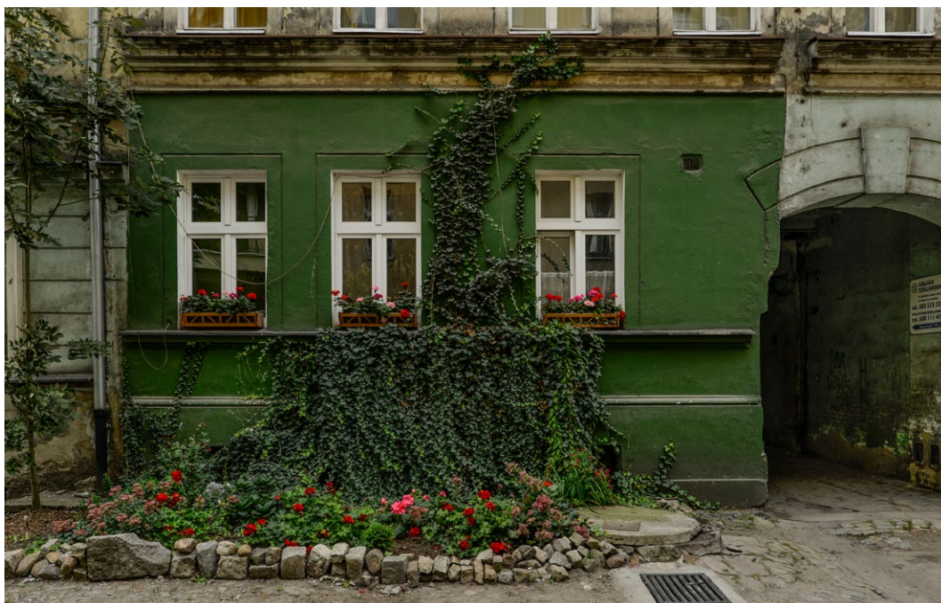
Mieszkańcy jednej z kamienic na Przedmieściu Oławskim sami zadbałi o zagospodarowanie strefy przy elewacji.

Jedną z najbardziej uciążliwych funkcji w podwórzach jest gromadzenie odpadów. Ilość produkowanych odpadów jest coraz większa, zmieniają się również regulacje dotyczące ich segregacji. Systematycznie w podwórzach rośnie zapotrzebowanie na ilość kontenerów. Rozwiązaniem tego problemu może być zwiększenie częstotliwości wywożenia odpadów. Projektując zagospodarowanie wnętrza podwórzowego