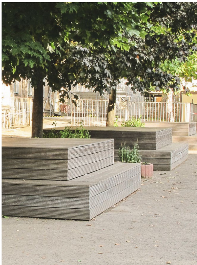
Przykład siedziska zorganizowanego w cieniu drzew w Dreźnie.