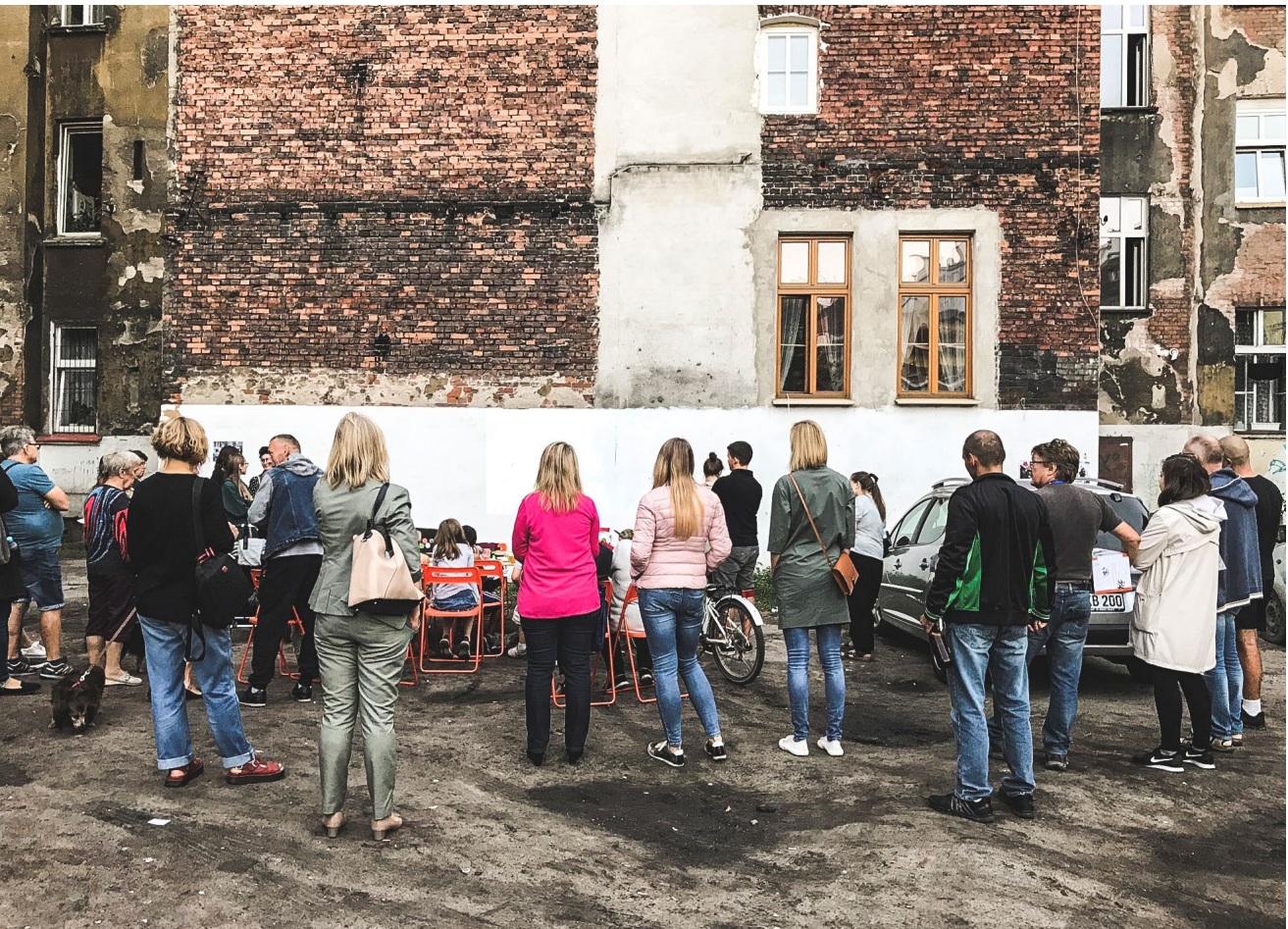
Spotkanie animacyjne z mieszkańcami w Podwórku im. Wszystkich Mieszkańców.