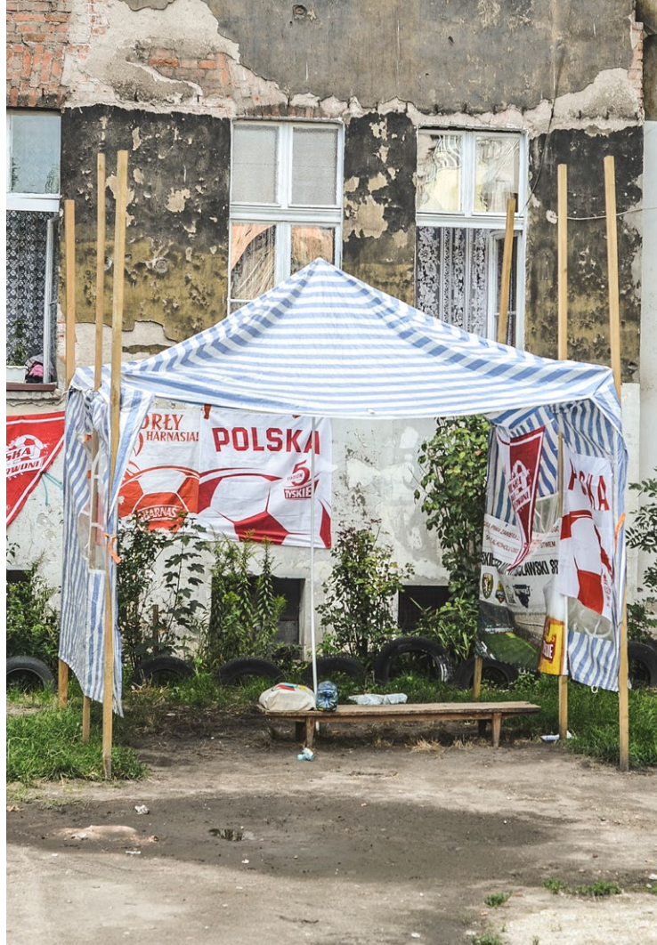
Na wielu podwórkach widać próby urządzenia terenu w sposób sprzyjający nawiązywaniu więzi sąsiedzkich. Na podwórku im. Wszystkich Mieszkańców utworzono latem prowizoryczną strefę kibica, w której sąsiedzi oglądali razem mecze na wystawionym telewizorze.