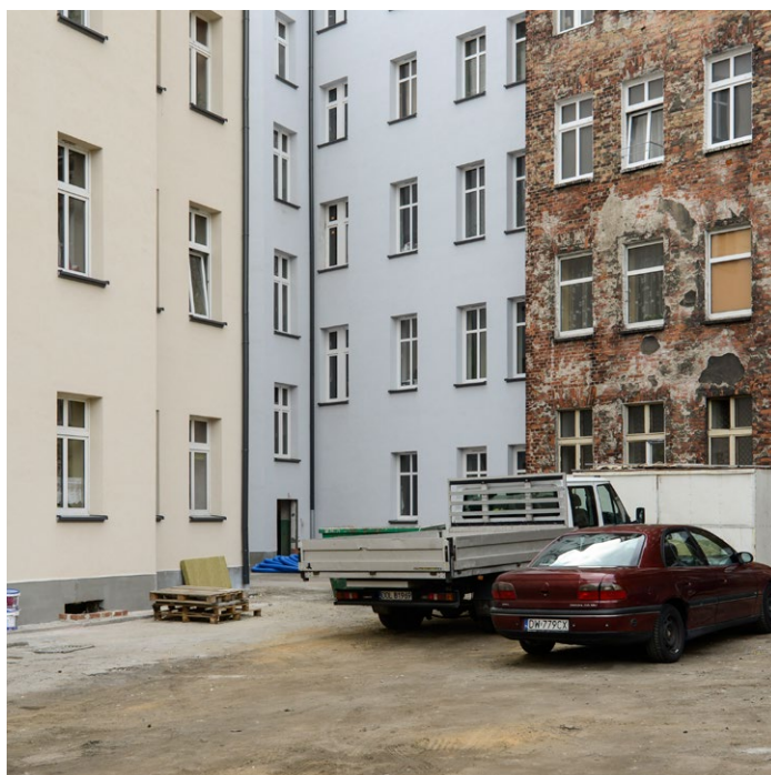
Elewacje od strony podwórka po remoncie i termomodernizacji.