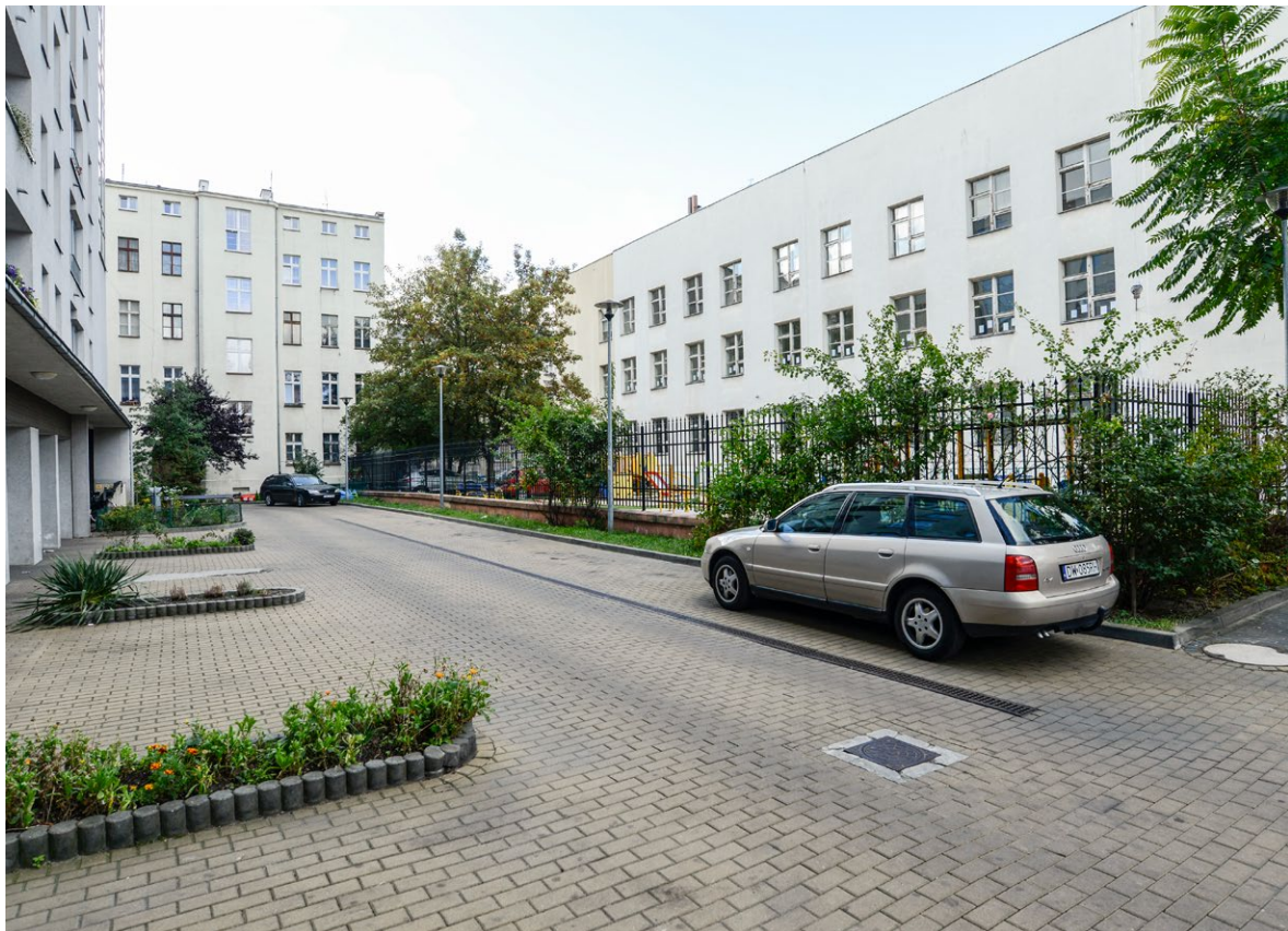
Droga wewnętrzna na podwórzu zlokalizowanym przy ulicy Pułaskiego na Przedmieściu Oławskim. Większa część przestrzeni została wybrukowana.