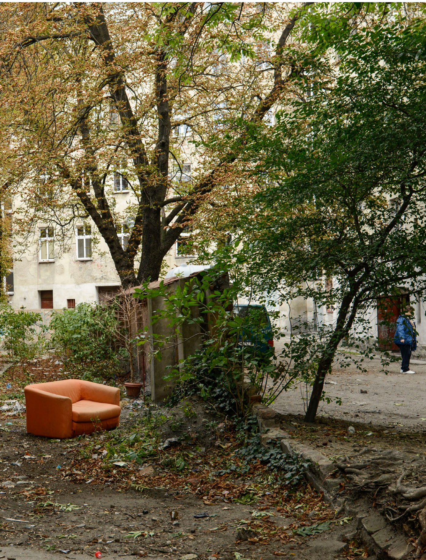
Takie widoki stają się coraz rzadsze - miasto sukcesywnie remontuje podwórka, a mieszkańcy chętnie dbają o nowo urządzone przestrzenie.