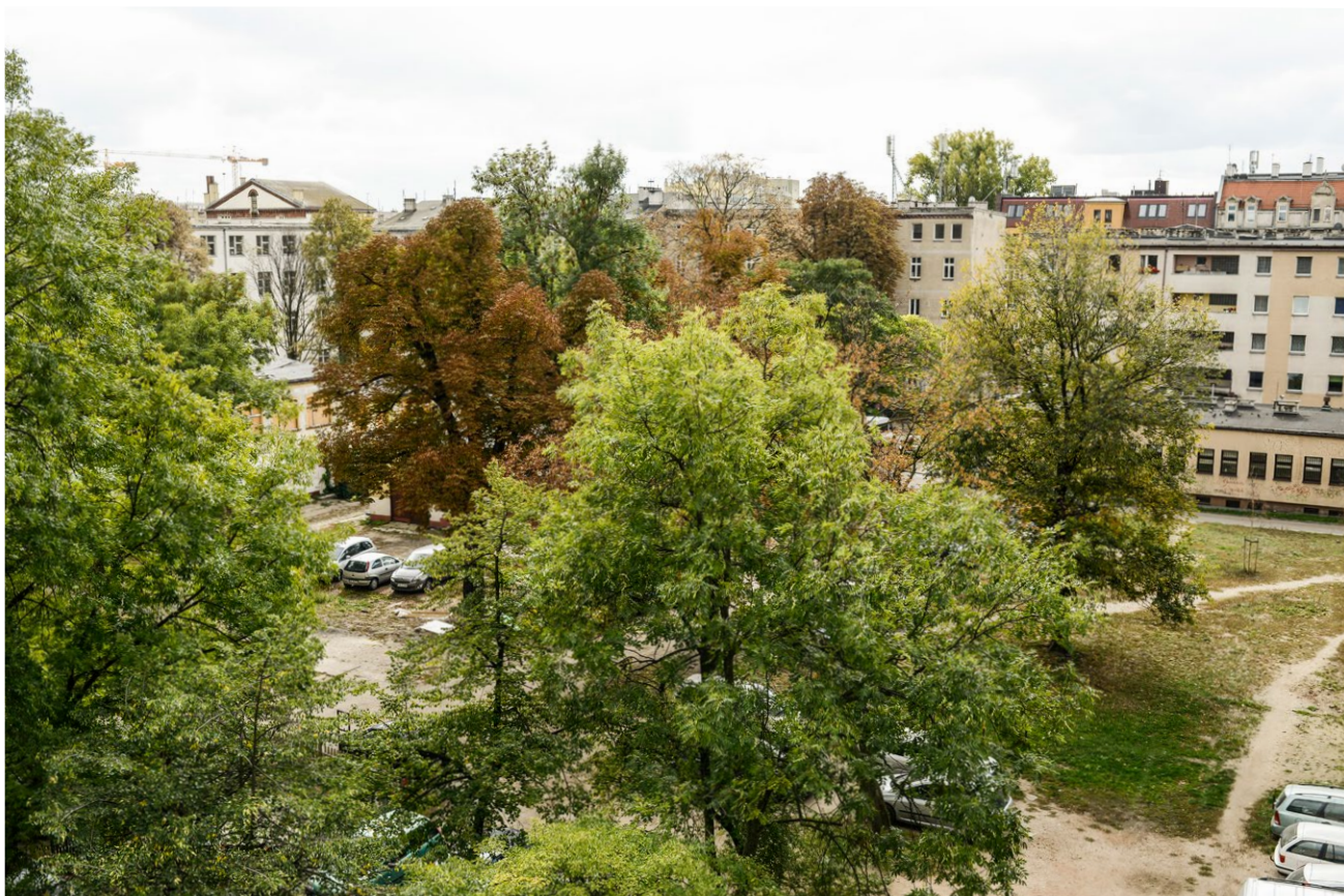
Przykład zieleni wysokiej zachowanej na jednym z podwórz na Przedmieściu Oławskim.

Zgodnie z ww. dokumentem w procesie planowania inwestycji należy dążyć do zachowania istniejącego drzewostanu. Kiedy nie jest to możliwe, należy wyrównać stratę drzew „dla których decyzja administracyjna nie ustaliła obowiązku wykonania nasadzeń zastępczych lub kompensacyjnych”. W zarządzeniu zapisano również, że „liczba nasadzeń wyrównujących jest zależna od przyczyny usunięcia, wskaźników obwodów pni i lokalizacji drzew usuwanych oraz lokalizacji nasadzeń wyrównujących.”