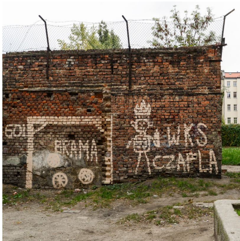
Widoki jak na tym podwórku pokazują lokalny koloryt.