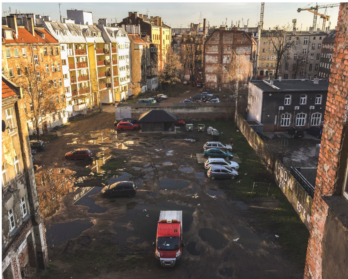
Podwórze im. Wszystkich Mieszkańców jest jednym z najbardziej zaniedbanych na Przedmieściu Oławskim.

http://izarutkowska.com/2018/09/14/przykladowy-projekt/#etap-3