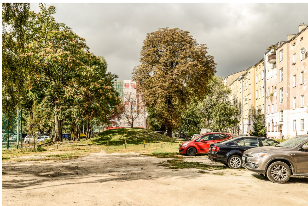
Na niektórych podwórkach wystarczy tylko uporządkować przestrzeń i wydzielić strefy dla poszczególnych funkcji. Istniejący starodrzew jest nieocenionym atutem tych miejsc.