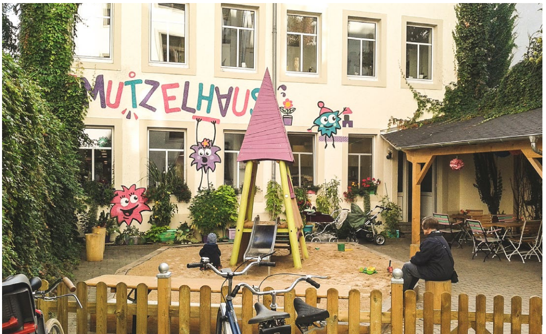
Przykład wydzielonej strefy rekreacji w podwórku w Dreźnie – piaskownica dla najmłodszych oraz altana z krzesłami dla starszych.