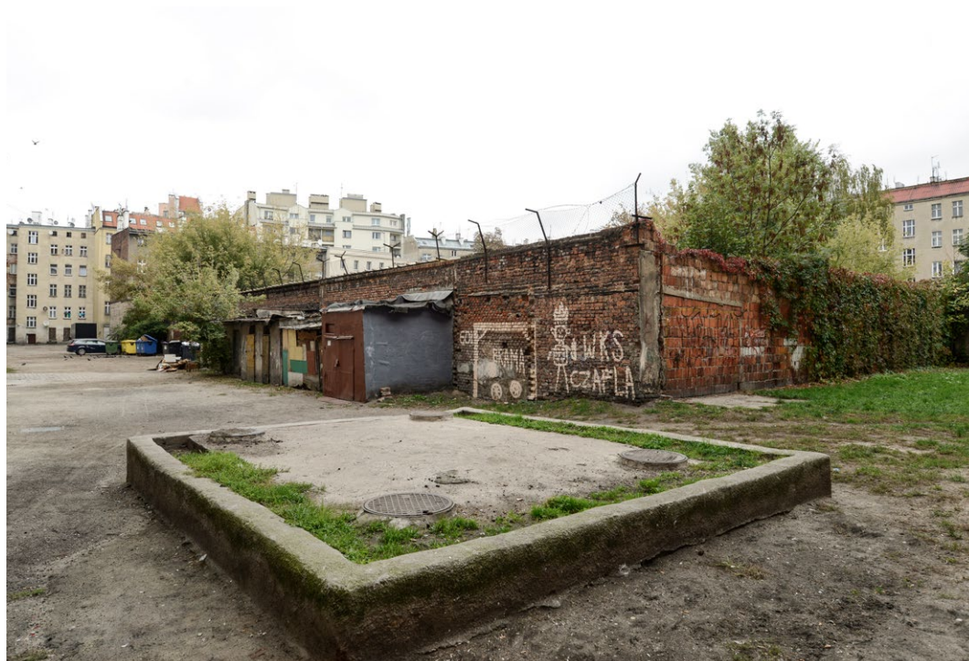
Komora ciepłownicza na jednym z podwórek na Przedmieściu Oławskim.