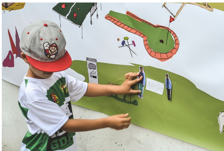
W spotkaniach animacyjnych aktywnie uczestniczyli również młodsi mieszkańcy.