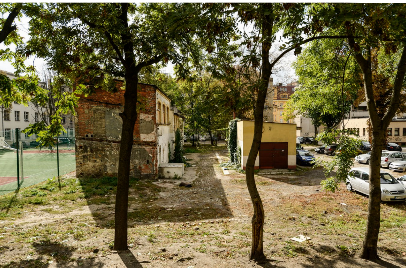
Zabudowa oficynowa i garaże na jednym z podwórek na Przedmieściu Oławskim.

Przedmiotem przetargu nieograniczonego powinno być opracowanie kompleksowej, wielobranżowej dokumentacji projektowo-kosztorysowej zagospodarowania wnętrza podwórzowego. Zgodnie z ustawą PZP możliwe jest określenie warunków udziału w postępowaniu dotyczących zdolności technicznej lub zawodowej potencjalnego zespołu projektowego.