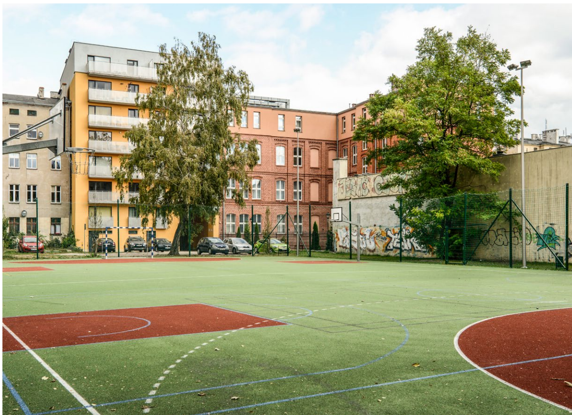
W podwórku ograniczonym ulicami Pułaskiego, Worcella, Krasieńskiego, Komuny Paryskiej znajduje się boisko. Zostało ono zrealizowane dzięki Wrocławskiemu Budżetowi Obywatelskiemu i zgodnie z jego ideą służy wszystkim mieszkańcom.