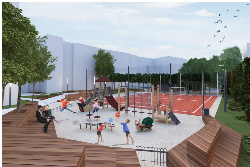
Koncepcja zagospodarowania podwórza im. Wszystkich Mieszkańców. Autor: Maciej Marzecki