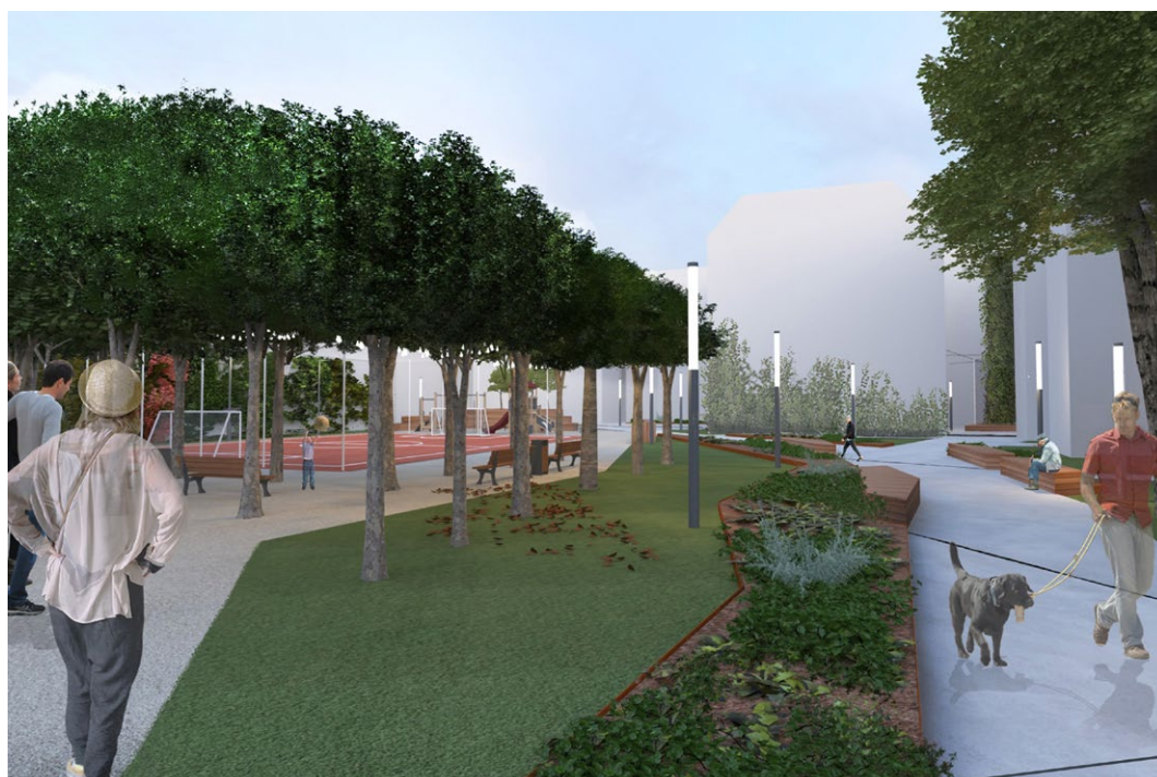
Koncepcja zagospodarowania podwórza im. Wszystkich Mieszkańców. Autor: Maciej Marzecki