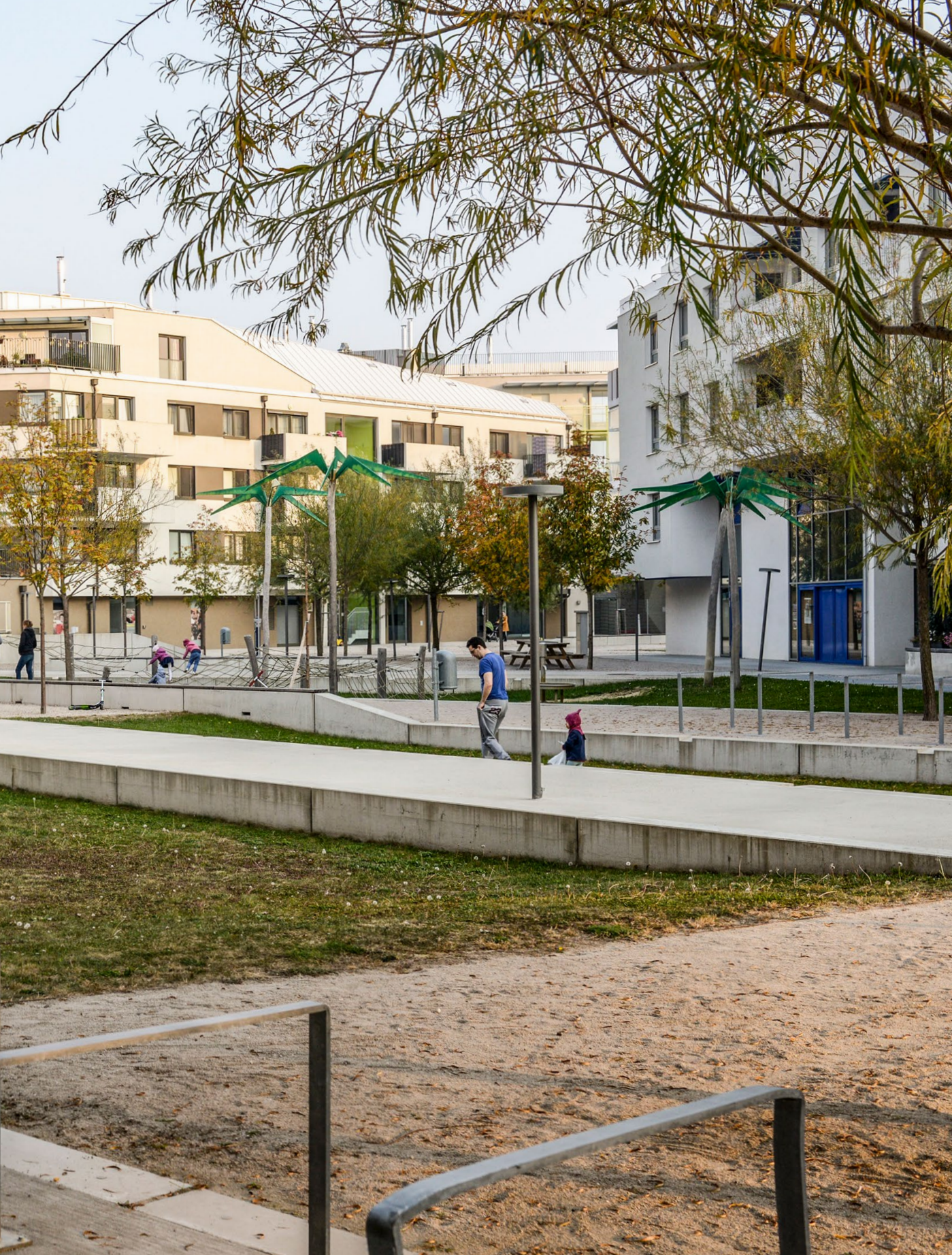
Również nowoczesne rozwiązania - jak kompleks zabudowy Oase 22 w Wiedniu - korzystają z pozytywnych doświadczeń XIX-wiecznej zabudowy i możliwości urządzenia bezpiecznych wnętrz kwartałowych.