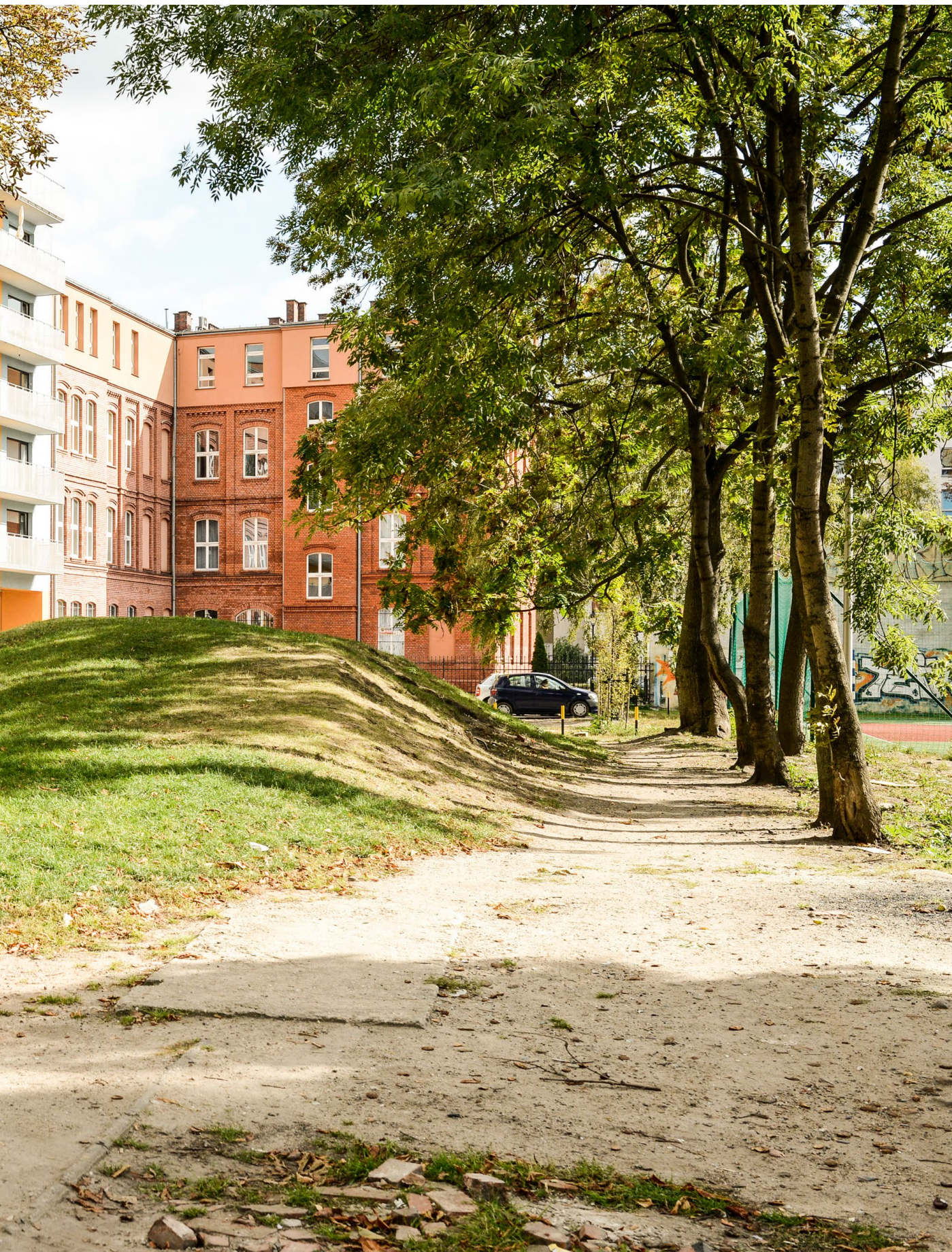
Jedno z podwórek na Przedmieściu Oławskim we Wrocławiu. Mieszkańcy czekają na remont, a w międzyczasie próbują stworzyć przyjemniejszą atmosferę zakładając i pielęgnując przedogródki.