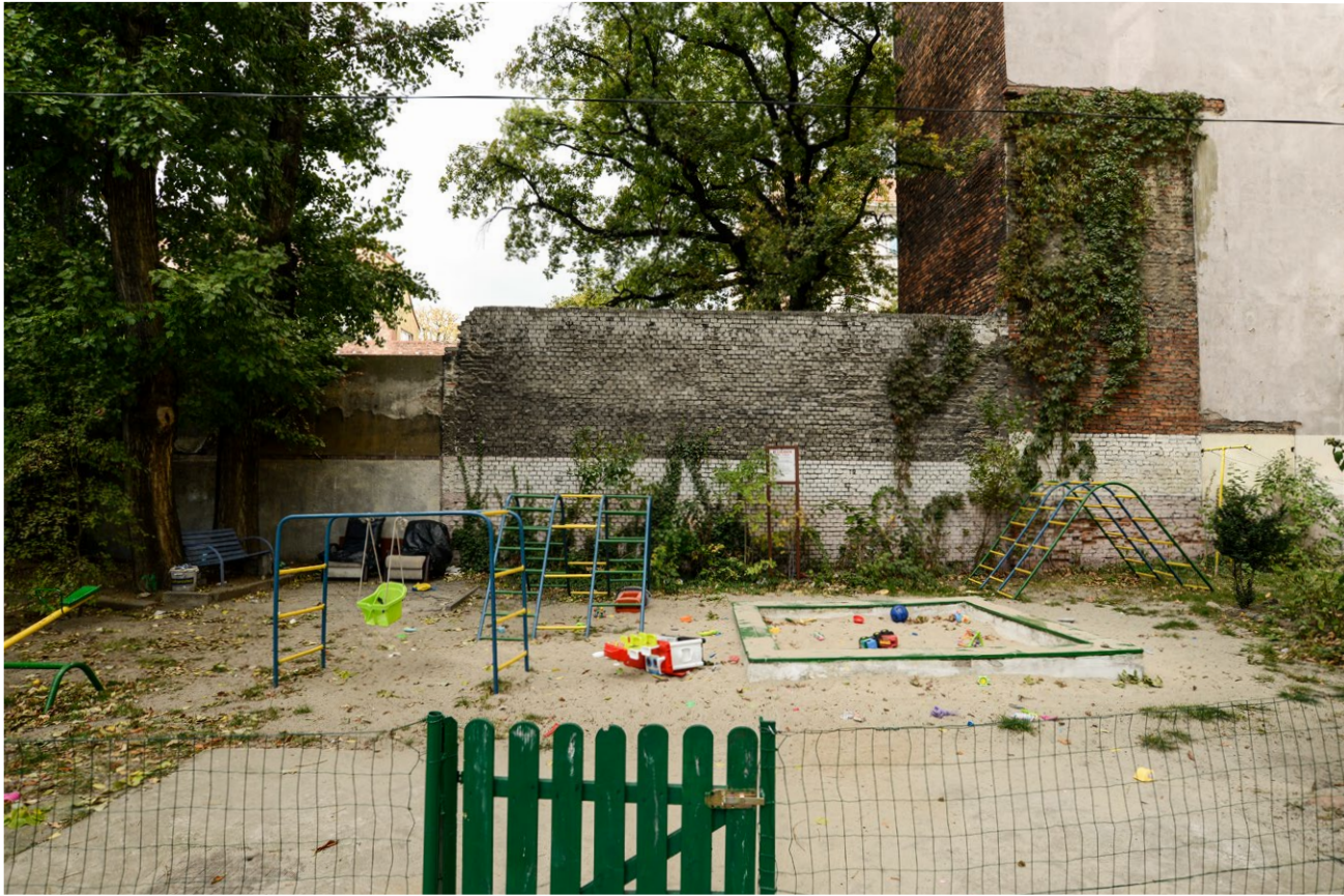
Miejsce zabaw dla dzieci w podwórku na Przedmieściu Oławskim.