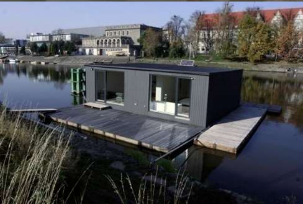
DOM MODELOWY NA WODZIE