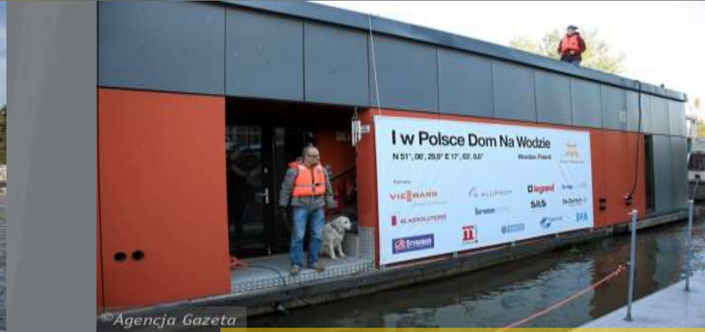
PIERWSZY DOM NA WODZIE