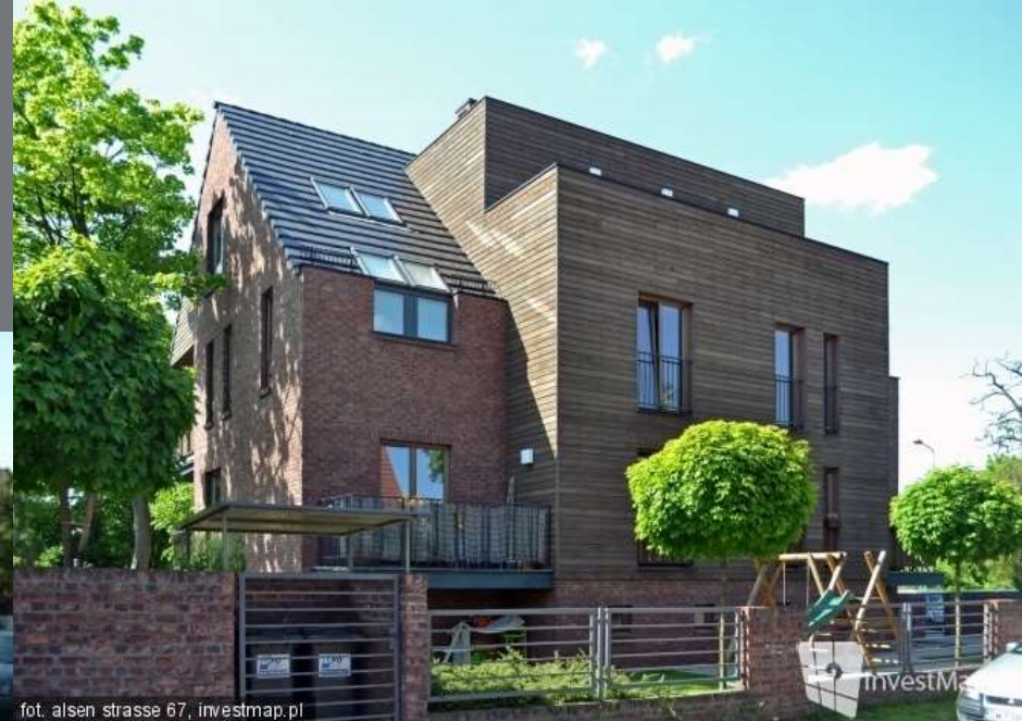
fot. alsen strasse 67, investmap.pl